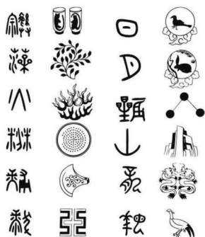
图 2-1 服饰十二章