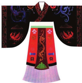
图 2-2 汉代帝王服饰