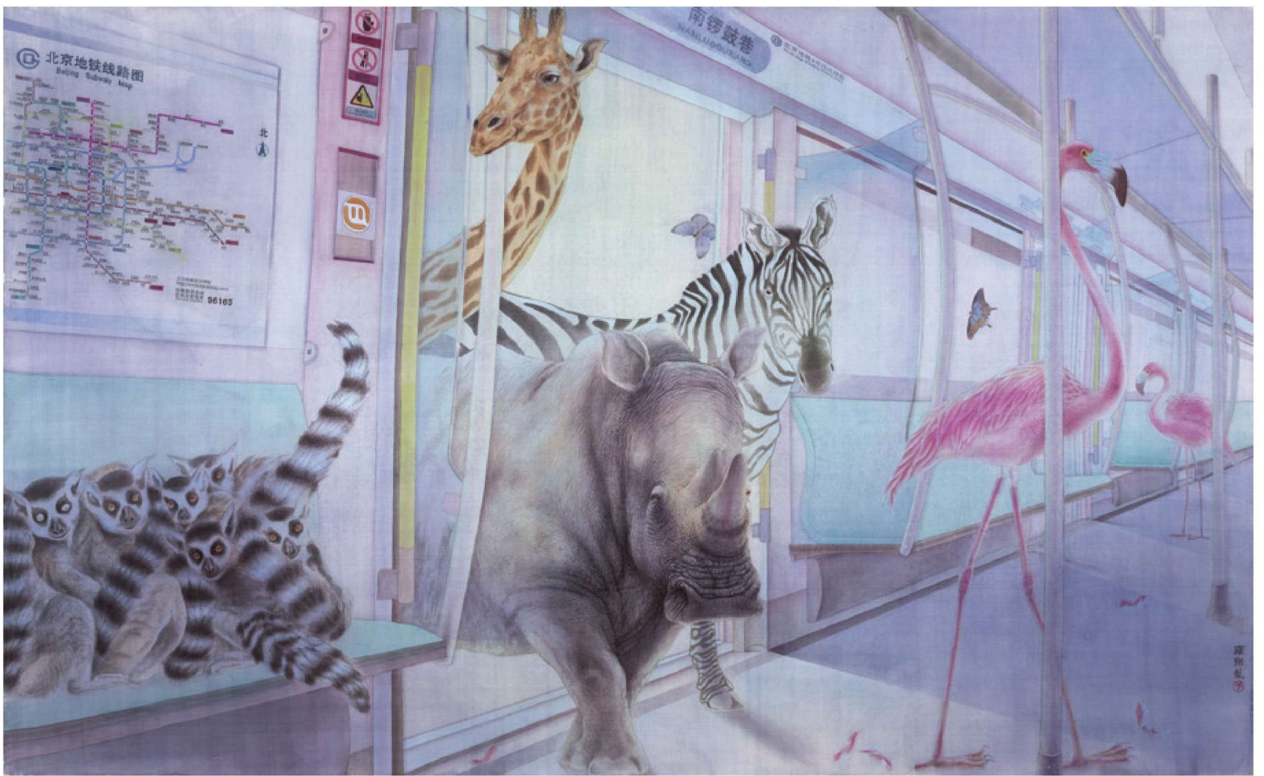
深巷夜语 绢本设色 230cm×140cm 2016年