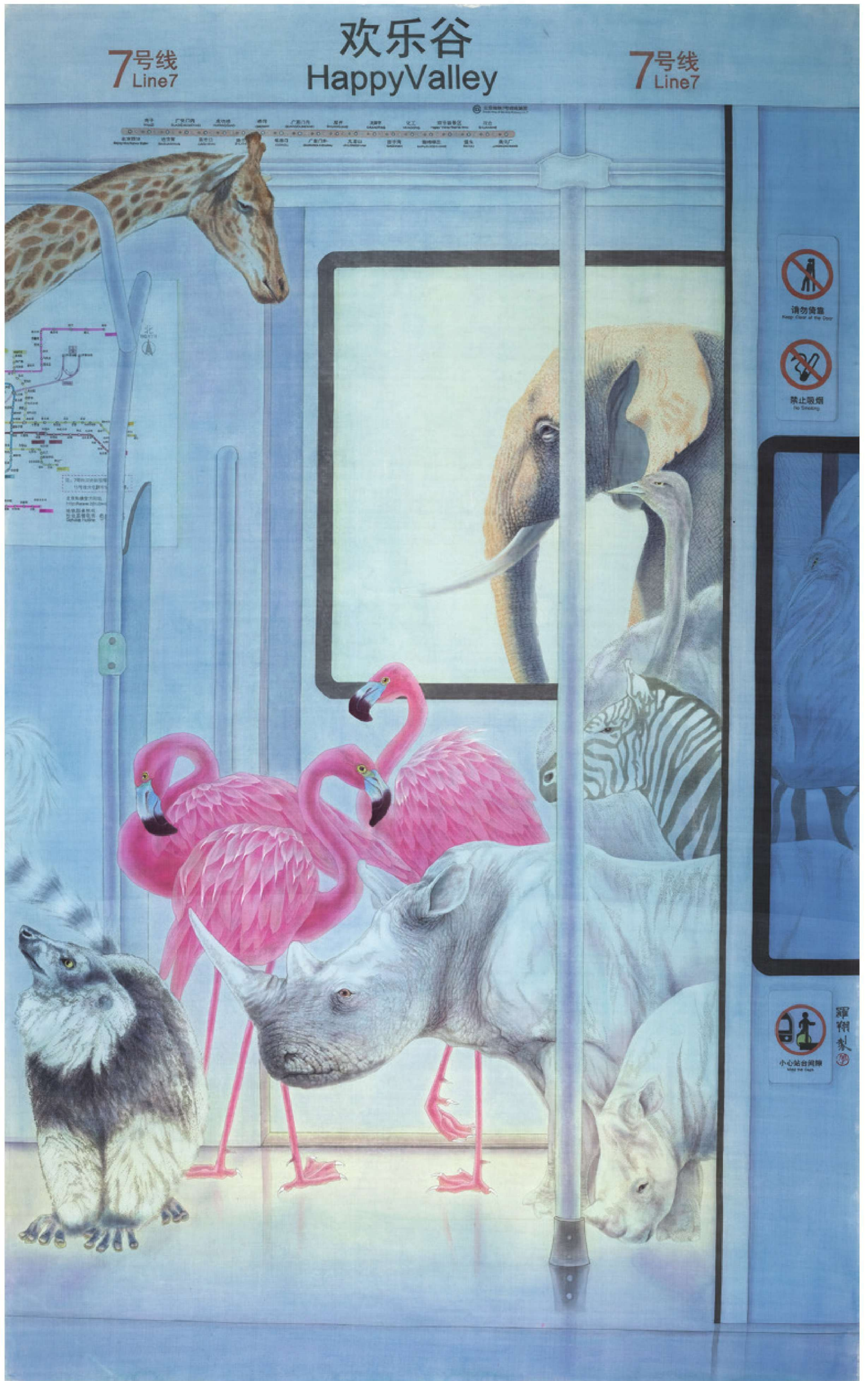
欢乐谷 绢本设色 140cm×220cm 2016年