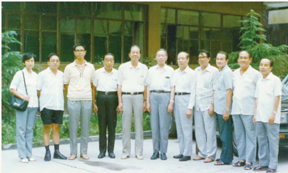
1988年,时任致公党中央主席董寅初(左六)来甬调研,与党员合影