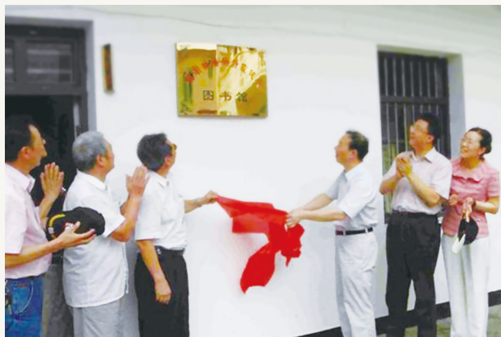
2010年12月,致公党宁波市委会促成美国健华社在苑湖设立健华图书馆