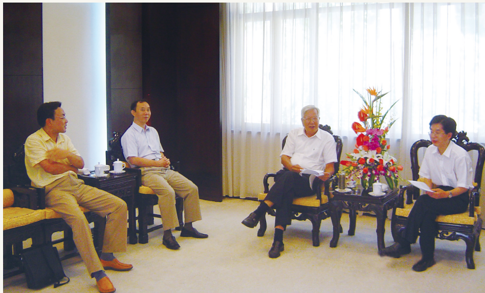
2005年9月，时任全国政协副主席、致公党中央主席罗豪才（左三）接见省委会和市委会领导