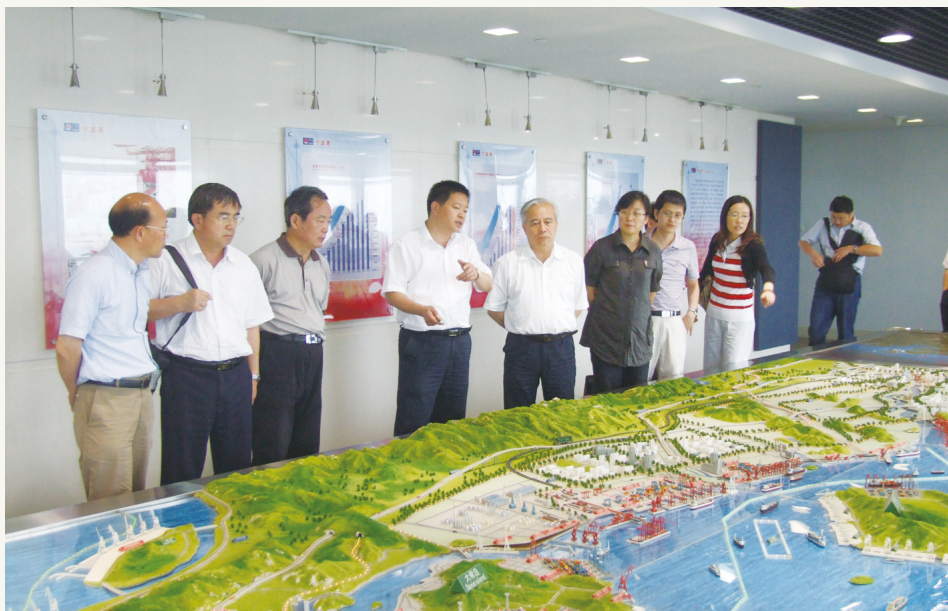
2011年6月,致公党宁波市委会参与致公党中央海洋经济与海岛保护课题调研