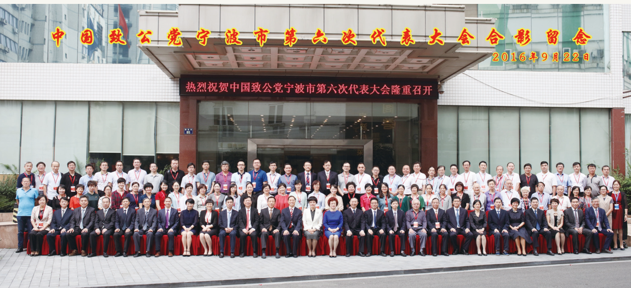
2016年9月,致公党宁波市第六次代表大会合影