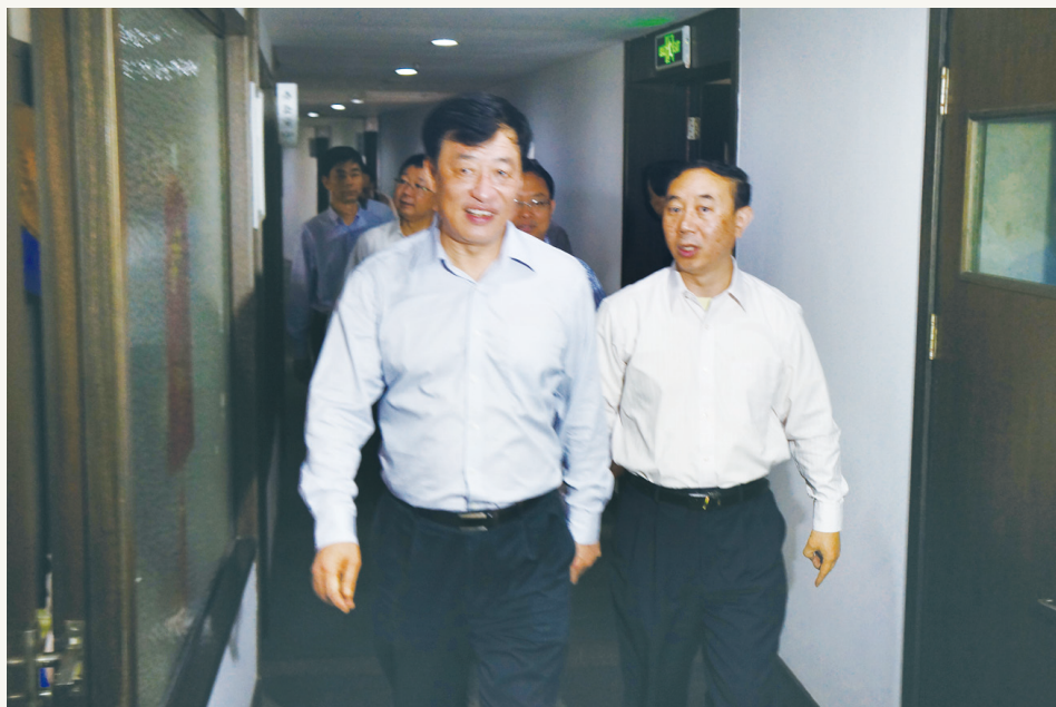
2013年6月,时任中共宁波市委书记刘奇(左)走访市委会机关