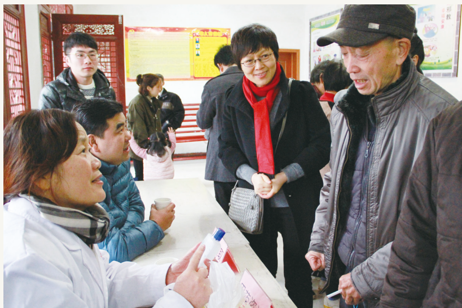
2016年11月,致公党宁波市委会开展“社会服务进奉化黄贤村”活动