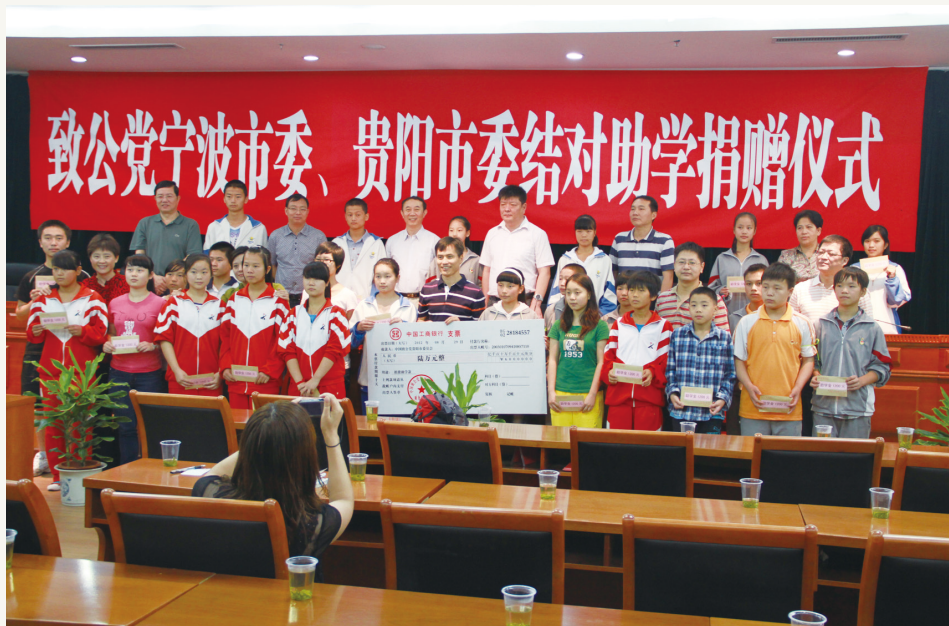
2012年8月,致公党宁波市委会赴贵州与贵阳市委开展结对助学活动