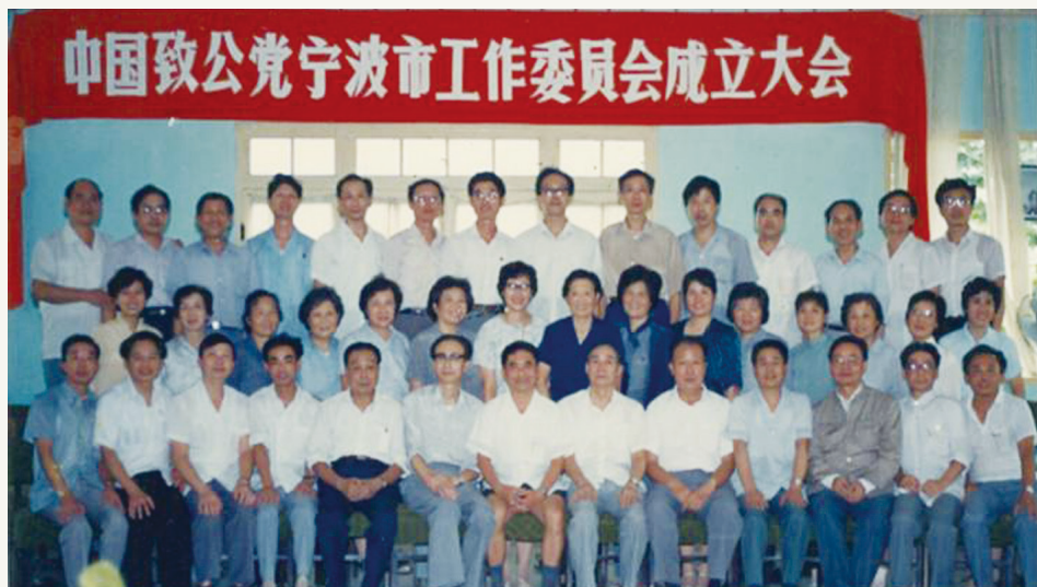
1989年9月,致公党宁波市工作委员会成立大会党员合影