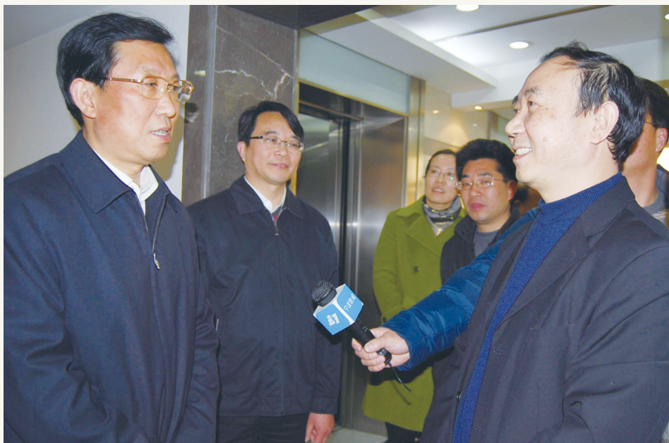
2011年1月,时任中共宁波市委书记王辉忠(左一)走访市委机关