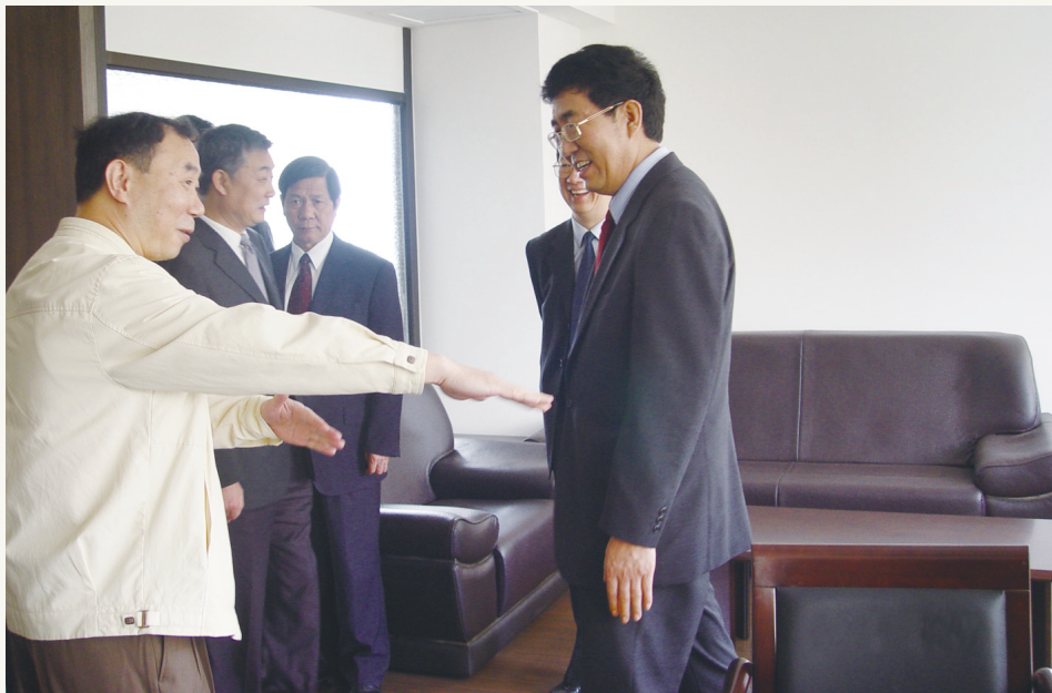
2005年5月,时任中共宁波市委书记巴音朝鲁(右)走访市委机关