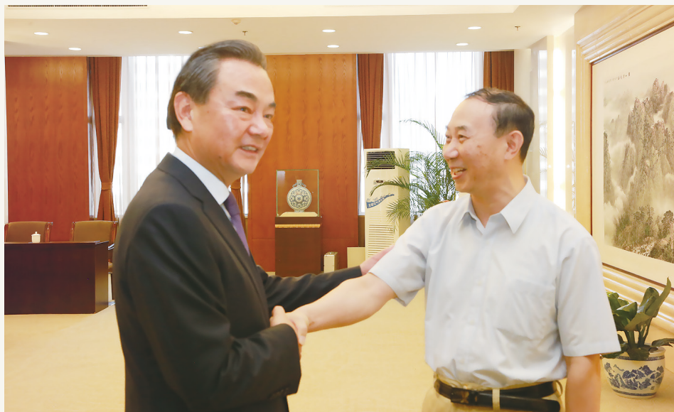
2014年7月，范谊代表致公党宁波市委会赴北京参加提案答复会，受到外交部部长王毅接见