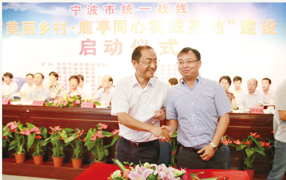
2012年8月,致公党宁波市委会领导参加宁波市统一战线“美丽乡村·鹿亭同心实践基地”建设启动签约仪式