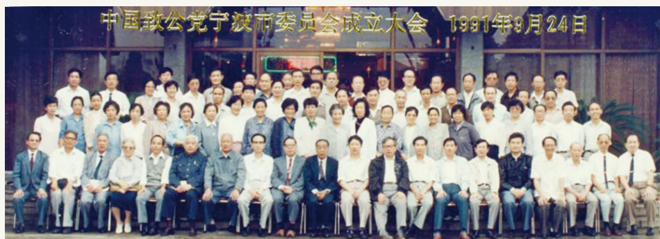
1991年9月,致公党宁波市委员会成立大会党员合影