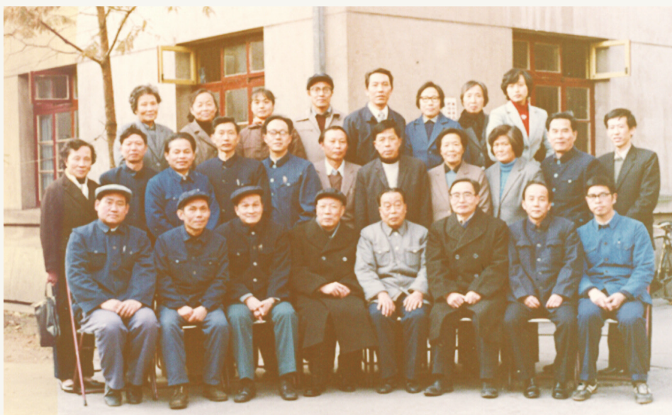
1986年11月,致公党宁波市工作委员会筹备会成立大会党员合影