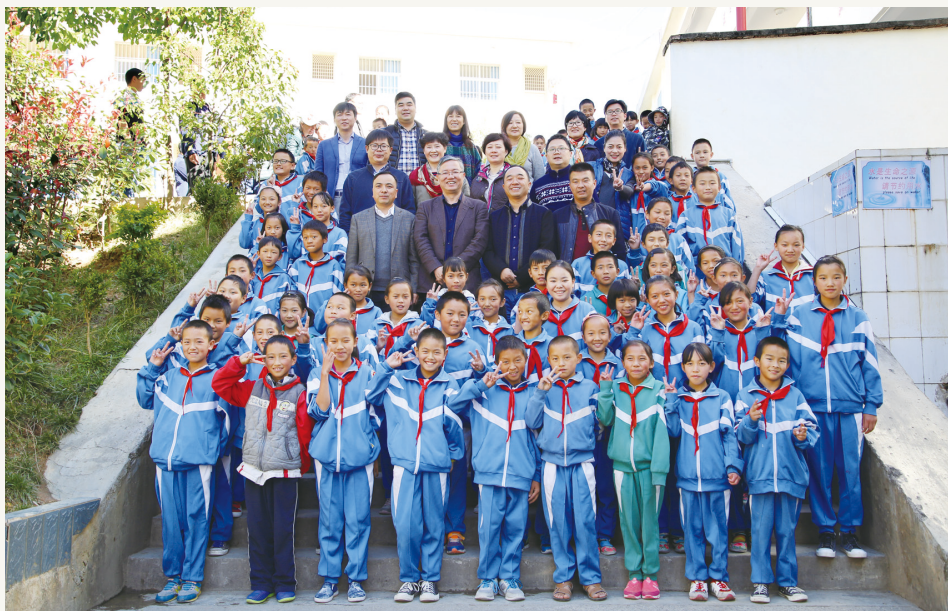
2016年11月,致公党宁波市委会赴云南大理州富恒乡开展精准扶贫活动