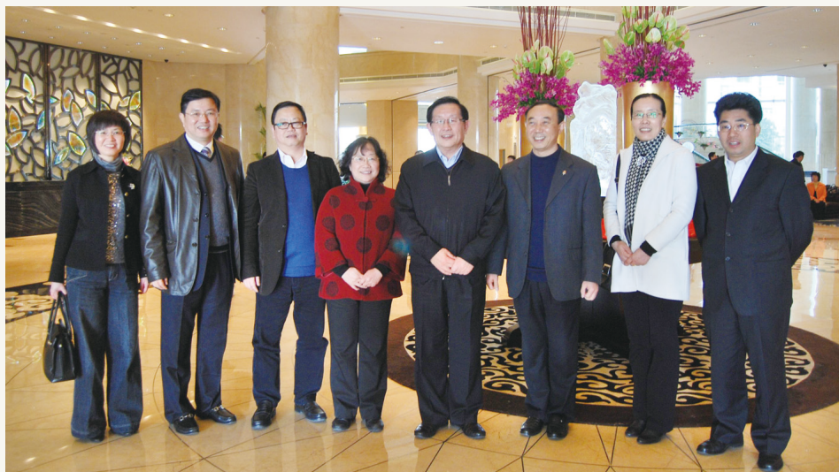
2010年12月，全国政协副主席、科技部部长、致公党中央主席万钢（左五）接见市委会领导