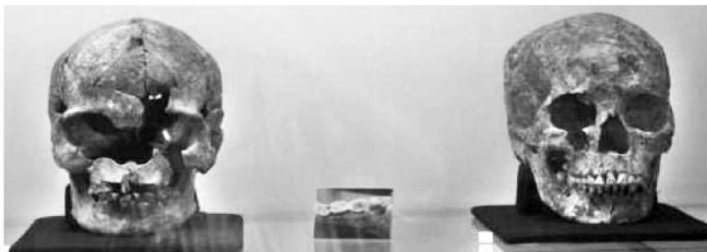
吴哥博物馆藏人头骨

昆仑人的语言被称为昆仑语或昆仑音。《慧琳音义》卷81解释说:“昆仑语,上音昆,下音论。时俗语便,亦曰骨论,南海洲岛中夷人也。甚黑,裸形,能驯伏猛兽犀象等。种类数般,即有僧祇、突弥、骨堂、阁箴等,皆鄙贱人也。”这里所说的“僧祇”“突弥”“骨堂”不知该作何解?但“阁箴”则肯定是“吉箴”(Khemers)同音异译。