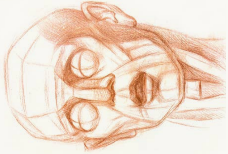
骨骼和肌肉的对照图