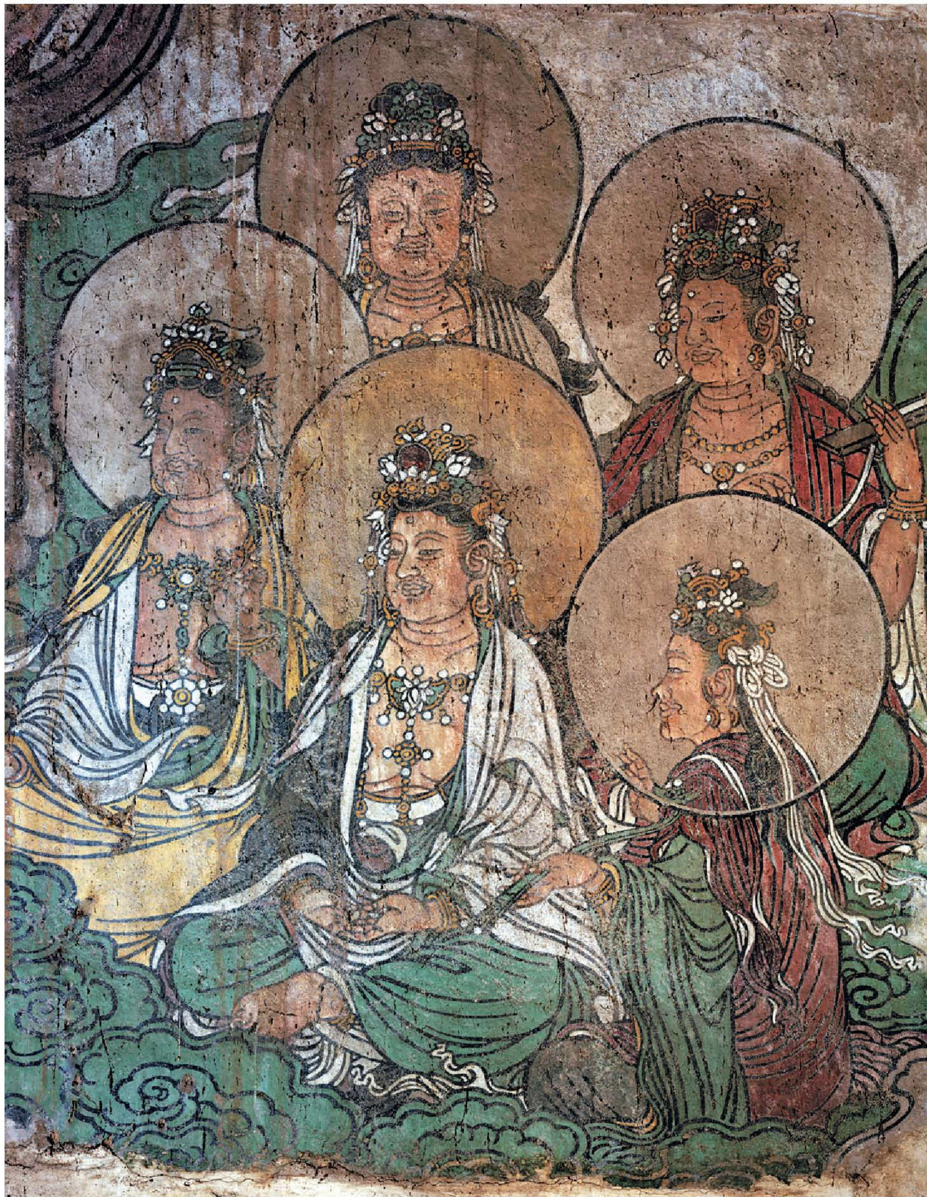
图3 | 诸菩萨众二