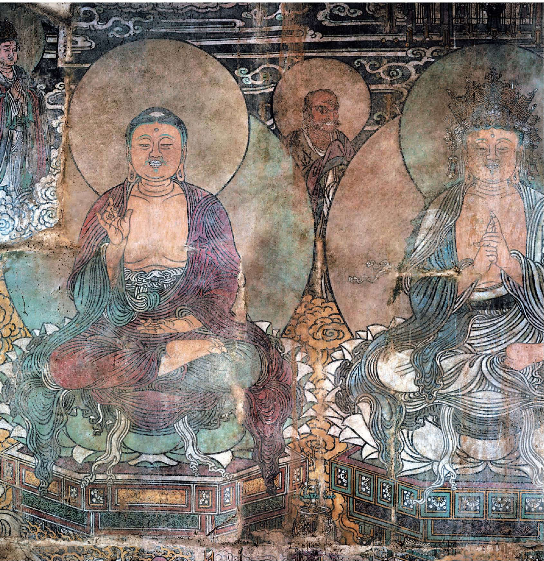
图7 | 佛说法图

大殿东壁为《佛说法图》，中绘释迦像，两侧为阿难、迦叶二弟子及文殊、普贤二菩萨，以及护法金刚护卫，上有人首鸟身的飞天。