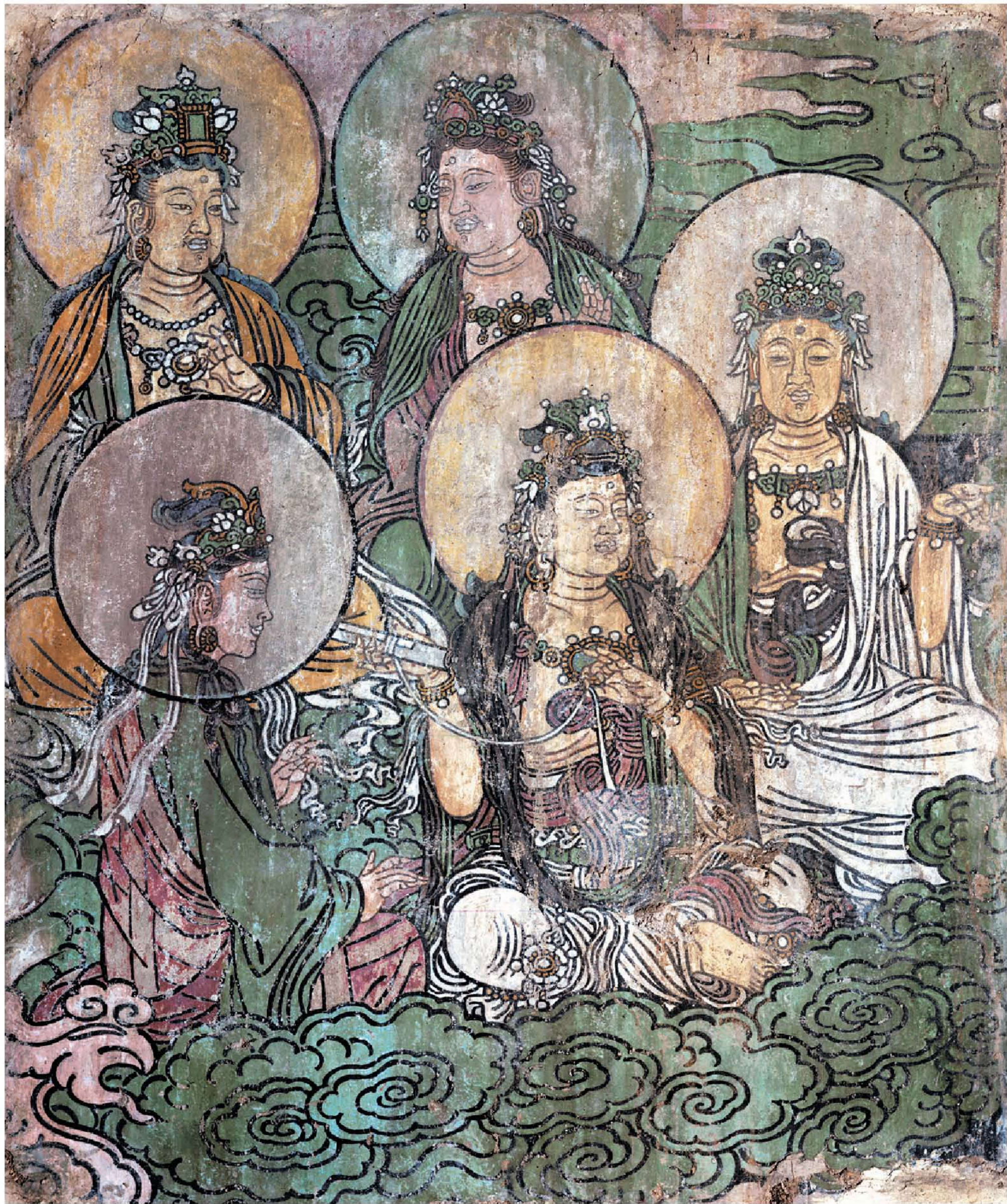
图2 | 诸菩萨众一