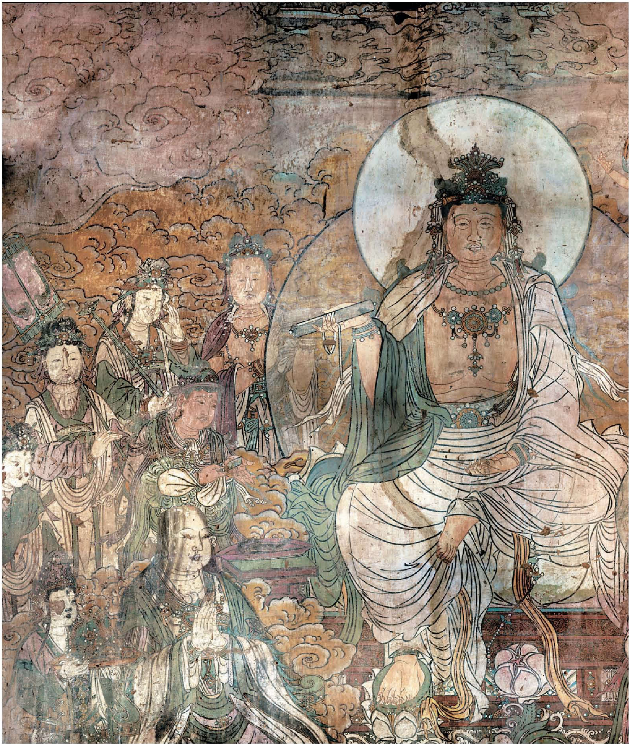
图1 | 弥勒变

西壁是《弥勒变》，中间绘弥勒像，左右为二大菩萨和众弟子，下方西侧为国王和王妃剃度图，有官人围侍。