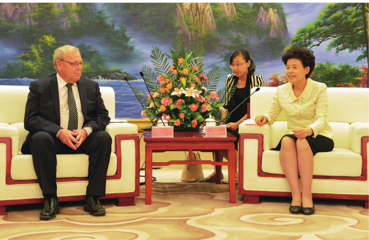
2016年7月3日，自治区主席咸辉会见新西兰马尔堡大区区长阿利斯蒂尔·索曼