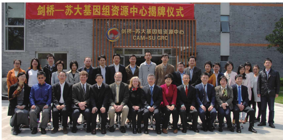
剑桥—苏大基因组资源中心揭牌仪式