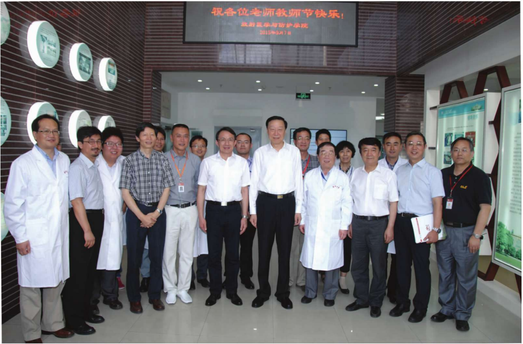
江苏省委书记罗志军到学校调研