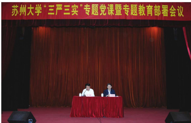
学校召开“三严三实”专题党课暨专题教育部署会议