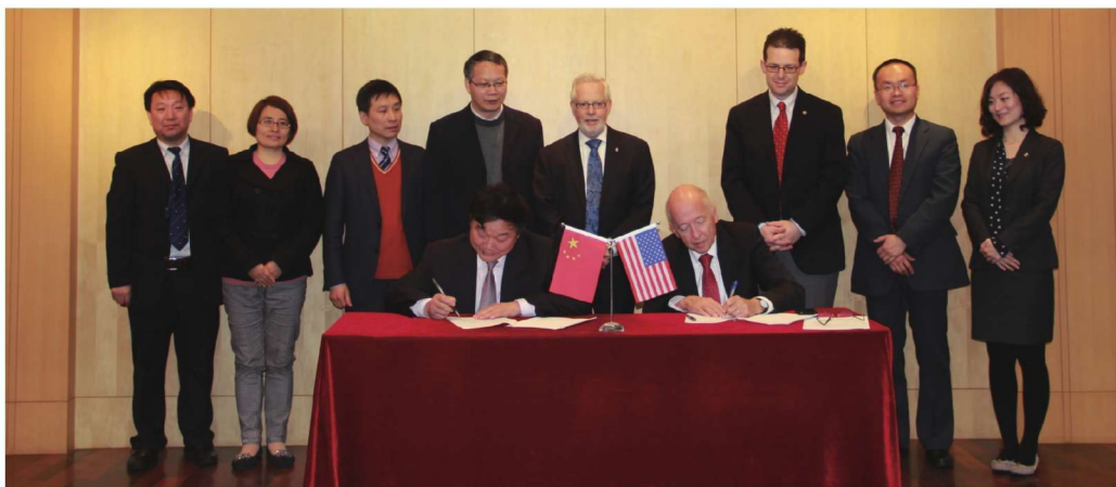
学校与美国俄亥俄州立大学签订联合培养博士研究生协议