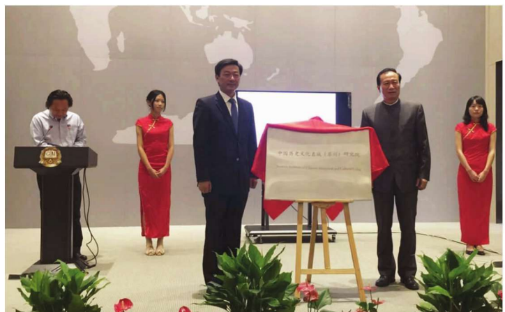
中国历史文化名城(苏州)研究院揭牌