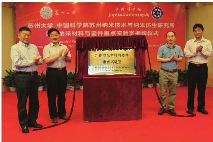
功能纳米材料与器件重点实验室揭牌