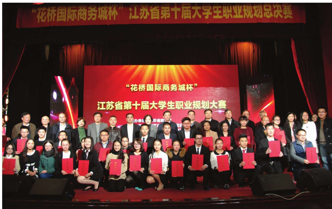
“花桥国际商务城杯”江苏省第十届大学生职业规划总决赛在学校举行