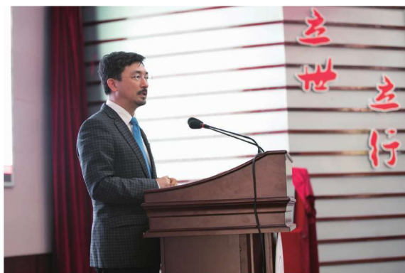
苏州大学第十二届研究生 学术科技文化节暨苏州大学研 究生东吴论坛(2015)举办