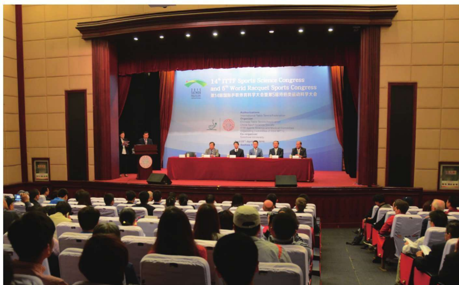
第14届国际乒联科学大会暨第5届持拍类运动科学大会开幕式