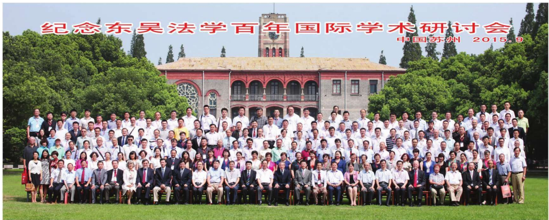
纪念东吴法学百年国际学术研讨会