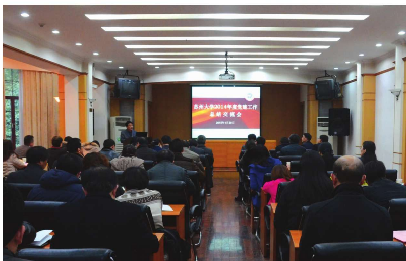
2014年度党建工作总结交流会举行