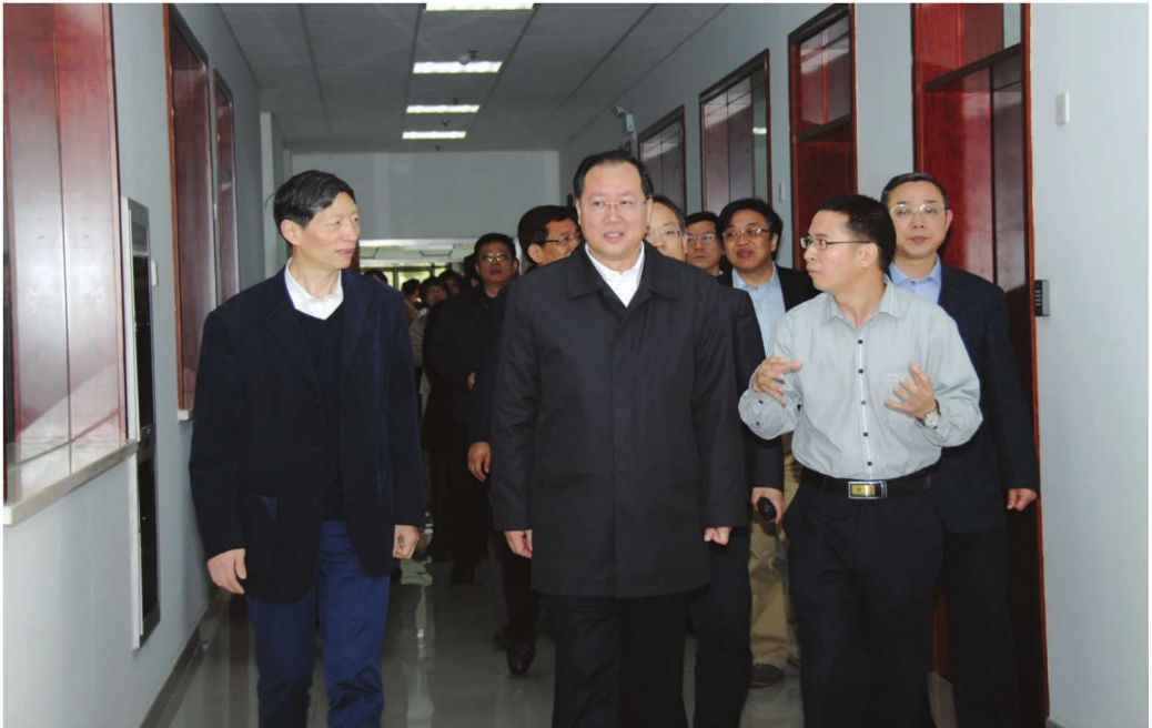
国家工业和信息化部副部长毛伟明一行到学校调研