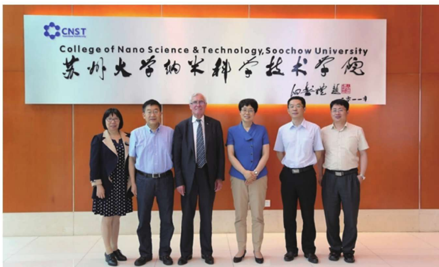
苏州大学—滑铁卢大学—苏州工业园区联合办学和科研协作第四届理事会召开