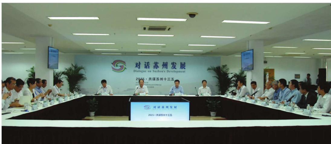
“对话苏州发展 2015·共谋苏州十三五”活动在学校举行