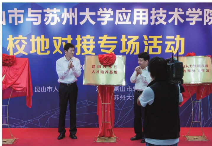
昆山市人民政府—苏州大学应用技术学院开展多项合作举行揭牌仪式