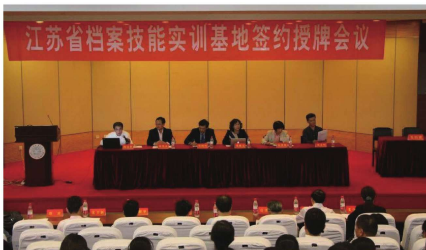
江苏省档案技能实训基地签约授牌仪式