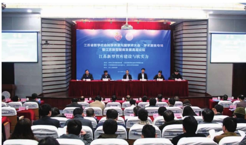
江苏省哲学社会科学界第九届学术大会学术聚焦专场暨江苏新型智库发展高层论坛在学校举行