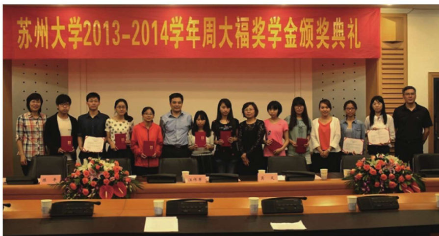
学校举行 2013—2014 学 年周大福奖学 金颁奖仪式