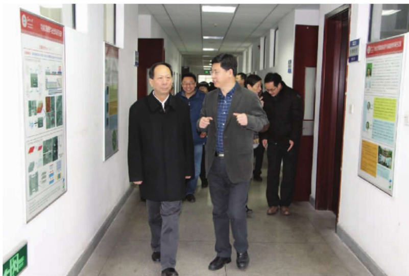
江苏省委副书记、苏州市委书记石泰峰一行到学校调研