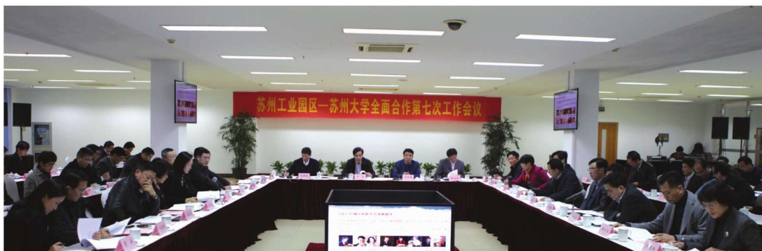
苏州工业园区—苏州大学全面合作第七次工作会议举行