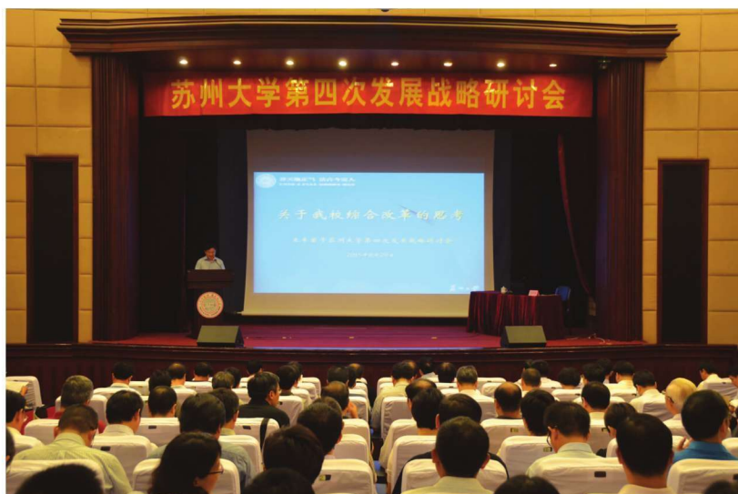
苏州大学第四次发展战略研讨会举行