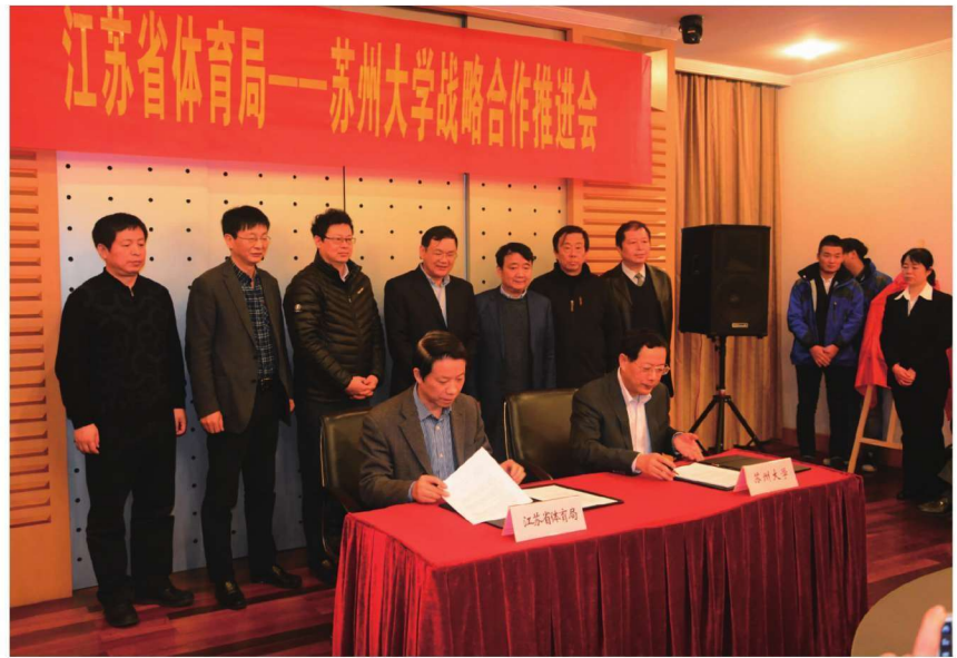
江苏省体育局—苏州大学战略合作推进会举行