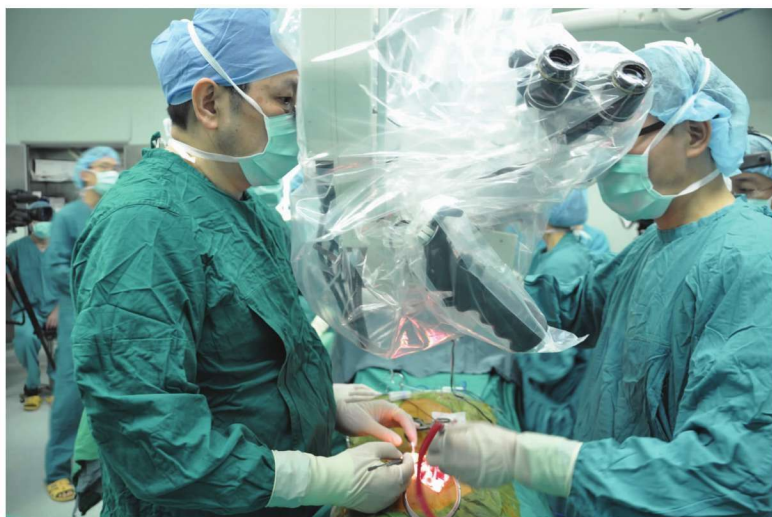
全球第三例、华东首例神经再生胶原支架复合间充质干细胞治疗脊髓损伤病例在苏大附一院完成