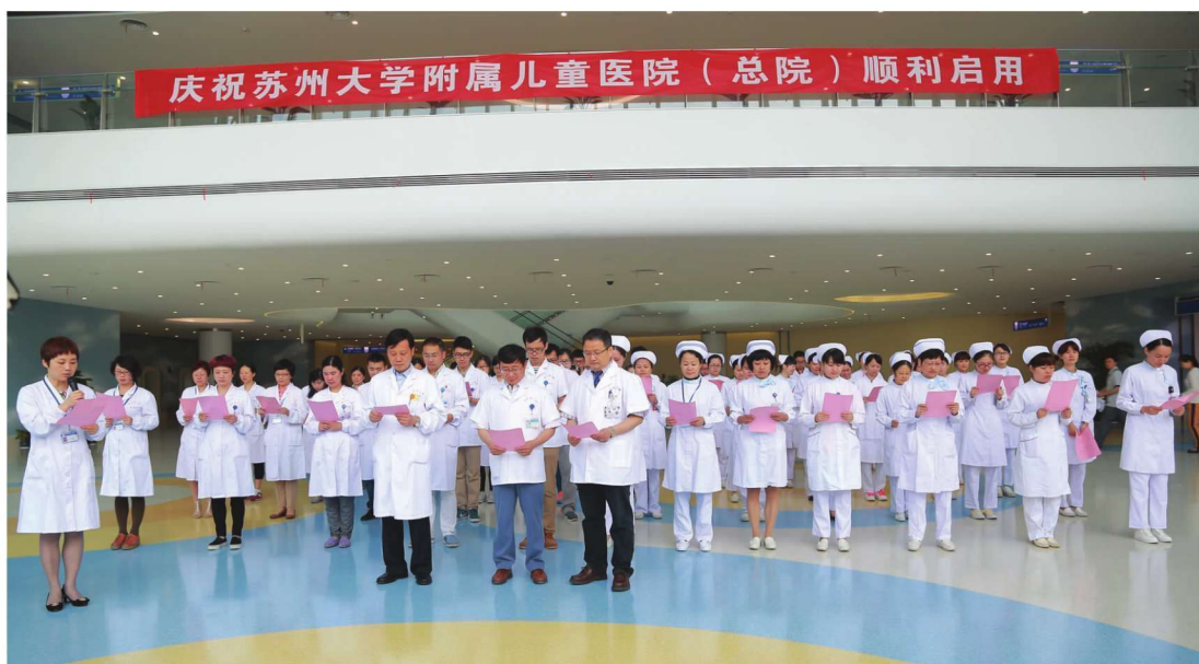
苏州大学附属儿童医院(总院)举行正式启用仪式