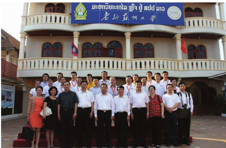
江苏省副省长张雷调研老挝苏州大学