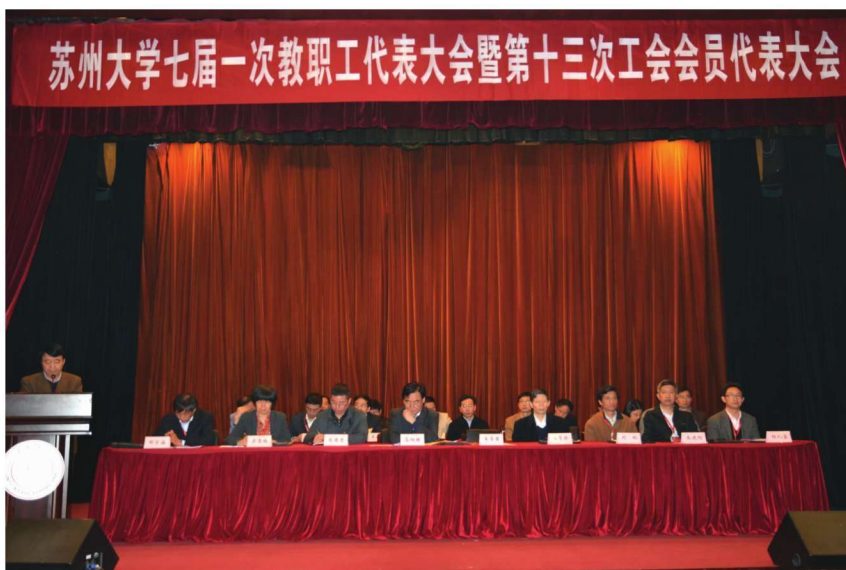
学校召开七届一次教职工代表大会暨第十三次工会会员代表大会