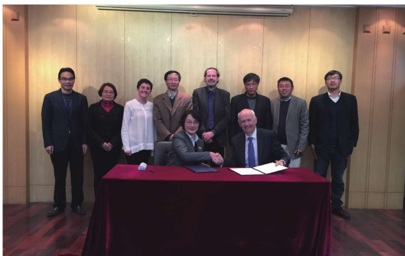
学校与爱尔兰皇家外科医学院签署合作协议