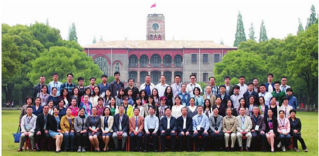
江苏省病理生理学会第二次代表大会暨学术研讨会在学校举办