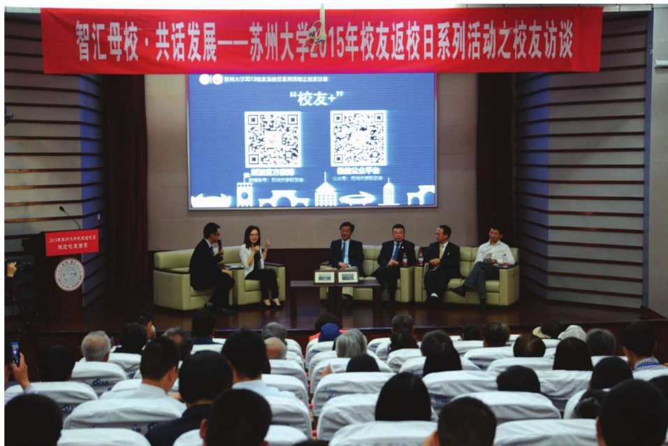
“校友返校日”系列活动之校友访谈