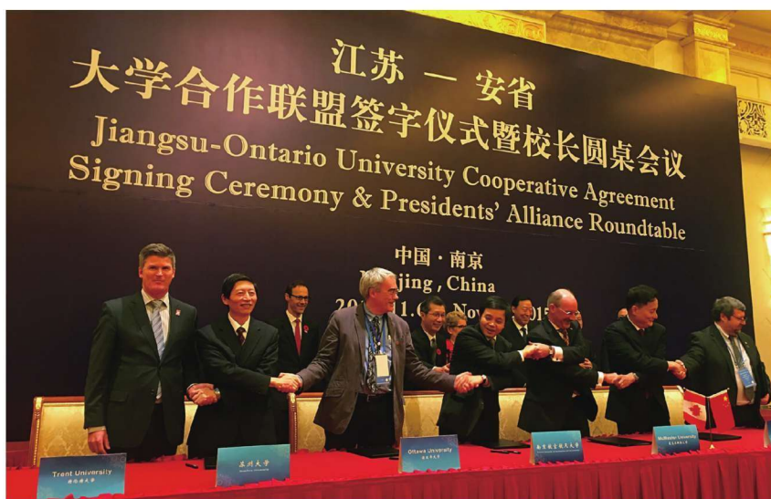
江苏—安省大学合作联盟签字仪式暨校长圆桌会议