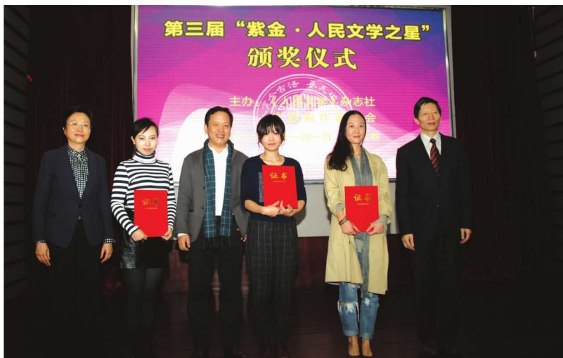
第三届“紫金·人民文学之星”颁奖仪式在学校举行