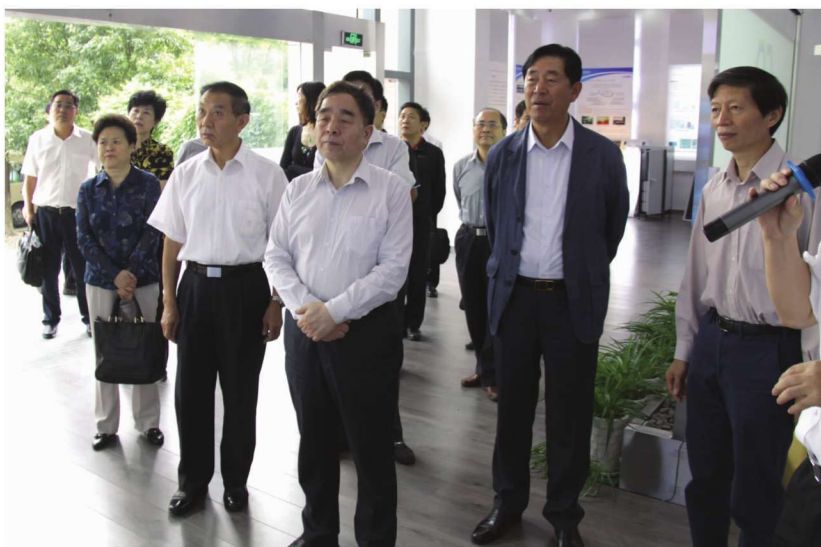
全国人大教科文卫委员会调研组一行到学校调研