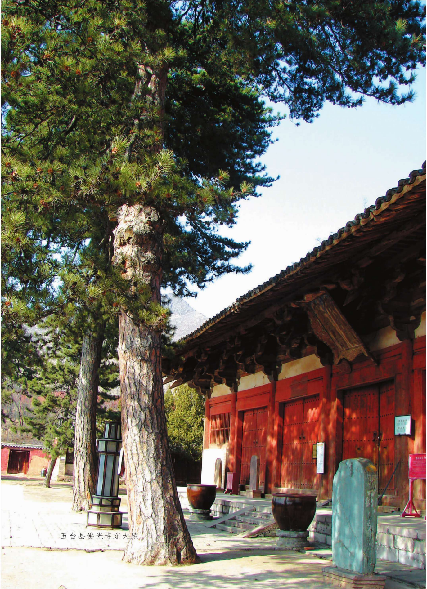
五台县佛光寺东大殿