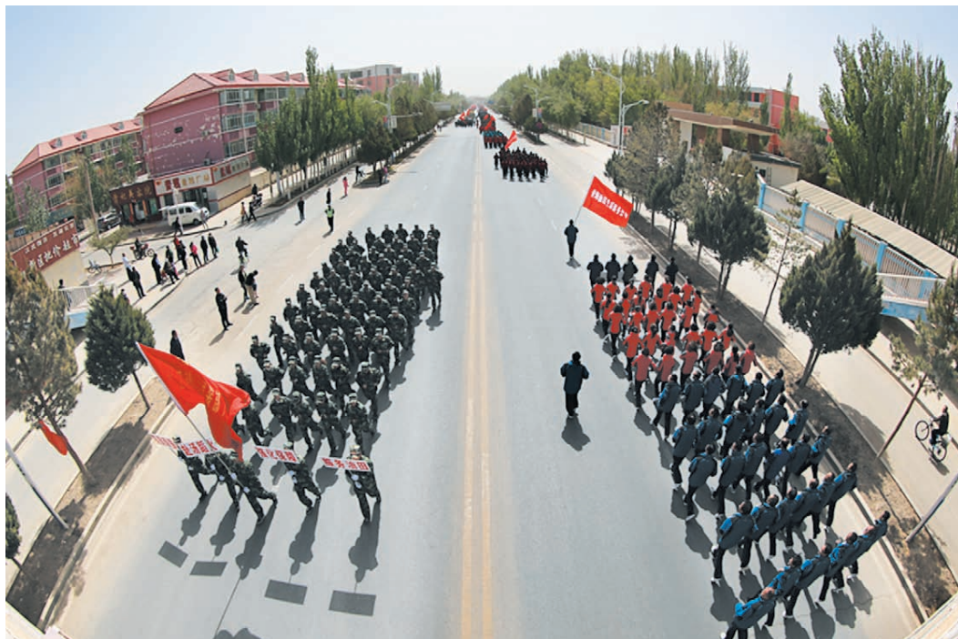
2014年4月25日，青海油田举行庆“五一”长跑活动。