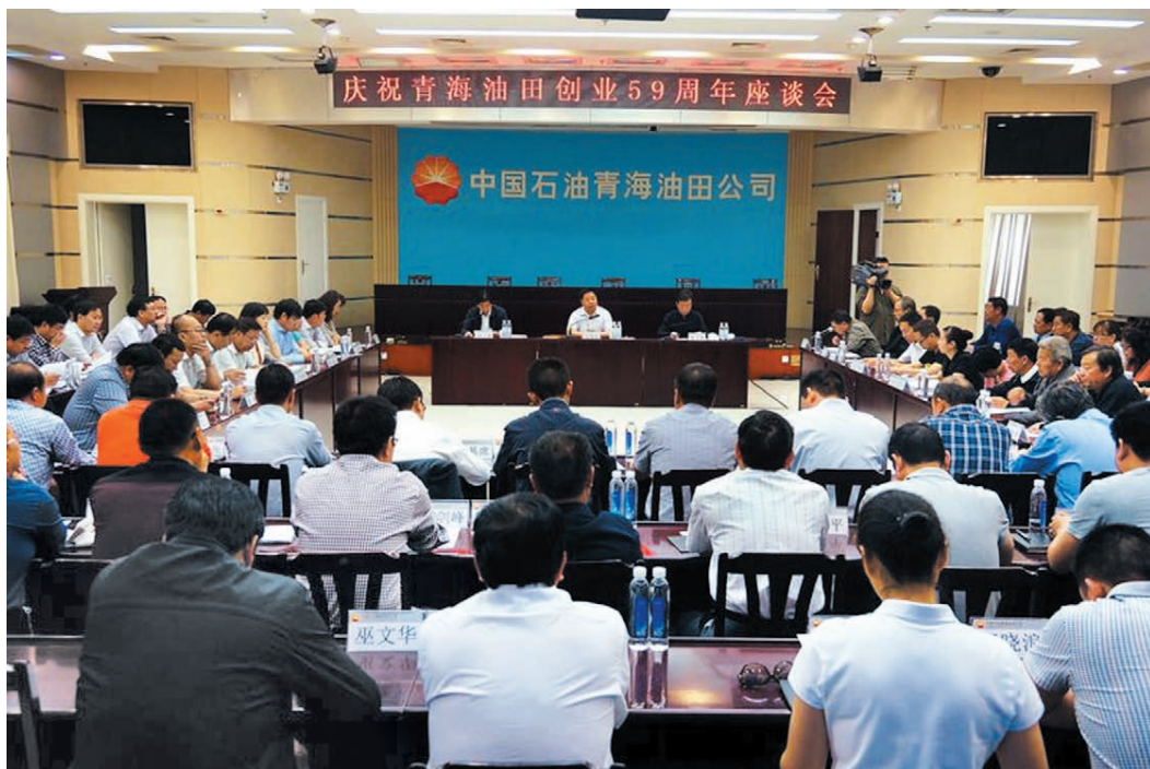
2014年5月28日，青海油田公司举行创业59周年座谈会。