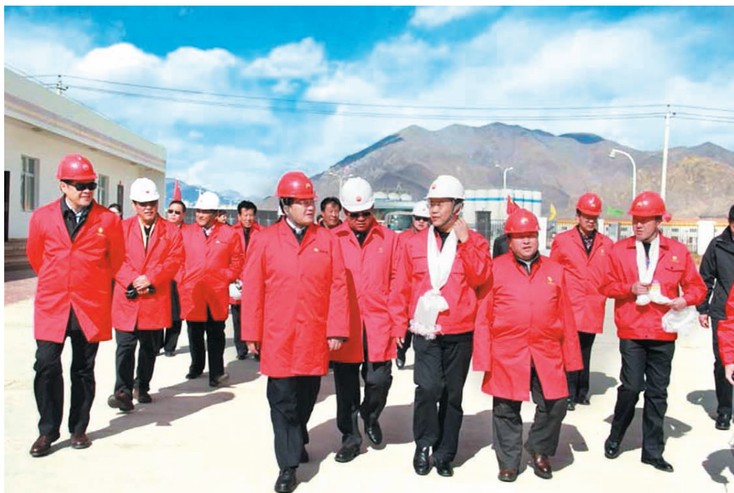
2014年2月5日，西藏自治区党委副书记、自治区常务副主席、区政法委书记、区维稳指挥部总指挥邓小刚看望节日期间坚守岗位的液化天然气公司员工。