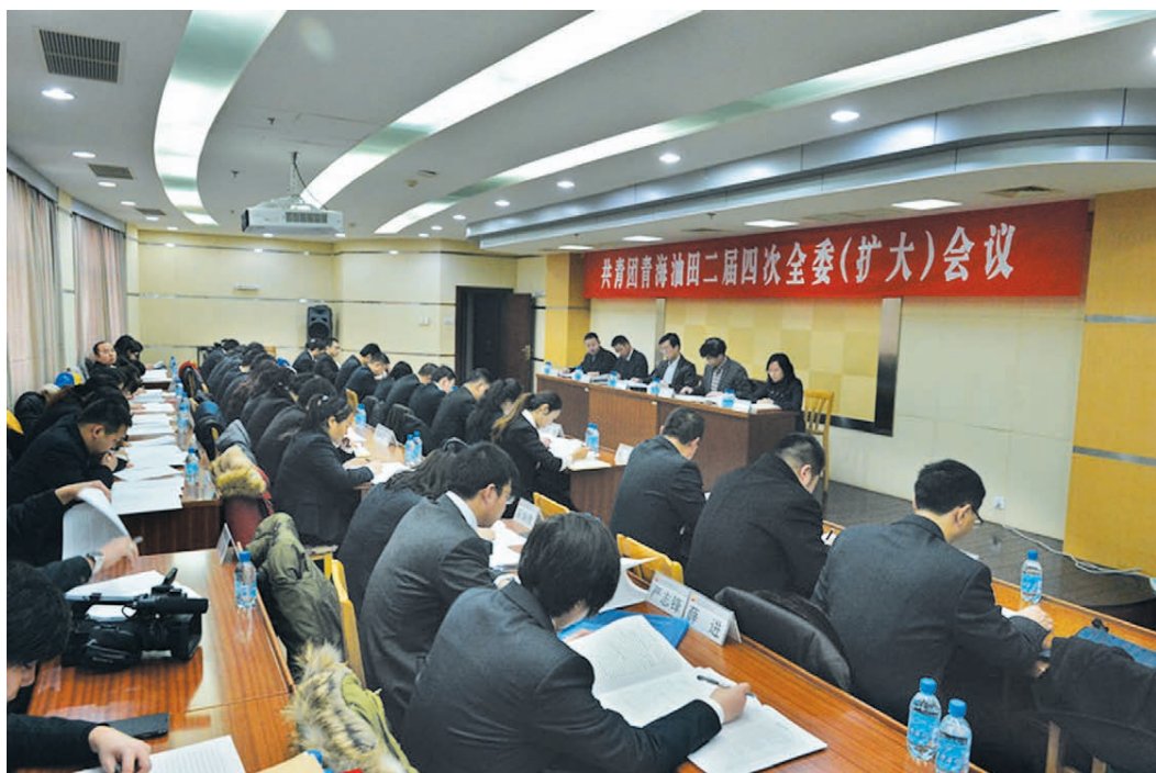
2014年1月21日，共青团青海油田二届四次全委(扩大)会议在敦煌基地召开。