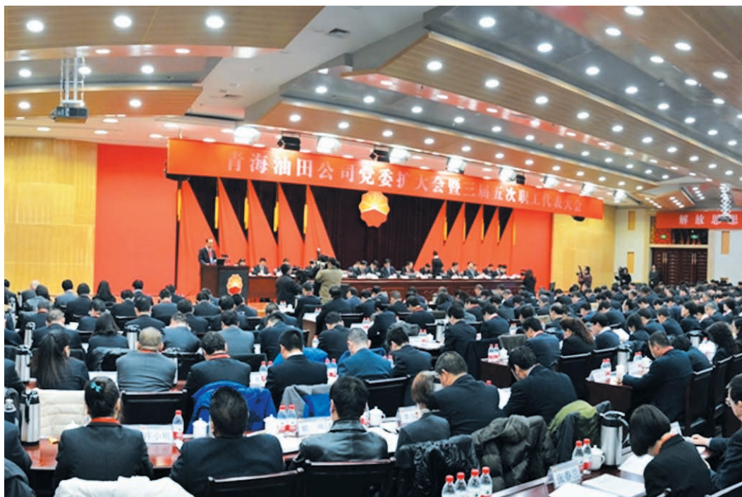
2014年1月6—7日，青海油田公司党委扩大会议暨三届五次职工代表大会在敦煌基地召开。