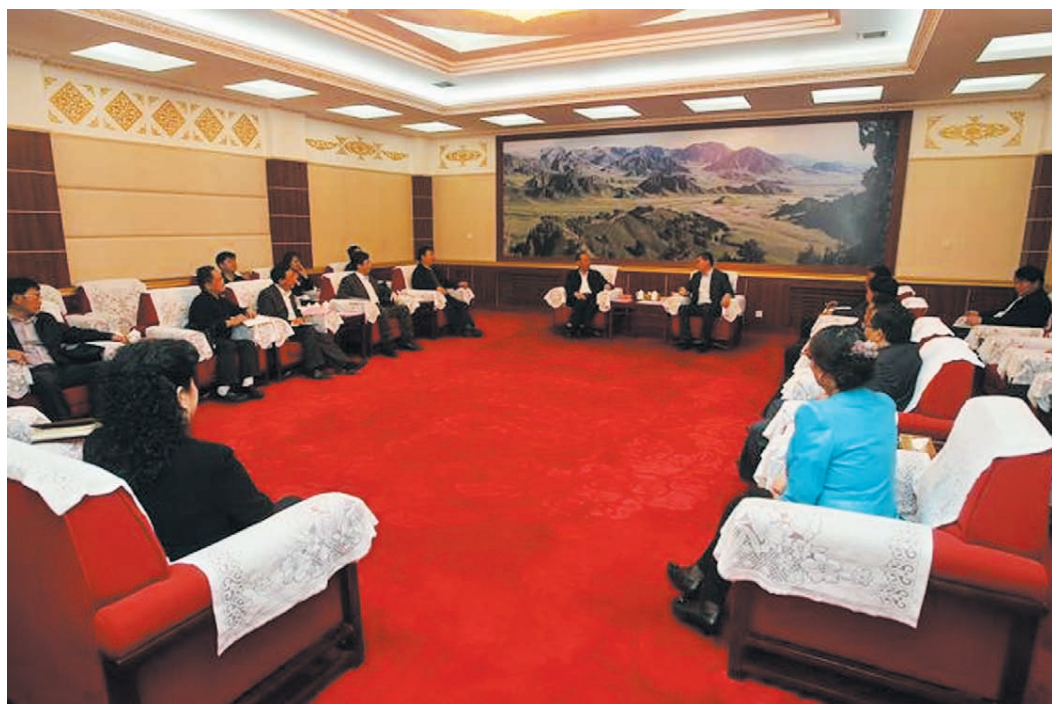
2014年5月20日，青海省副省长、海西州委书记辛国斌与青海油田公司领导座谈。