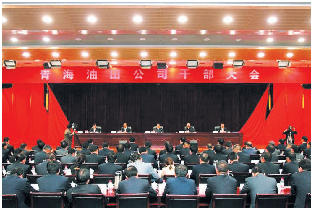
2014年5月17日，青海油田公司召开干部大会，宣布油田公司主要领导调整。