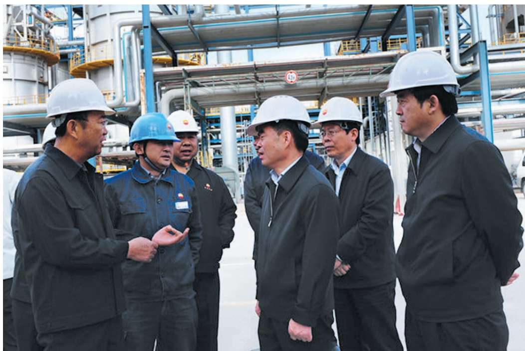
2014年5月7日，青海省委常委、副省长骆玉林到格尔木炼油厂检查指导工作。