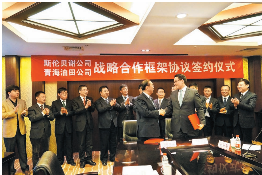
2014年3月13日，青海油田公司与斯伦贝谢公司在北京签订战略合作框架协议。