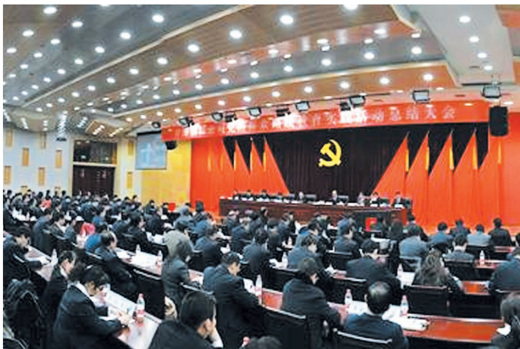
2014年2月11日，青海油田公司召开党的群众路线教育实践活动总结视频大会。