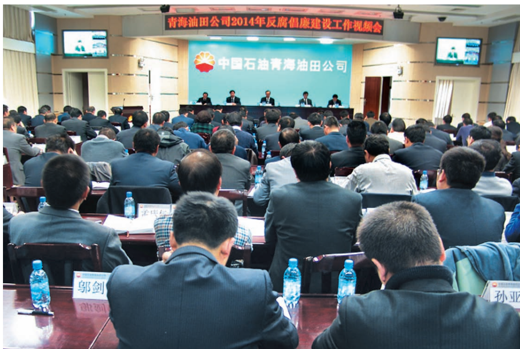
2014年2月28日，青海油田公司召开2014年反腐倡廉建设工作视频会。