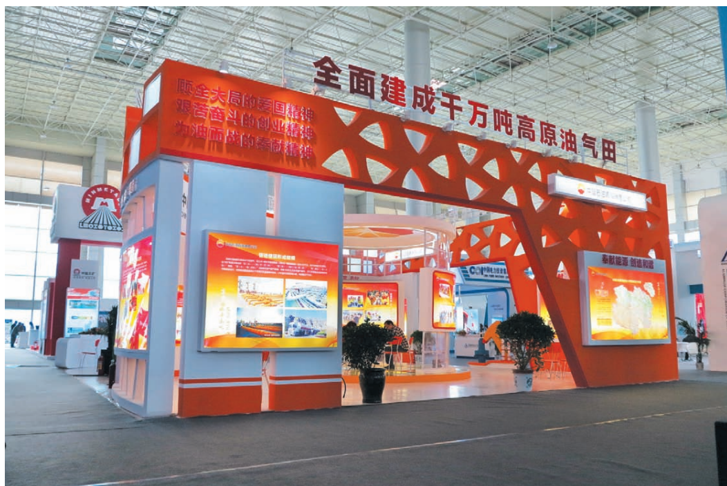
2014年6月10日，青海绿色发展投资贸易洽谈会在青海省西宁市开幕。