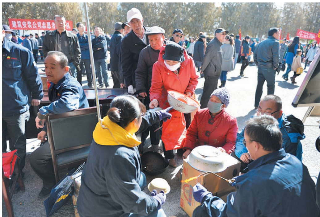
2014年3月2日，青海油田在敦煌、花土沟、格尔木3个石油基地同时开展“学雷锋、讲文明、树新风”活动。