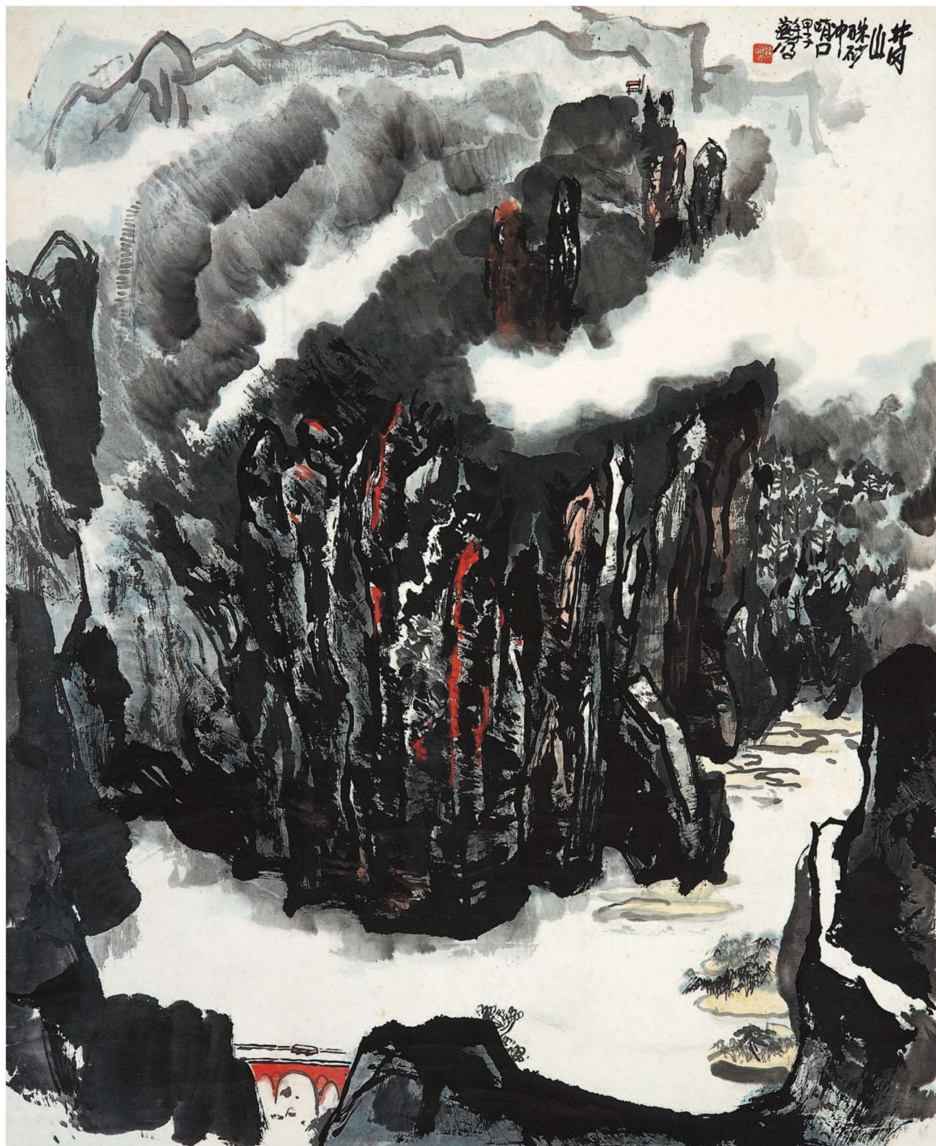
朱砂冲 120cm × 96cm