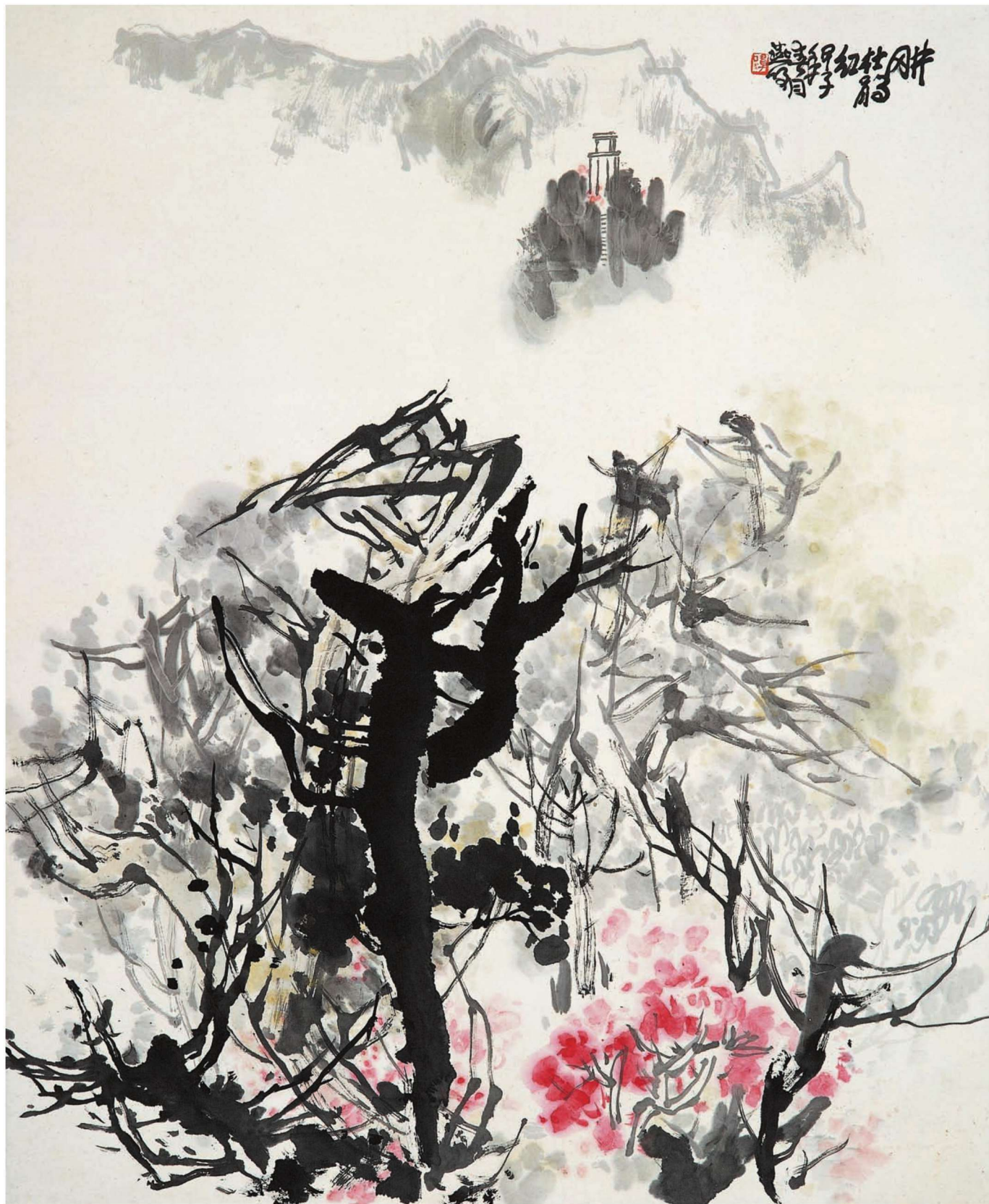
井冈山杜鹃红 120cm × 96cm