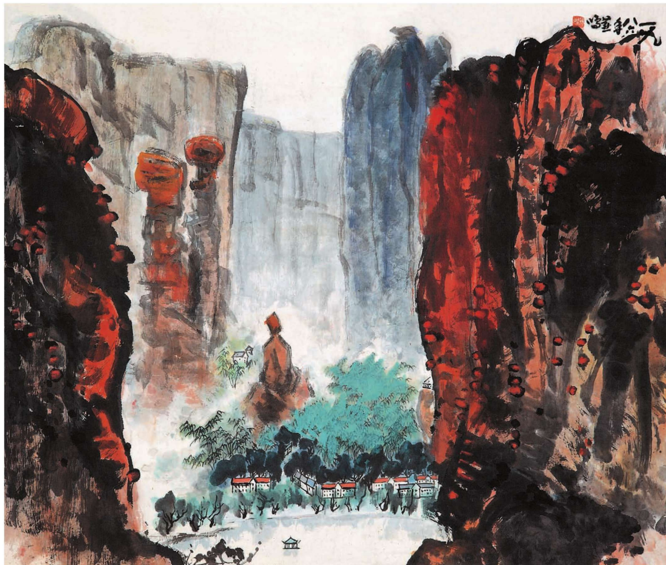
圭峰 96cm × 120cm