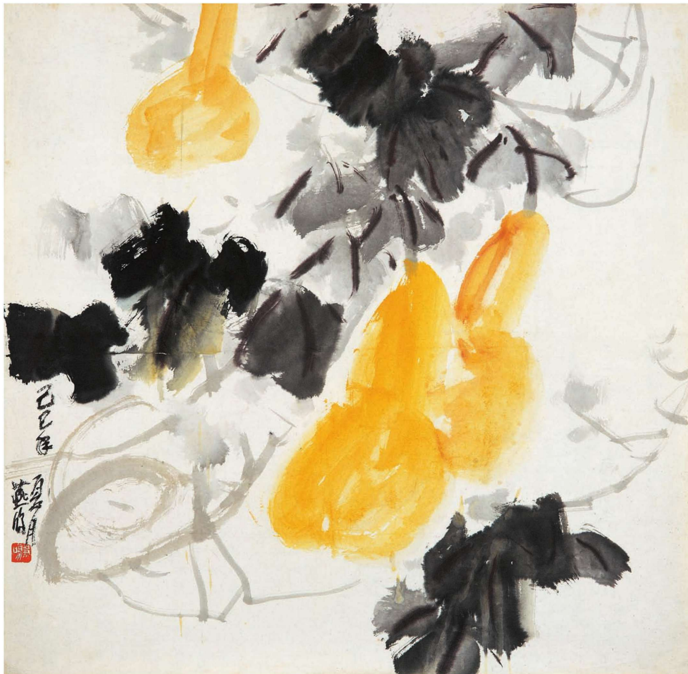
葫芦 68cm x 68cm