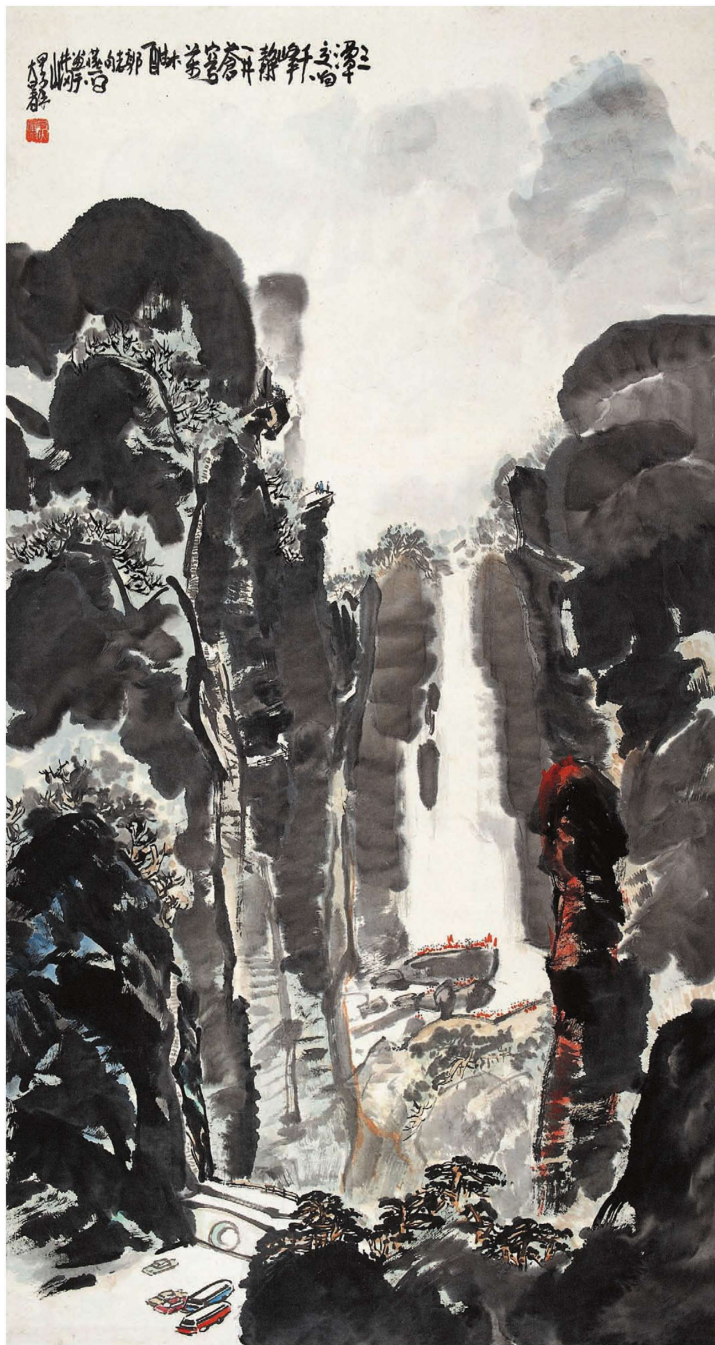
井冈龙潭 180cm x 95cm