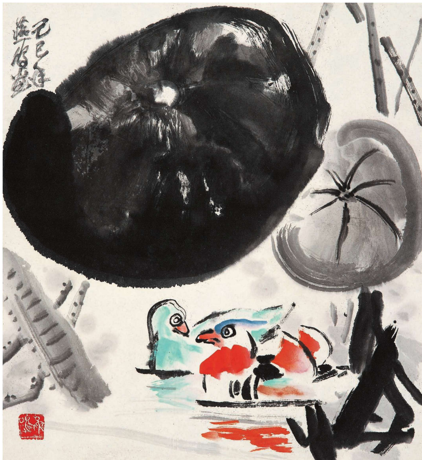
鸳鸯 49cm × 45cm