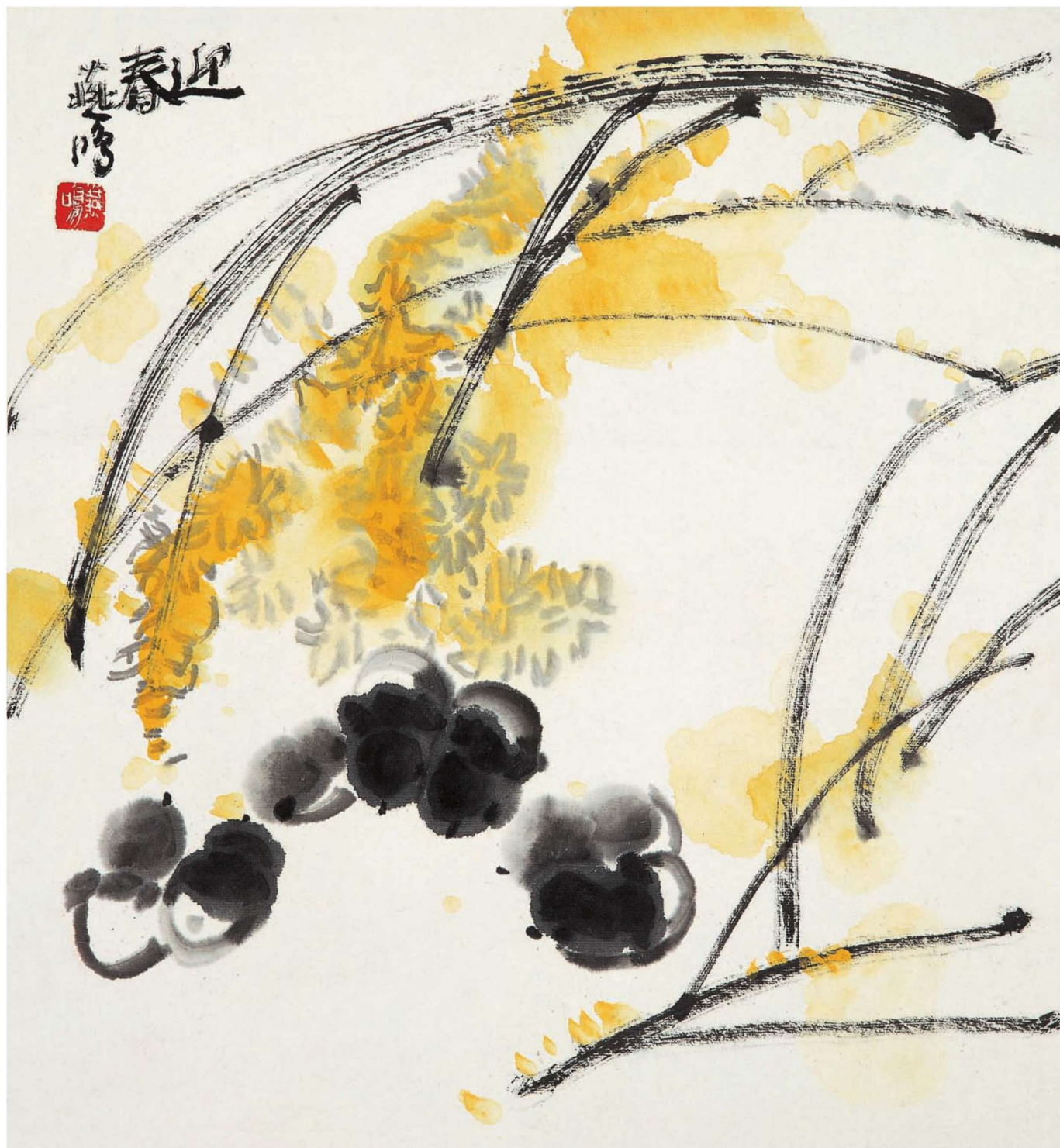
迎春 48cm × 45cm