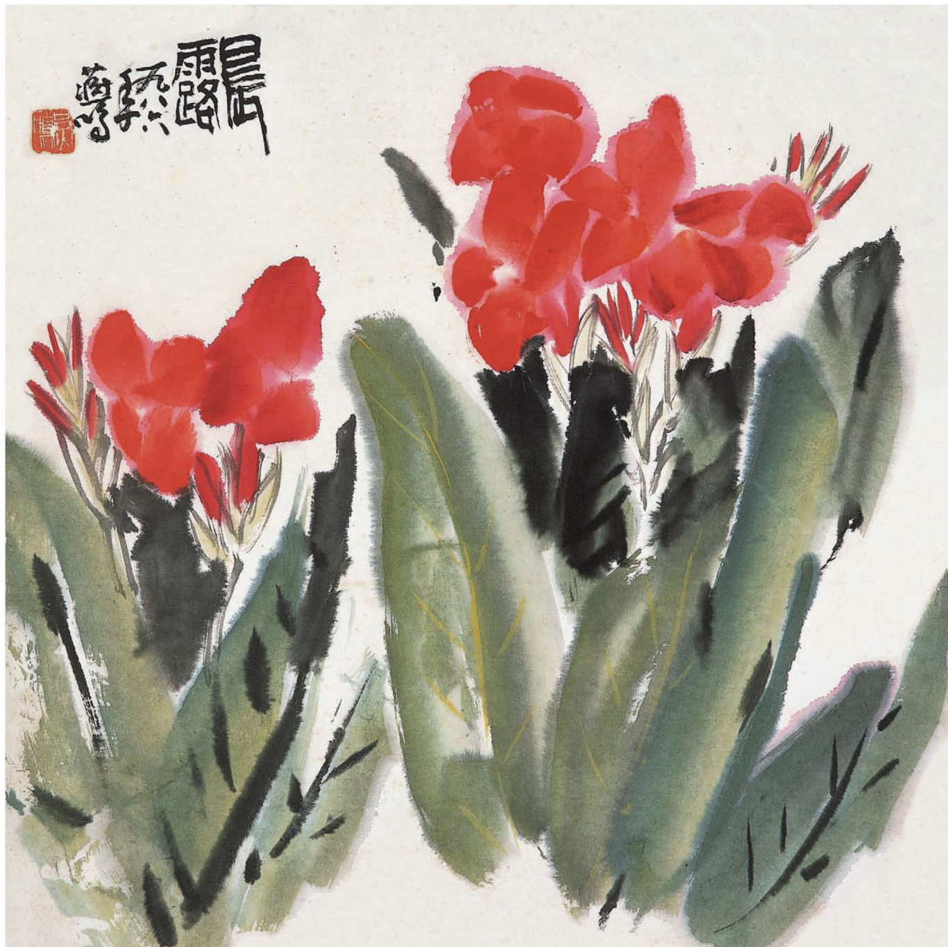
晨露 68cm × 68cm