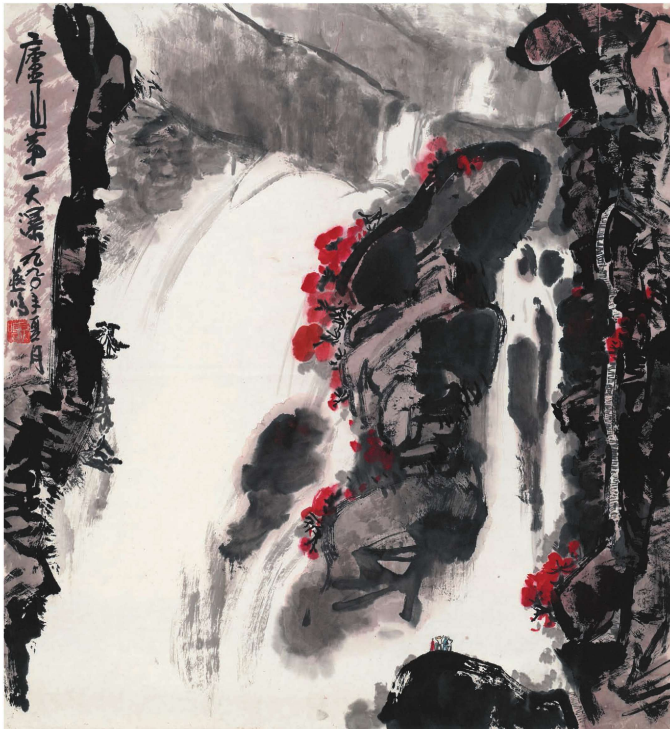
庐山第一瀑 97cm × 89cm 八大山人纪念馆收藏