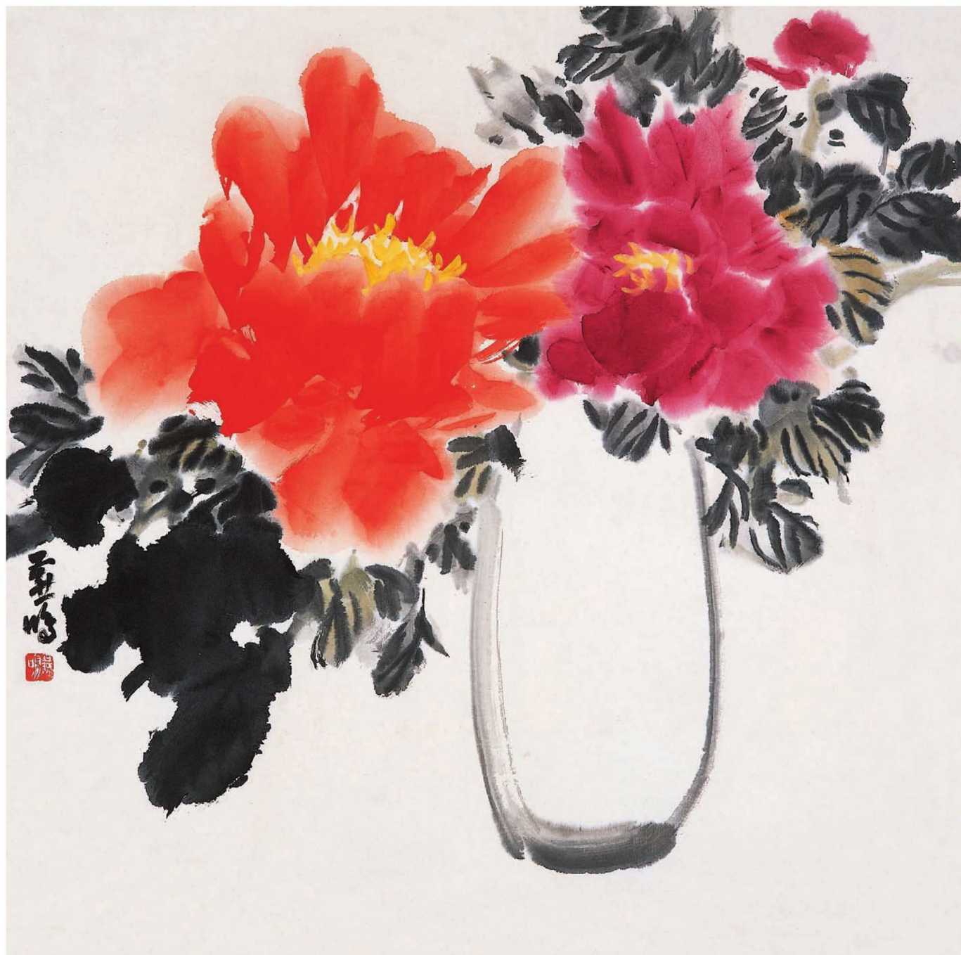
牡丹 68cm × 68cm