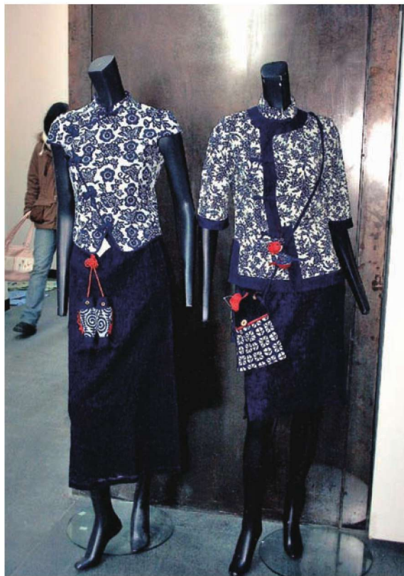
图1-2 《魅力蓝花》（蓝印花布服装）