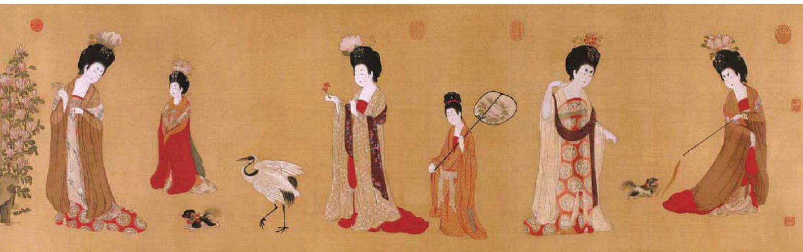
图1-8 《簪花仕女图》（唐代画家周昉）