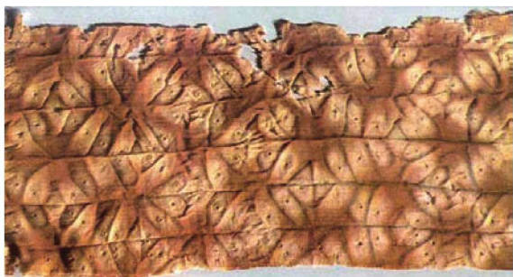
图1-6 新疆出土的唐代棕色绞缬菱花绢

时的扎染工艺丰富多彩，当时著名的纹样有鱼子缬、撮晕缬、玛瑙缬、鹿胎缬、蚕儿缬、醉眼缬等等。看着这些花型，仿佛盛唐大帝欣赏婀娜多姿的歌姬翩翩起舞欢乐场景就在眼前。唐代是扎染兴盛期，中唐以后普遍流行于社会各阶层，宫廷贵族、侍女的华丽绞缬服饰，民间寻常百姓质朴的绞缬服装无不看到扎染工艺的影子；佛教寺院中的彩幡、帐幔以及供养人的服饰等都相继采用四瓣花、花鸟纹、玛瑙缬（做工繁复）、鱼子缬、青碧缬、大圆圈纹、菱格纹等纹样。