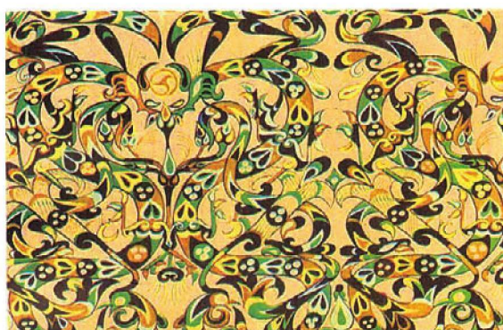
图1-5 战国图案(《中国染织史》 吴淑生著)

在陆续出土的许多遗物中，也可看出战国时期的丝织品色彩的丰富程度。虽然经过长久的岁月，在破碎的纤维间，还是可以发现深棕、浅棕、棕红、绛红、朱红、橘红、浅黄、金黄、土黄、槐黄、湘绿、钴蓝等的色相（图1-5）。