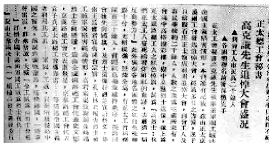
1926年1月25日，中华全国总工会机关报《工人周刊》刊载高克谦追悼大会盛况

高克谦烈士牺牲不久，1925年11月，冯玉祥部队赶走了占领石家庄的奉系军阀，正太铁路总工会也随着形势的变化，恢复公开活动。为了告慰烈士英灵，缅怀烈士业绩，由正太、京汉两铁路工会联合发起，于1926年1月17日下午在石家庄车站广场