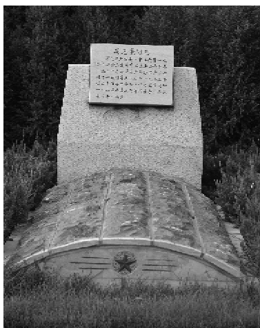
高克谦在华北军区烈士陵园之墓

为了让子孙后代永远记住这位年轻的烈士，大会决定为高克谦建立一座纪念碑。经过积极筹划，1931 年在高克谦的家乡，无极县南池阳地下党组织和群众经过积极筹划，在高克谦墓地修建了一座纪念碑。中华人民共和国成立后，石家庄人民依然深深地怀念着他。1958 年，党和政府将高克谦烈士的遗骨迁葬于华北军区烈士陵园。1985 年 10 月 8 日，中共石家庄市委、市政府组织群众在石家庄火车站北侧的大石桥旁的广场上隆重集会，为建高克谦烈士的铜像和纪念碑举行落成大会。1986 年 11 月 12 日，中共石家庄市委、市政府在大石桥西端北侧，举行了高克谦烈士纪念碑和铜像揭幕典礼，由第六届全国人民代表大会常务委员长彭真同志亲笔为纪念碑题词：“高克谦烈士纪念碑”。