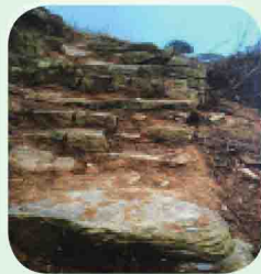
羊头山神农城遗址古旧步道

址与正在复建的炎帝高庙相邻，而已断流的“神农泉”遗址就在其下。这与北宋《太平寰宇记》的记载基本吻合。