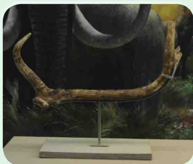
带切痕的鹿角化石