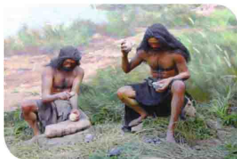
远古人类制作石器场景

山西地处黄河中游，华夏腹地，山川秀美，气候适宜，是中国远古人类和文明的摇篮。山西的旧石器文化全国领先，且早、中、晚期遗存都很丰富，自成序列。其中，早期遗址有 157 个，占全国的 78.5%，芮城西侯度文化和匭河文化与云南的元谋人属于同期，证明在 180 万年以前山西已经有了最早的原始人类。