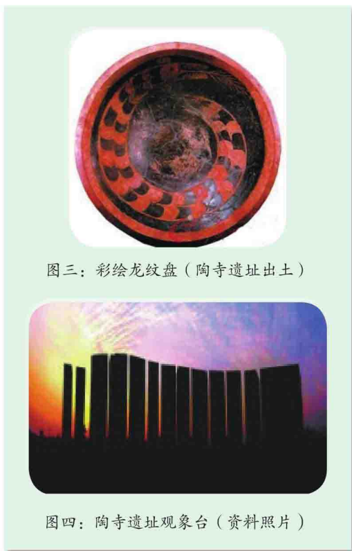
图三：彩绘龙纹盘（陶寺遗址出土）

从4000多万年前运城垣曲“世纪曙猿”化石的“一缕曙光”，到180万年前运城芮城西侯度文化遗址的“一堆圣火”，到高平羊头山的“一座山头”，再到临汾襄汾陶寺遗址的“一座都城”。一系列重大发现都在证明，中国最丰富的古代文物留存在山西，最早的中国在山西，华夏文明的起源也在山西。