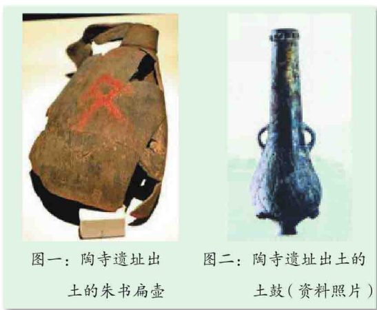
图一：陶寺遗址出土的朱书扁壶

在陶寺的墓葬区，王级的墓葬中出土了制作精美的彩绘蟠龙纹陶盘，蟠龙以红白彩描绘，周身遍饰红鳞纹，巨口张开，利齿毕现，既是帝尧邦国的图腾，又是典籍所载