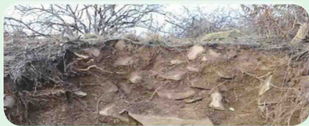
羊头山神农城遗址人工石砌围墙剖面