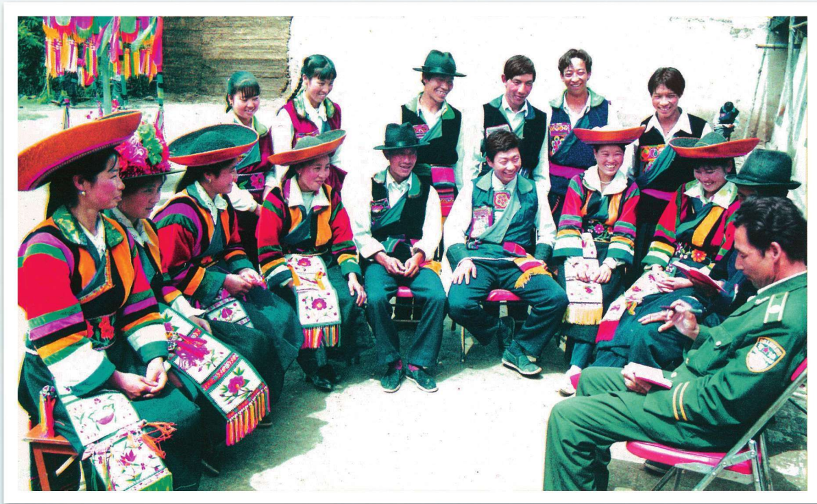
1994年，互助县司法局组织土族群众学习《民族区域自治法》