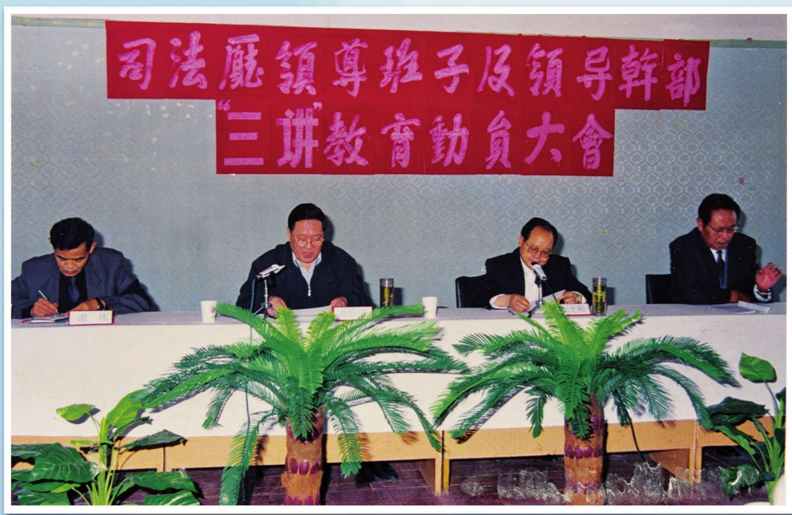
1997年9月14日，中共青海省委常委、副省长刘光和（右二）与省委“三讲”教育巡视组组长蔡巨乐（左二）参加省司法厅“讲学习、讲政治、讲正气”教育动员大会并讲话