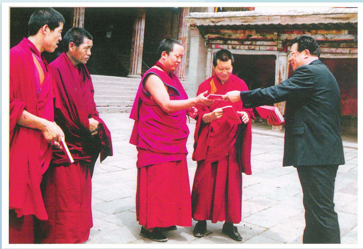
1995年，湟中县司法局向塔尔寺宗教教职人员发放法制宣传材料