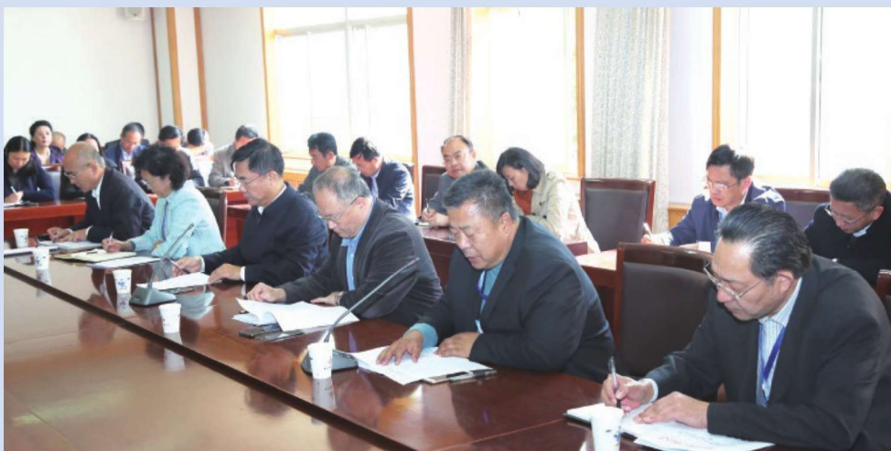
2017年10月31日,学校召开会议部署学习宣传贯彻党的十九大精神工作。