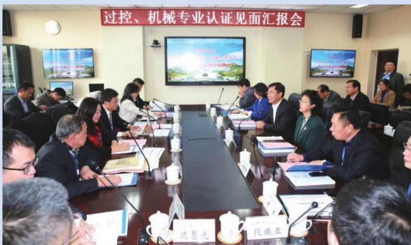
2017年11月20日,全国工程教育专业认证专家组进校考查。