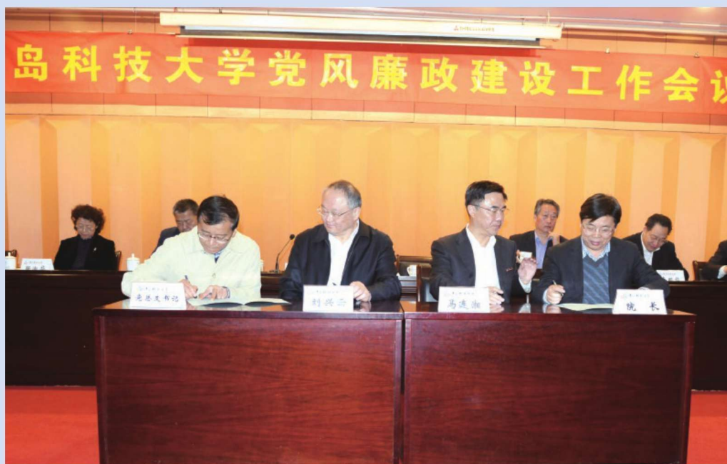
2017年4月13日，学校召开党风廉政建设工作会议。