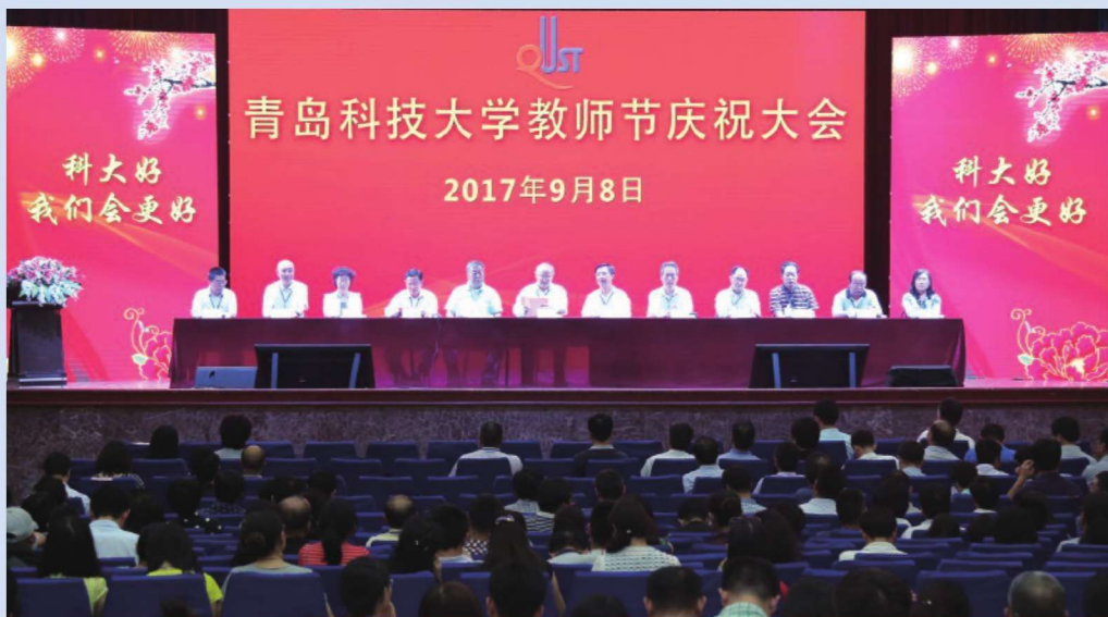
2017年9月8日，学校教师节庆祝大会举行。