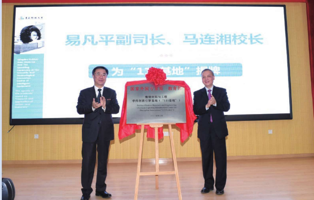
2017年12月15日，橡塑材料与工程学科创新引智基地（“111基地”）揭牌。