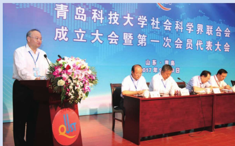
2017年9月23日，学校社会科学界联合会成立大会暨第一次会员代表大会举行。