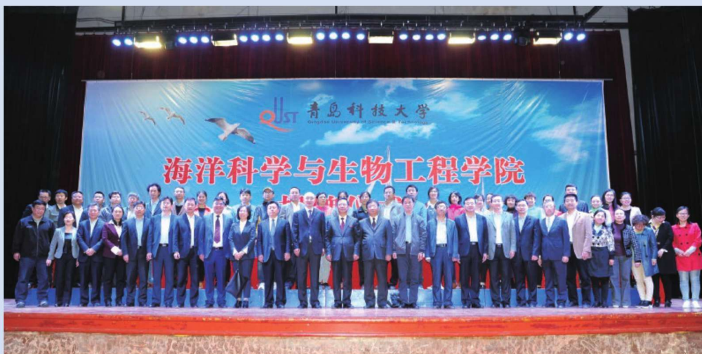
■■■ 2017年1月9日，学校海洋科学与生物工程学院成立大会举行。