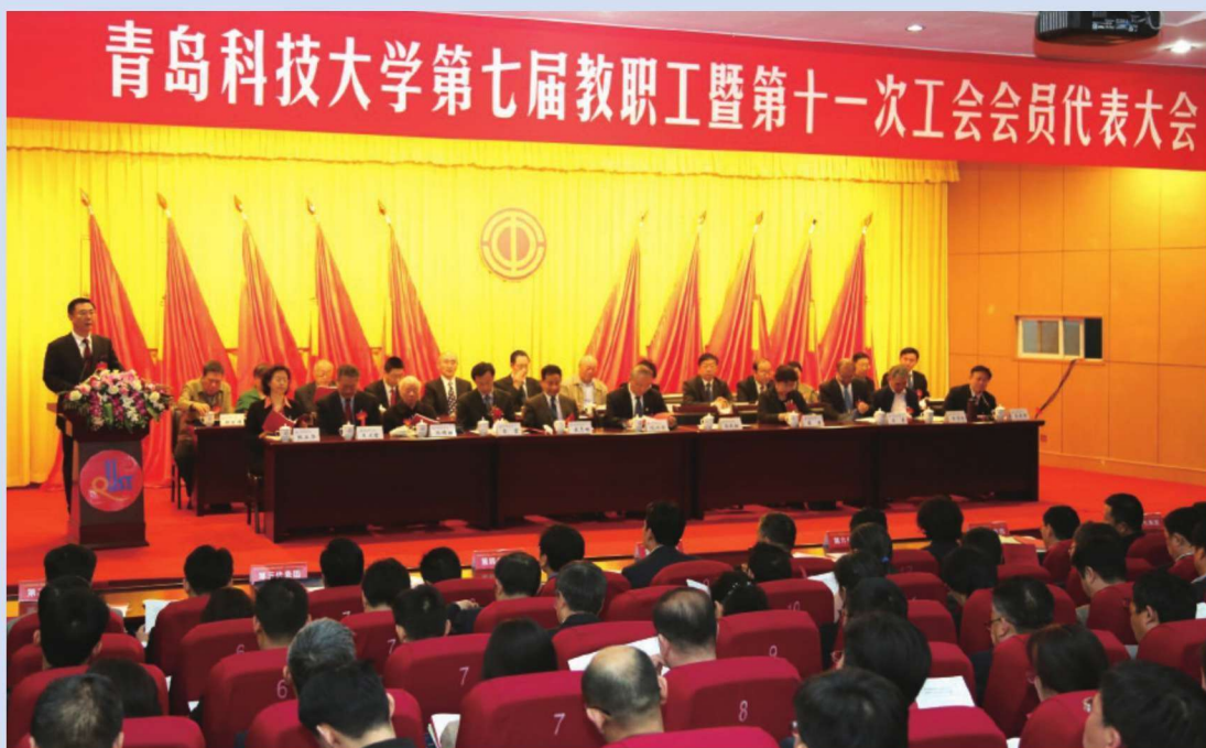
2017年4月22日，第七届教职工代表大会暨第十一次工会会员代表大会开幕。