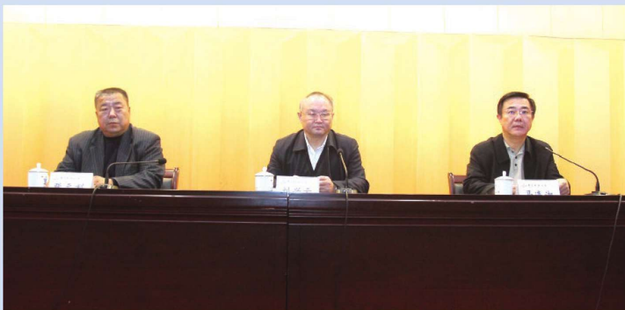
■■■ 2017年1月9日，学校召开寒假前中层干部会议。