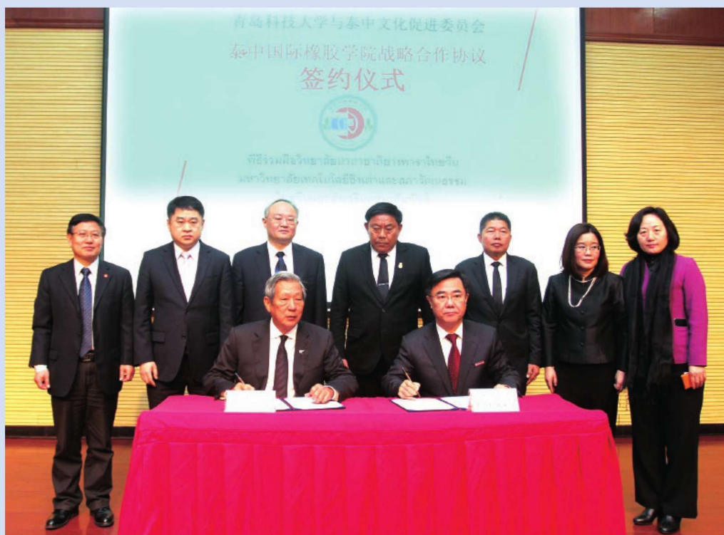
2017年3月21日，泰中国际橡胶学院名誉院长聘任暨战略合作签约仪式举行。