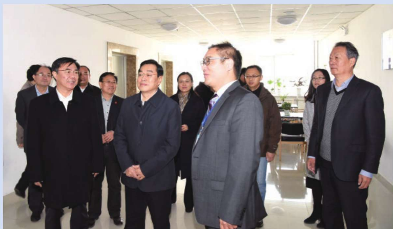
2017年11月20日,省委常委、组织部部长杨东奇来校调研。