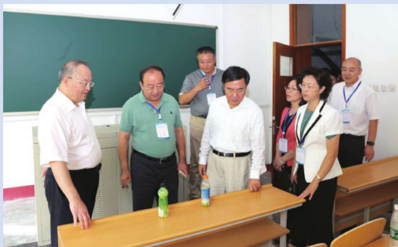
■■■ 2017年8月8日，校领导视察指导崂山、四方两校区暑期改造与在建工程建设项目。