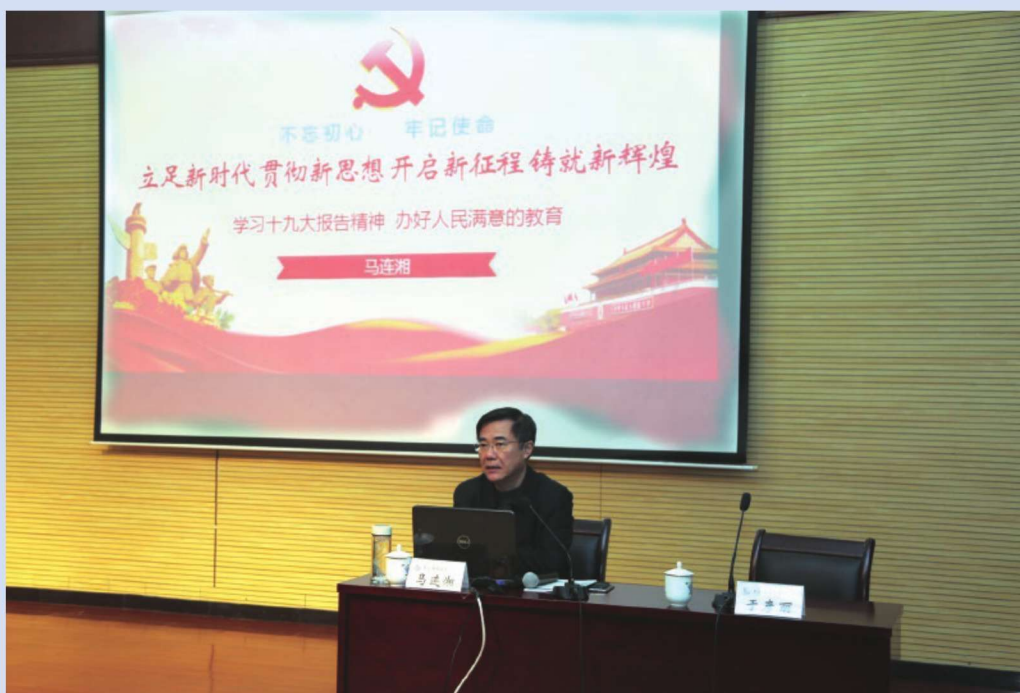
2017年12月27日，学校中层副职领导干部党的十九大精神专题学习班开班。