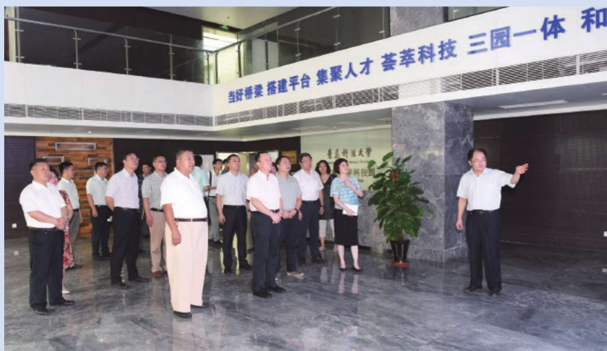
■■■ 2017年7月24日，国务院第四次大督查第九督查组一行来校实地督查。