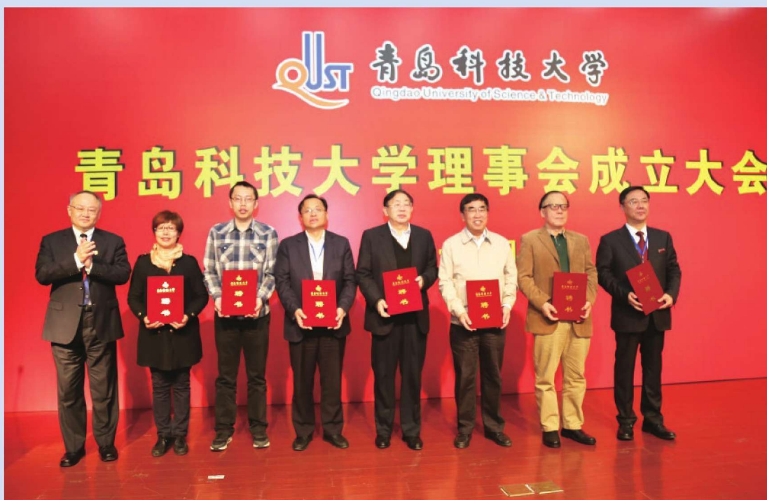
2017年4月26日，青岛科技大学理事会成立。