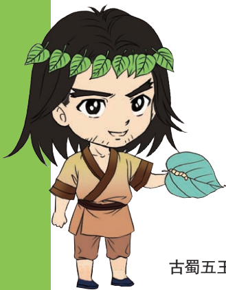
古蜀五王Q版形象之蚕丛