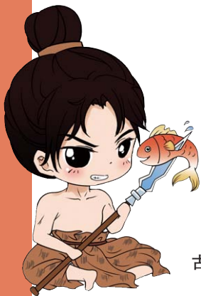
古蜀五王Q版形象之鱼凫