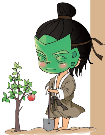
古蜀五王Q版形象之柏灌