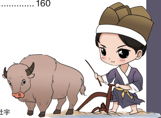
古蜀五王Q版形象之杜宇