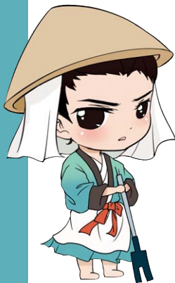
古蜀五王Q版形象之鳖灵