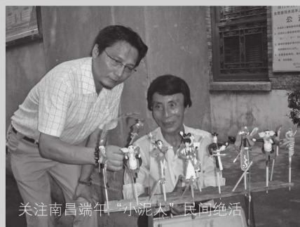
关注南昌端午“小泥人”民间绝活