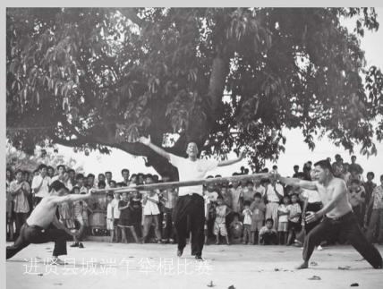
进贤县城端午竿棍比赛