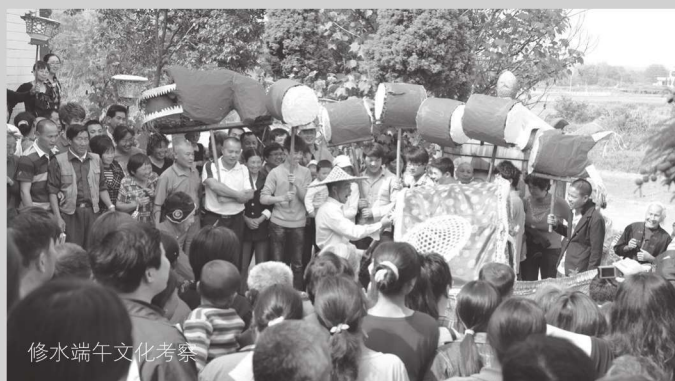
修水端午文化考察