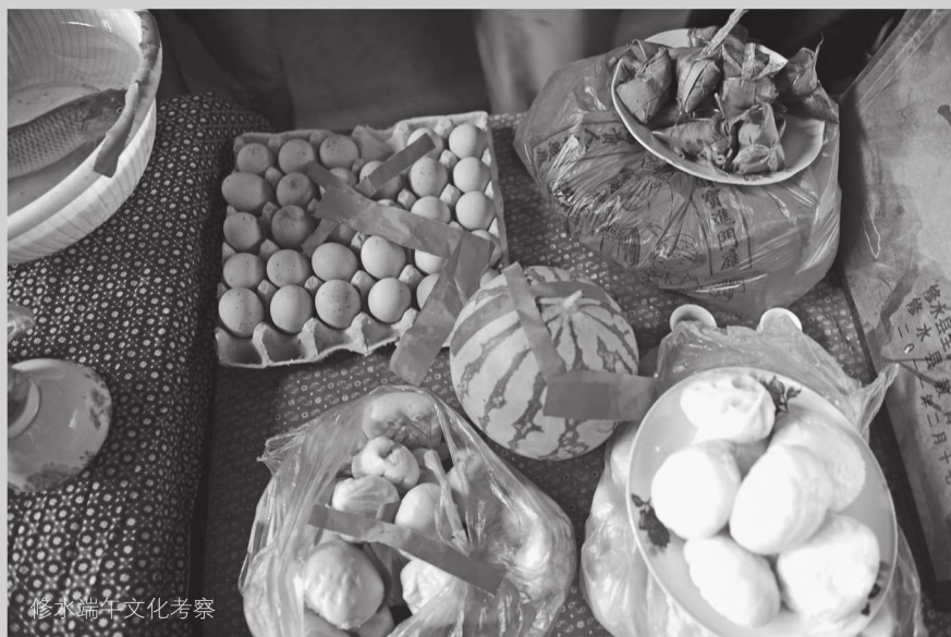
修水端午文化考察