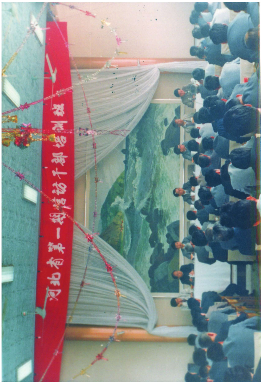
1991年5月，河北省举办第一期信访干部培训班