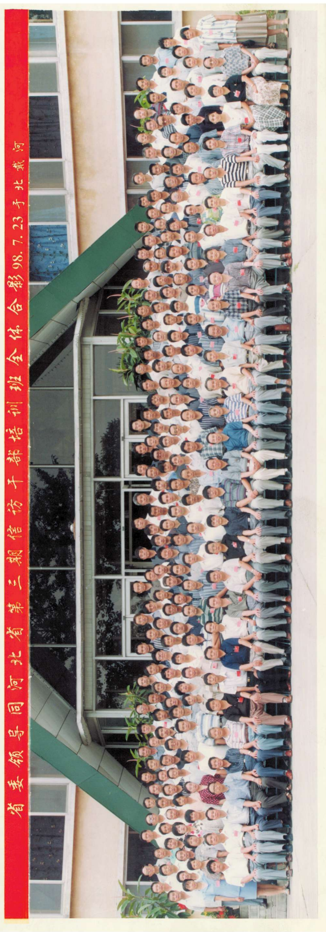
1998年7月23日，参加在北戴河举办的河北省第三期信访干部培训全班学员合影