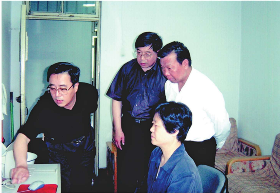
2002年6月22日，国家信访局局长周占顺(后排右一)考察河北省信访局信息化建设