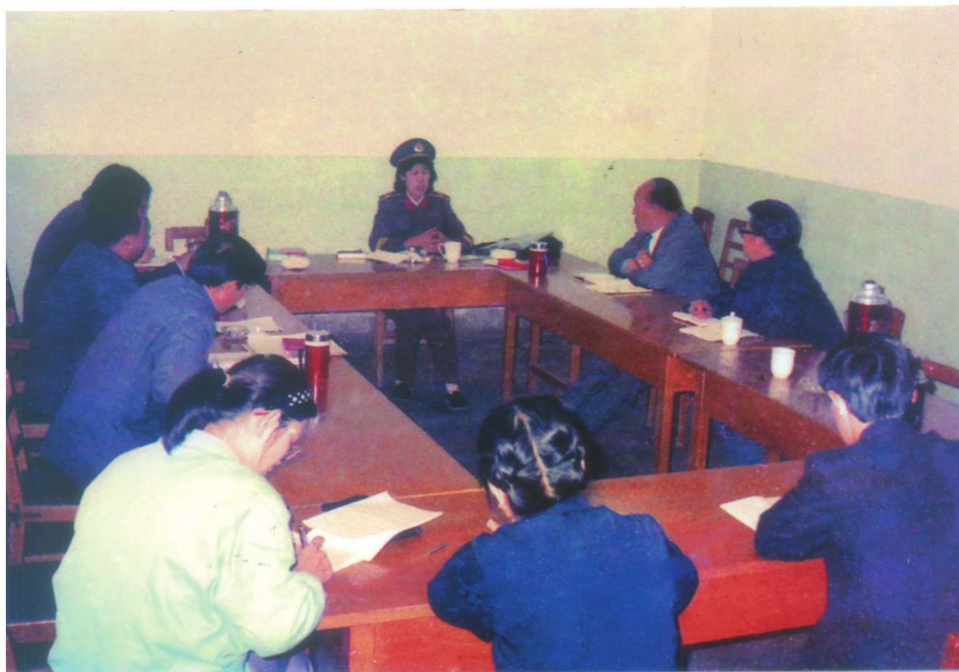
1990年4月26日，中共河北省委书记邢崇智(右三)接待来访群众