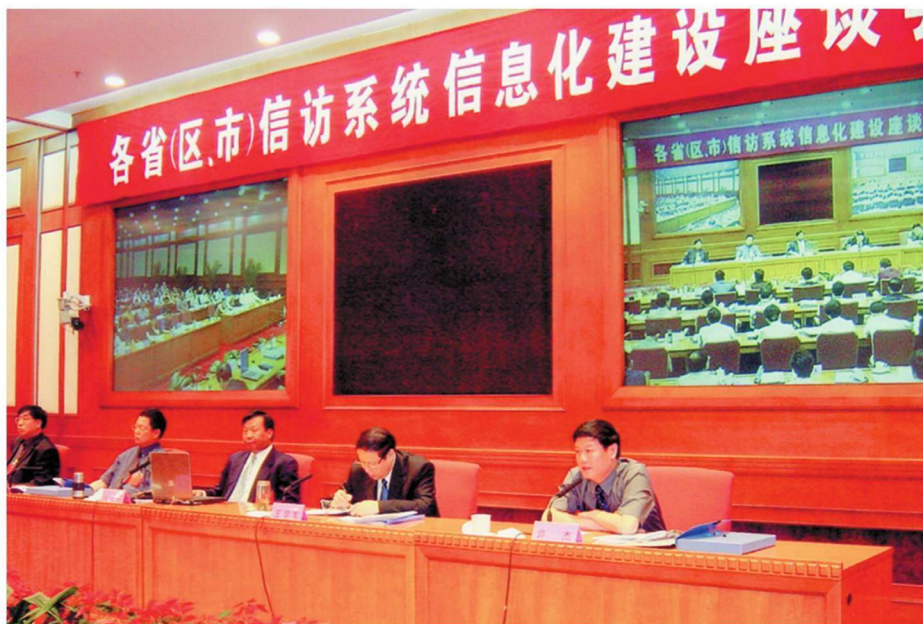
2002年6月22日，全国各省(区、市)信访系统信息化建设座谈会在石家庄市召开，国家信访局局长周占顺(中)出席会议