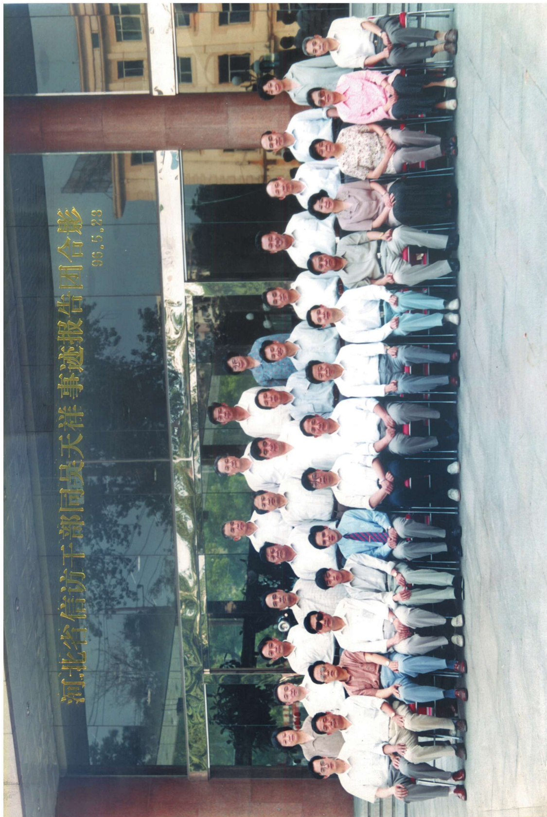
1996年5月23日，中共河北省委常委、宣传部长韩立成(前排右七)同赴河北宣讲的全国优秀信访干部吴天祥(前排右八)事迹报告团合影