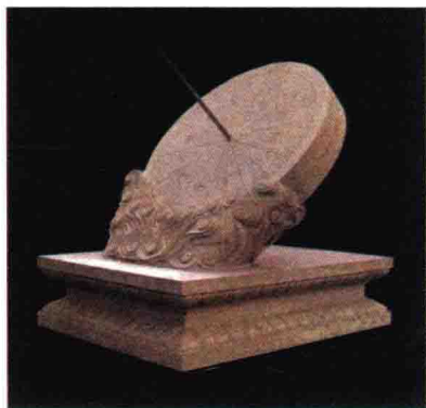
日晷，是古人利用太阳投影测计时刻的一种计时仪器