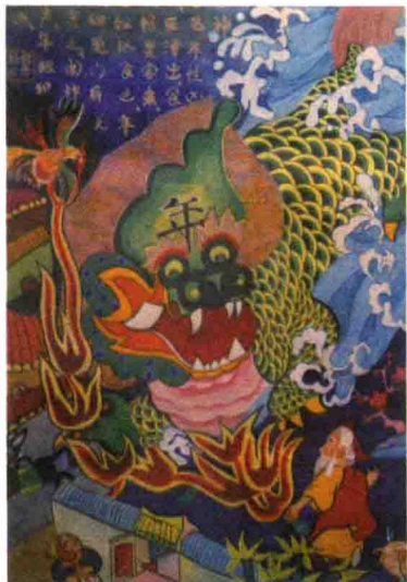
年兽的形象是抽象的，这是青州农民画家笔下的年兽形象

这就是过春节又被称为“过年”的缘故。然而，勤劳智慧的中国劳动人民，总是喜欢借助于一些口头相传的民间故事，赋予世间万物一个神奇而生动的由来。因此，在我国民间，关于“过年”这一说法的来历，流传着一个有趣的故事：