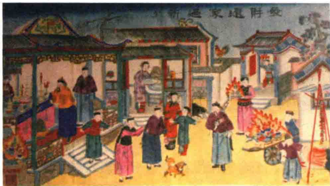
发财还家，年年大有

时间长了，人们在跟“年”的斗争中，掌握了“年”的许多弱点，比如害怕红颜色、怕响声、怕火光等。有一年，大伙儿都在门口贴上红纸，不断敲锣打鼓、放鞭炮，晚上屋子里彻夜点灯。当“年”下山觅食时，蓦然发现山下家家户户灯火通明，到处都是敲锣打鼓声和震天动地的鞭炮声，“年”吓得慌忙逃入深山里去了。天亮之后，每一家都平安无恙。于是，人们高兴地互相祝贺道喜，欢庆胜利。