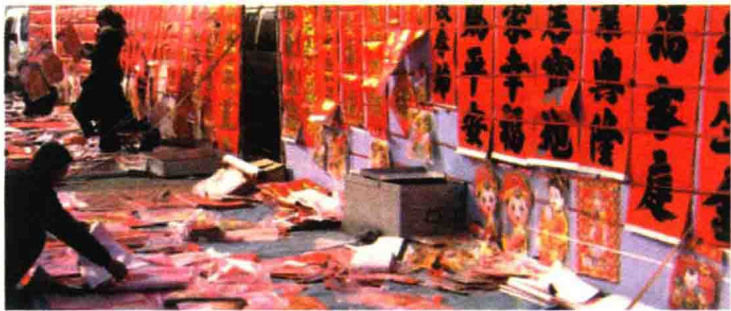
自古至今，春联都是年市上一道最艳丽的风景

相较于其他节日，年节的时间长了许多。它总是要经历一个由序曲到高潮，再到谢幕的过程。在我国，无论城镇还是乡村，每当迈进腊月门，年味就开始变得浓了起来。