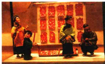
在昔日的年市上,还有不少售卖窗花的小贩

一大早儿,从各村庄通往集市的路上,挑挑的,担担的,推车的,背筐的,挎篮子的……人流不断,车流不息,四面八方的赶集者朝着集市的方向汇聚过来。离着集市还有二三里地远,就能听到集市上传来的喧闹声。