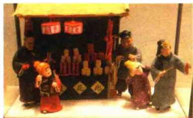
在旧日的年市上,最热闹的地方当然属鞭炮市

在年集上,最热闹的地方,当然还是鞭炮市。卖烟花鞭炮的摊点,被里三层外三层的人包围着。而那些卖烟花鞭炮的商贩更是扯破喉咙,不遗余力地吆喝叫卖,不时地点燃一挂鞭炮来炫耀自己的鞭炮