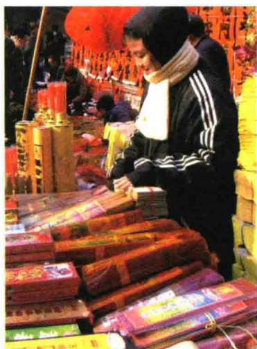
在现代的年市上，香烛纸马的生意仍很红火

而在清代文人顾禄撰写的《清嘉录》一书里面，把苏州腊月年市的情景，描写得更加生动详细：年市上热闹非凡，人们都忙着置办年货。一直到深夜，仍不散市。当时的杂货铺、熟食铺，生意异常兴隆。人们纷纷购买鸡鸭鱼肉，以备年节时食用。纸马香烛铺，则将提前印刷好的财神、灶马、门神等摆出来出售。另外，还有纸糊的元宝、蜡烛和各类名香等供品。