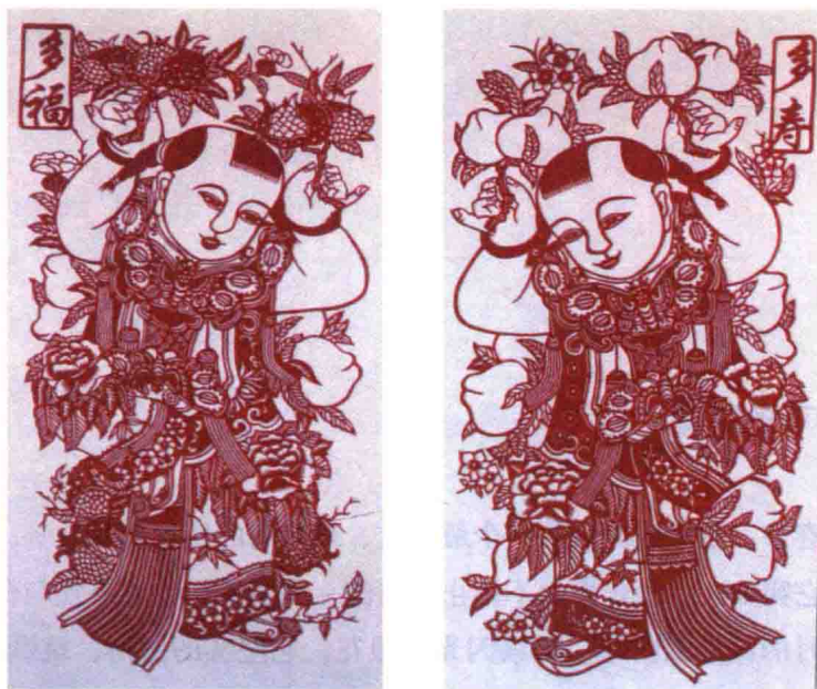
多福多寿，欢乐春节

了现代的元素。“春节”一词，最早见于《后汉书》：“冬无宿雪，春节未雨，百僚焦心。”但这里的“春节”指的是整个春季，跟我们今天所说的春节并不是一个意思。