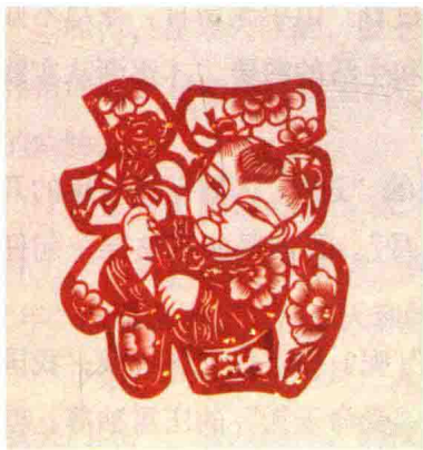
祈福得福，是中国新年习俗中的一个永恒不变的话题

1912年1月1日，孙中山通电全国，宣告“中华民国改用阳历，以黄帝纪元四千六百零九年即辛亥十一月十三日，为中华民国元年元旦”。于是，农历元旦也就改为“春节”。虽然民国期间禁止农历节令的娱乐活动，但由于民国时局四分五裂，人们还是习惯于过传统的“元旦”——“春节”。