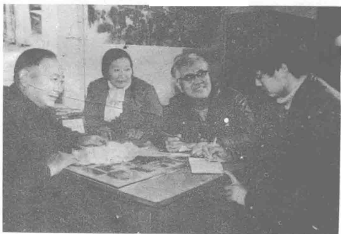
③▲ 重钢集成办公室研究工作