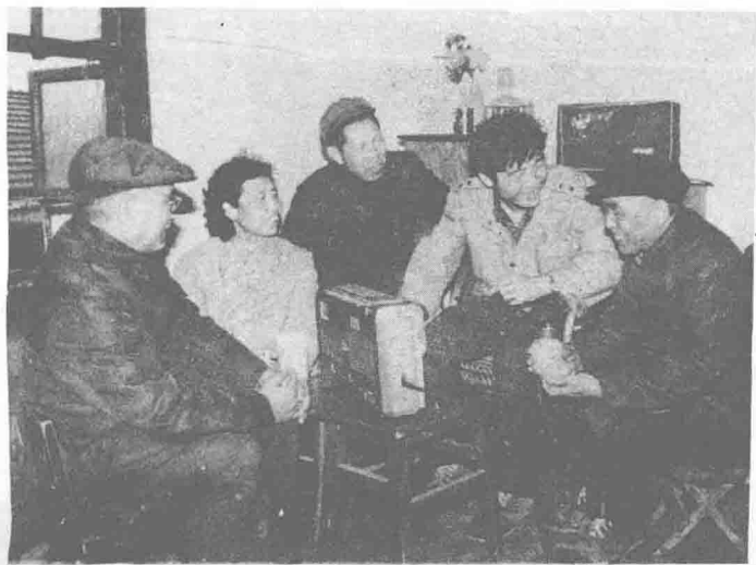
④▲ 在九宫庙街道采风