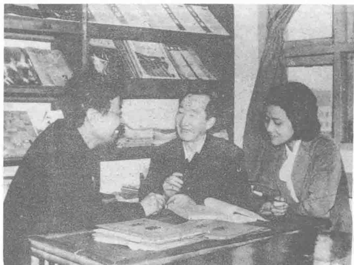
②▲ 区集成编辑部同志讨论稿件