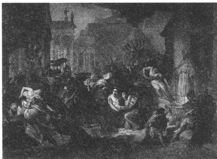
汪达尔人（日耳曼人的一支）在罗马烧杀抢掠