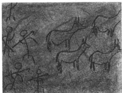
石器时代关于狩猎的壁画

人类大约有了五十万年的历史。最古人类的骨骼像猿猴，后来经过长期的演变，就变成现在这样的人类了。