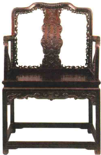
清乾隆 紫檀西番莲纹扶手椅 高 108 厘米 观复博物馆藏

紫檀是中国古典家具中最优良的材质，在漫长的历史时期都是宫廷御用，民间非常少见，高贵、稀缺、天价是它的代名词。紫檀是一种很重的木材，而在中国人的材质观中，越重就越值钱。所以，中国人普遍热爱紫檀、黄花梨、红木等硬木做的家具。