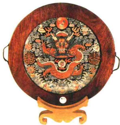
清中期 皇袍团龙绣红木托盘

这是一件龙袍的后背部分，画有一条龙。历史上有很多龙袍都因为使用和保存不当而烂掉了，其局部则被西方人所利用，制作了一些艺术品。这块龙袍就被做成成了一个托盘，有两个把手，木框是后来制作的，使用了一块完整的木头，这是西洋的风格，而在中国制作圆形的器具一般是拼接的。