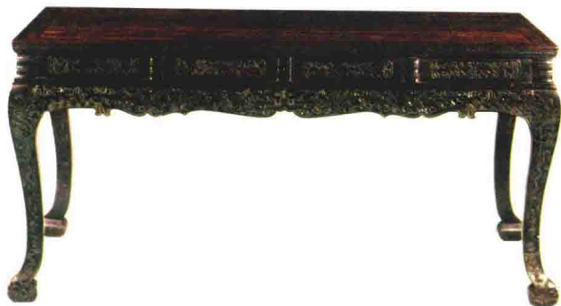
清早期 紫檀雕螭龙纹大画桌 长 182 厘米 观复博物馆藏