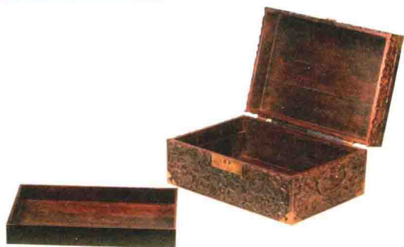
清代 紫檀浮雕龙凤纹箱 长41.5厘米 观复博物馆藏