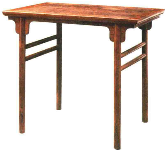
明晚期 黄花梨刀子板小平头案 长92厘米 观复博物馆藏