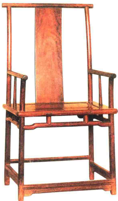
明代 铁力木四出头官帽椅 高 116 厘米 王世襄旧藏

中国传统椅子的靠背板和扶手都是笔直的（如下图），而它的靠背板和扶手是曲线的，扶手中间还有一个落差，使椅子显得非常优美。要呈现大量的曲线和落差，需要的木材就很大，在用材上也要特别讲究。这件家具并不是很重，但用材却很大，显示了当时国家的强盛与宫廷的奢华。