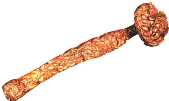
清乾隆 沉香木长治久安如意

这是一个沉香木如意。在清代，如意的造型变得非常完美，而乾隆年间宫廷制作的如意所使用的材质也很广泛，有玉器的、瓷器的、景泰蓝的、竹璜的、紫檀的等，我们常见的材料基本上都做过如意。