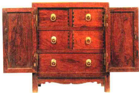
明晚期 黄花梨方角小柜 高 46 厘米 观复博物馆藏