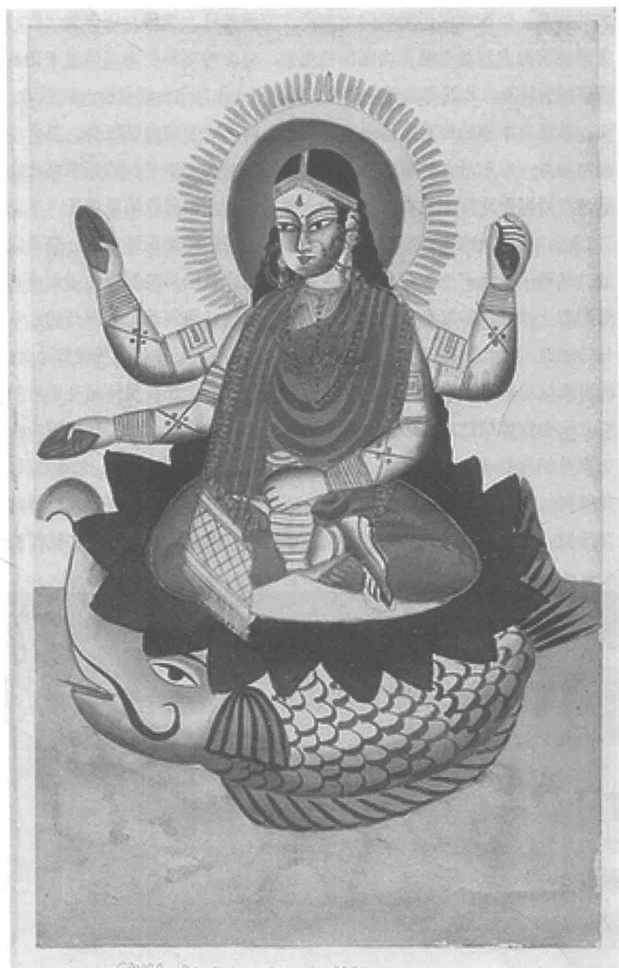
恒河的化身——恒河女神