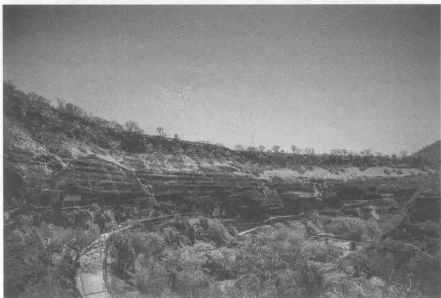
阿旃陀石窟外景（马哈拉施特拉邦）

温迪亚山和讷尔默达河以南是印度半岛。除西海岸地区外，整个半岛的地势西高东低，故河流都是东流入海。与东海岸平行的是东高止山脉，与西海岸平行的是西高止山脉，两条山脉之间的高地是德干（意即“南方”）高原。德干高原是由地质年代最古老的冈达瓦那古陆分裂而成的。从德干高原东流入海有几条重要的河流，这些河流都冲击了大小不等的肥沃平原，印度半岛的文化基本上是以这几条河流为界展开的：从马哈纳迪河到戈达瓦里河之间（即现在的奥里萨）是古代的羯陵伽地区，因古代这里有过一个强盛的羯陵伽王国而得名；戈达瓦里河至克里希纳河之间为安德拉地区，历史上这里出现过伟大的维查耶纳伽拉王朝；从克里希纳河到半岛的南端，是泰米尔地区，这里雨量充沛，土地肥沃，是独树一帜的泰米尔文化的发祥地，历史上的朱罗王朝就兴起在克佛利河流域，它最强盛时包括北部的安德拉地区。印度南部各地的文化传统