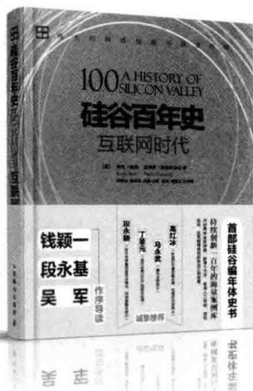
《硅谷百年史——互联网时代》