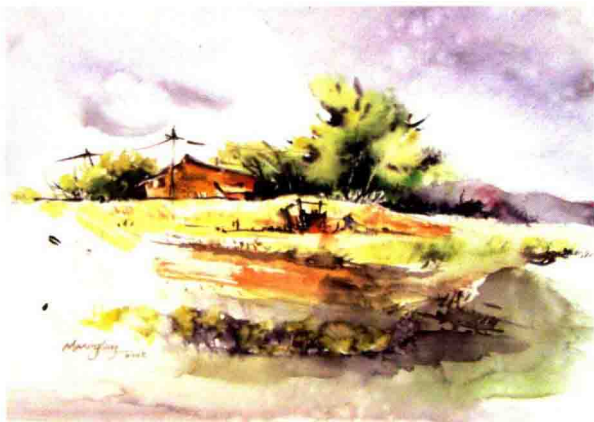
图1-3 风景小品 18cmx27cm 马兴隆 2008