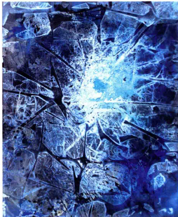
图1-6 冬1 80cmX60cm 傅保中 2008