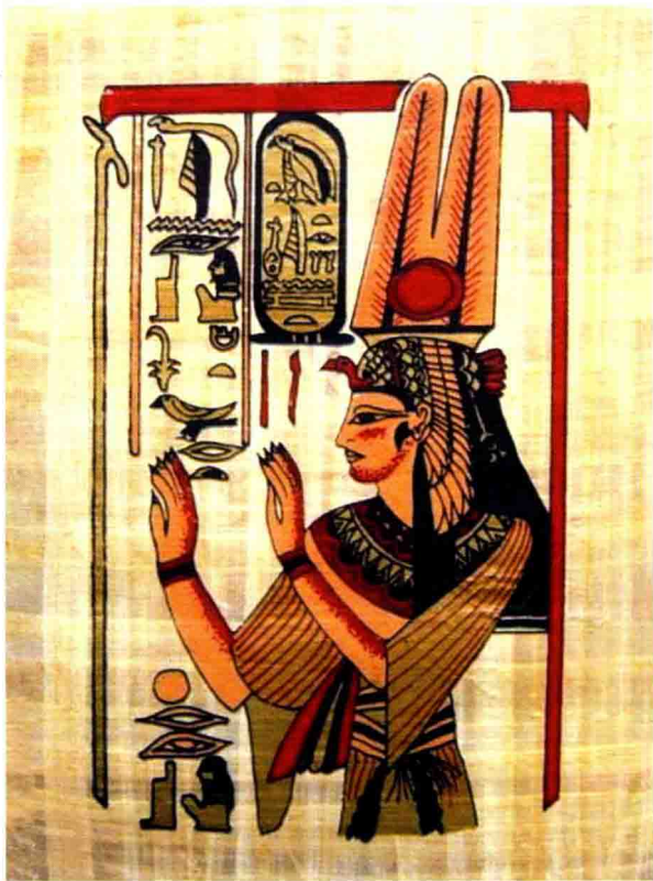
图1-7 埃及莎草纸画《死书》插图 公元前16世纪