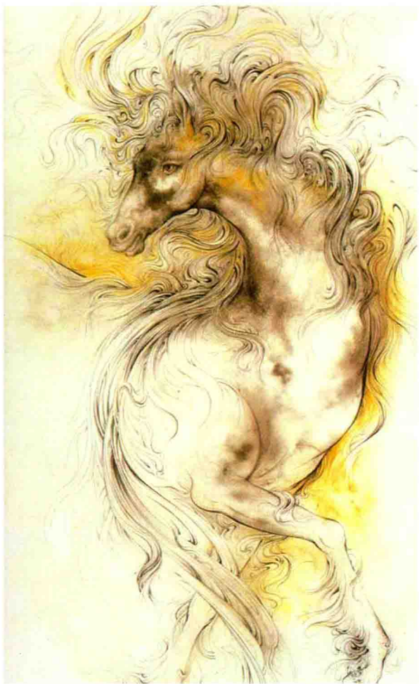
图1-8 伊朗细密画 公元8世纪