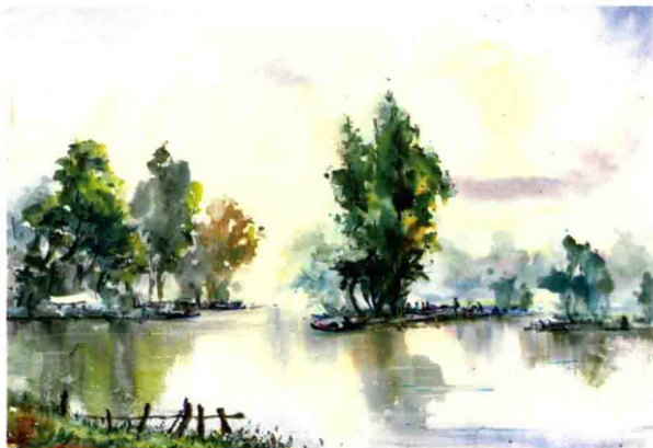
图1-4 湖畔夕阳 36cmx55cm 屠维能 2008