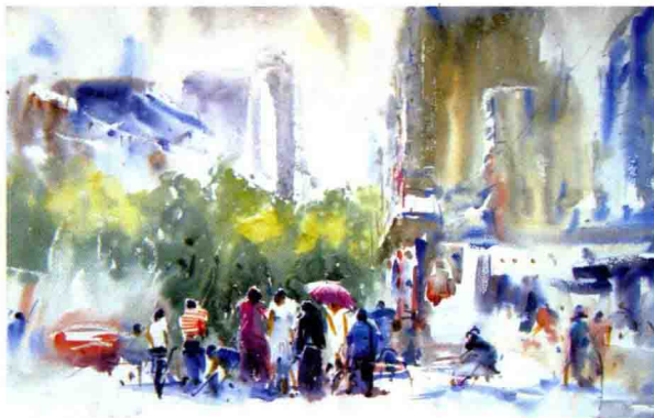
图1-2 街景 38cmx55cm 屠维能 2009