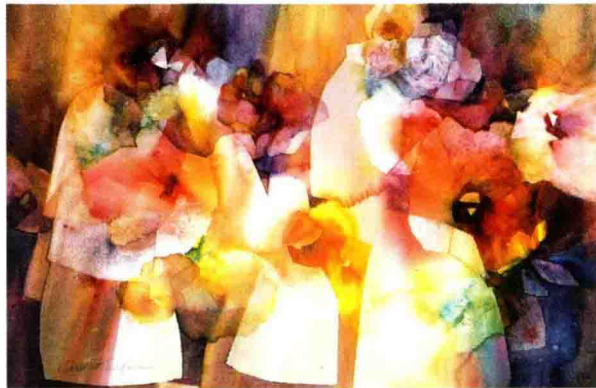
图1-5 花卉 美国 2002