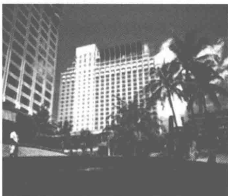
图2 香格里拉大酒店

酒店坐落于占地6万平方米的茂盛植物园之中,信步可达乌节路休闲与购物区。酒店有750间豪华的客房与套房,分布于三座风格各异的翼楼之中:现代化的高塔翼(Tower Wing)、充满热带风情的花园翼(Garden Wing)及凸显尊贵的峡谷翼(Valley Wing)。