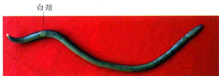
栉盲远盲蚓（地龙原动物之一）