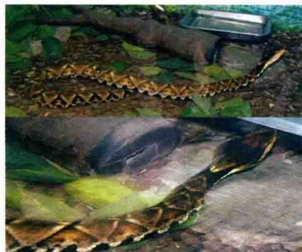
尖吻蝮 (蕲蛇原动物)

10. 方胜纹：为蕲蛇识别特征。其背部红棕色，两侧纵向排列 17 ~ 25 个浅棕色或黑褐色的菱形斑纹，习称“方胜纹”。