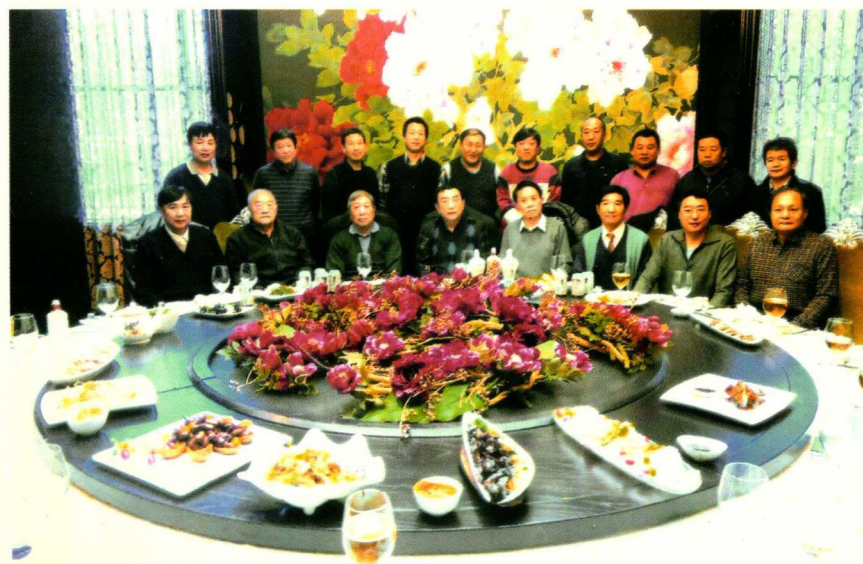
☆作者70寿辰纪念(2013年11月)