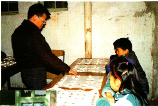
☆胡荣华在作者棋室指导小棋手 (1992年10月)