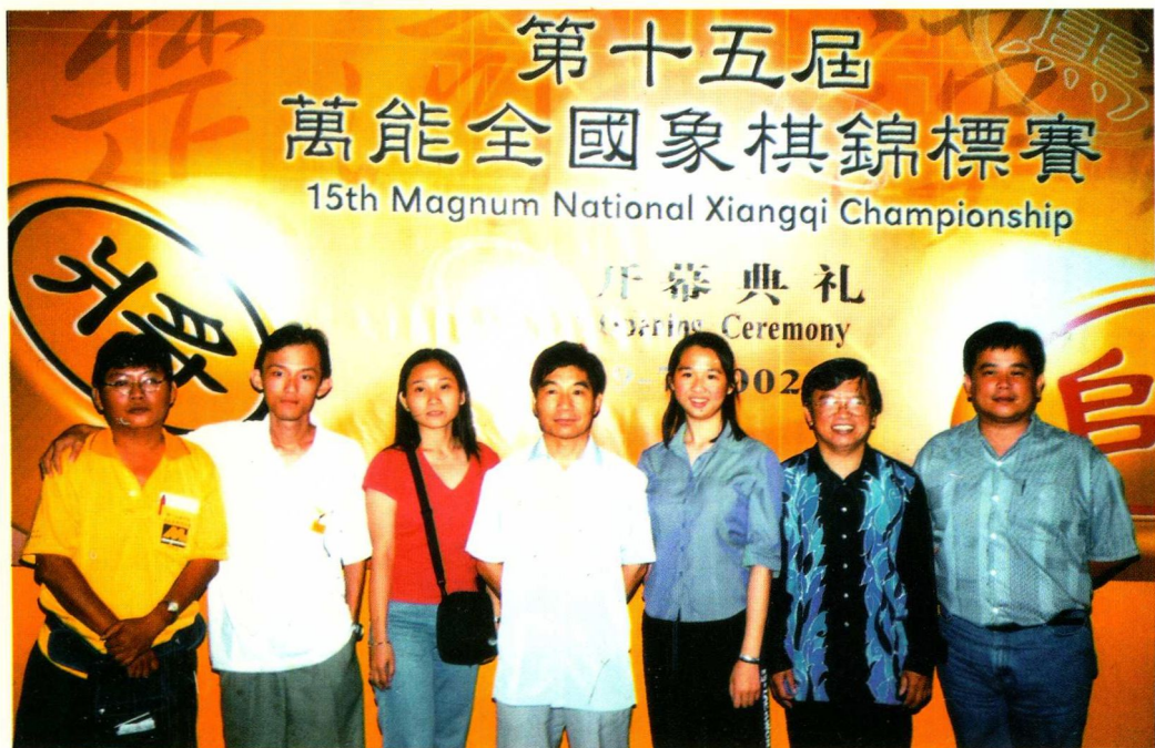
☆马来西亚全国象棋赛期间与部分参赛者合影 (2002 年)