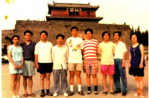
☆火车头队获全国象棋团体赛冠军后合影 (1992年夏)