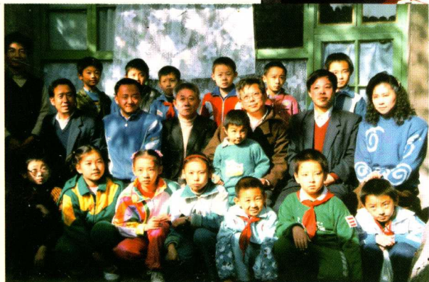
☆全国象棋赛期间访问作者小棋室的全国高手与小棋手合影 (1992年10月, 中排左起: 刘殿中、徐天红、徐天利、胡荣华、赵国荣、单霞丽, 后排左一: 傅光明)