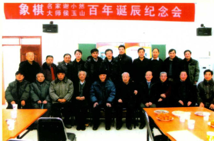
☆纪念谢小然、侯玉山百年诞辰座谈会合影 (2012年12月20日)