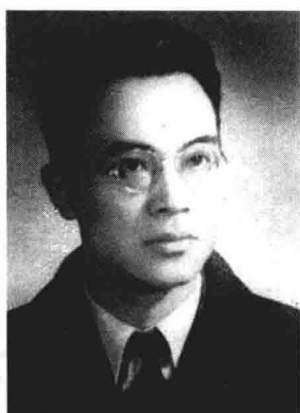
国立师范学院英文系主任 钱钟书