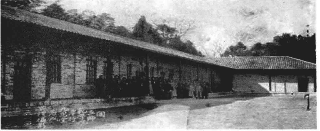
国师校舍之一：九思堂，1939年1月建成。