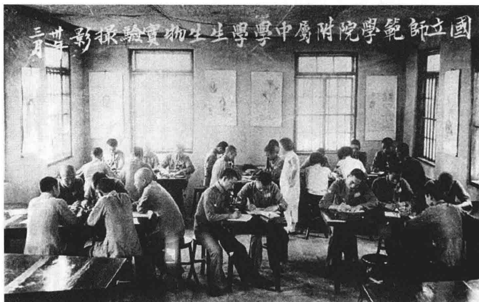
国师附中生物实验室（1941年3月）