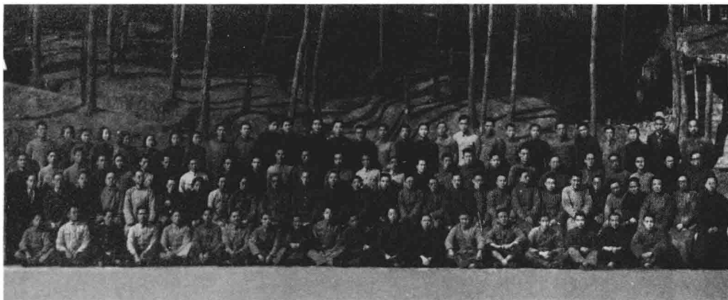
国立师范学院第一届毕业摄影（1943年1月）