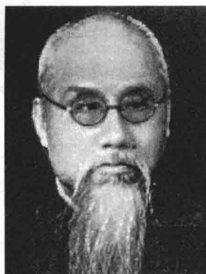
国立师范学院国文系主任 钱基博