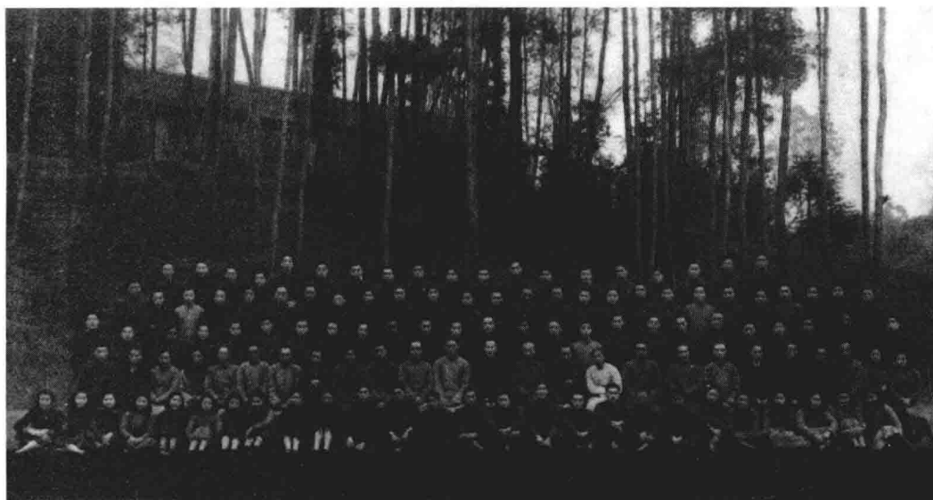
国立师范学院第二届毕业摄影（1943年1月）