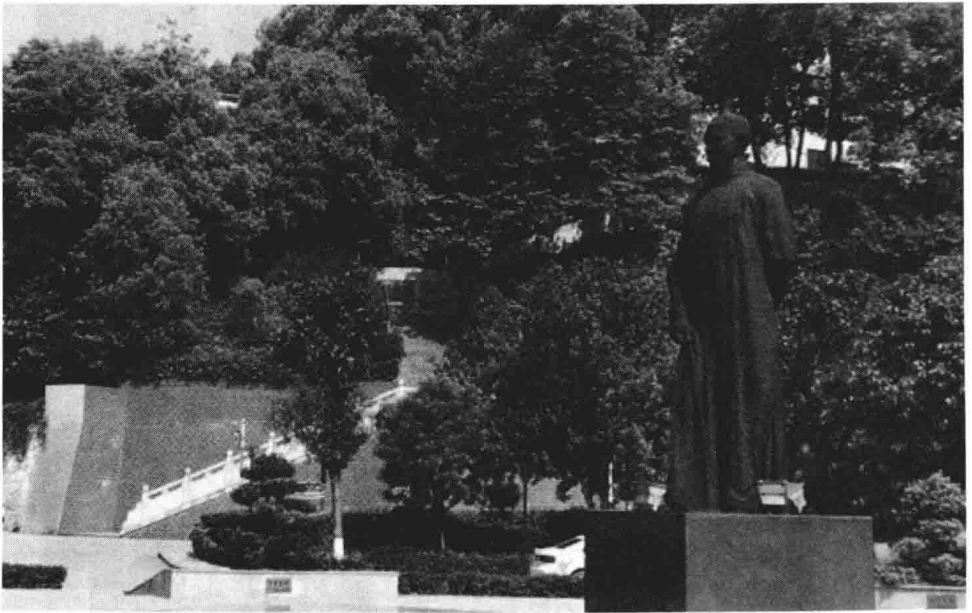
涟源一中国师广场上的廖世承铜像（2015年4月 吴勇前摄）