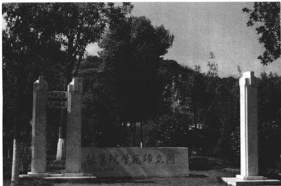
湖南师范大学在涟源一中校园里建立的国师旧址纪念碑 (2015年4月)