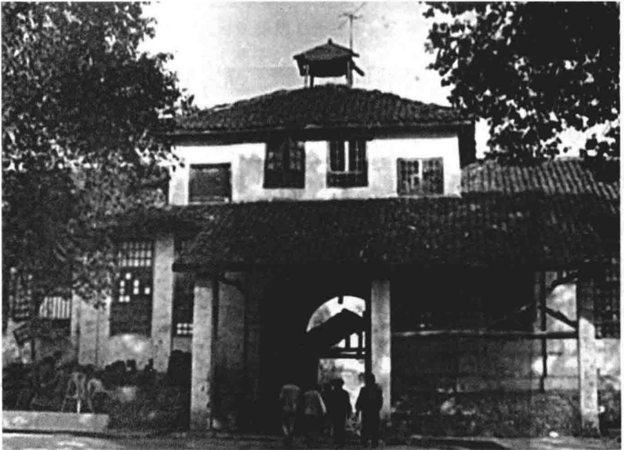
国师钟楼（今涟源一中三间钟楼处，1984年被拆除）