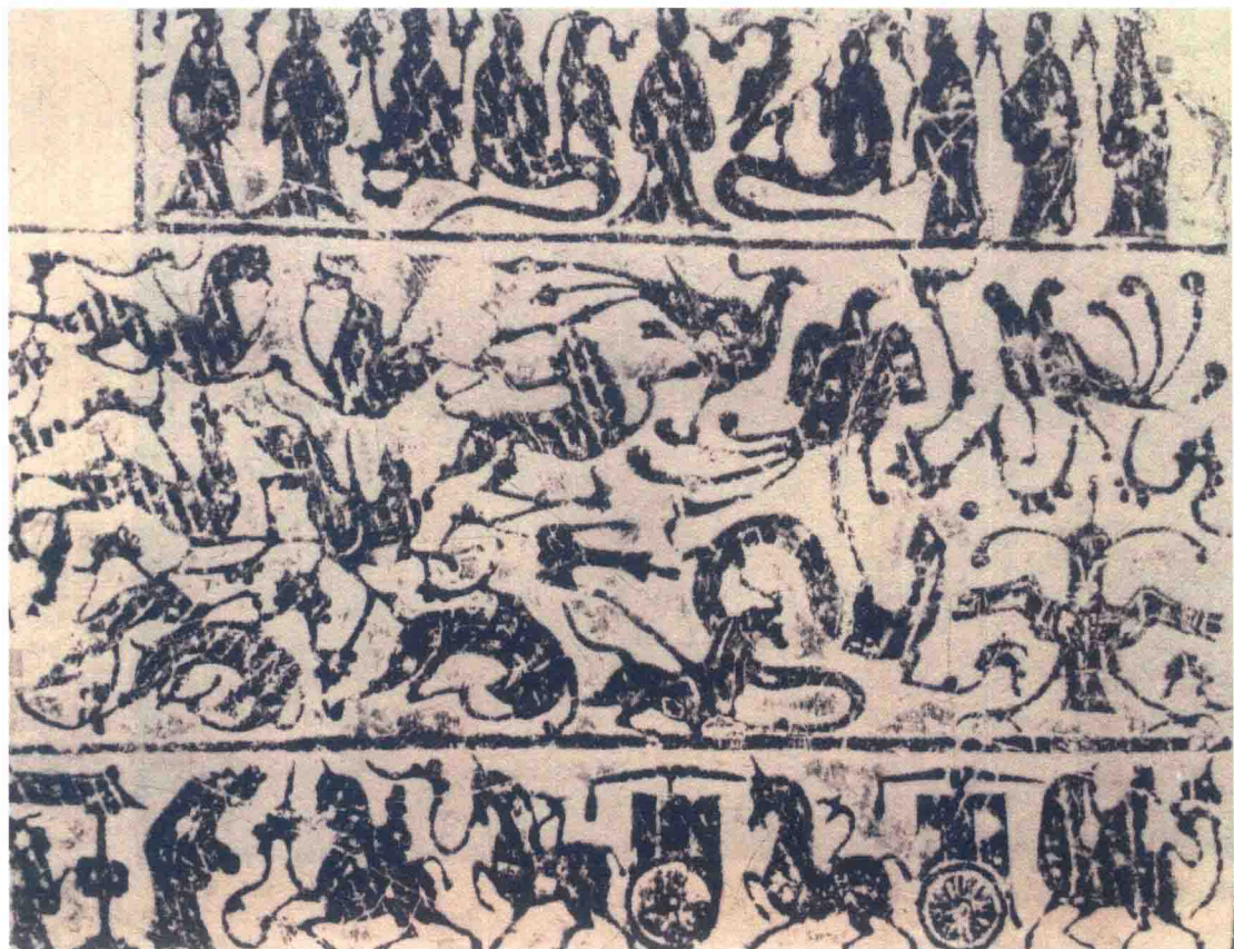
◆ 藤县画像 汉代禽鸟仙灵图