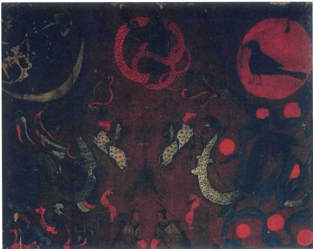
◆ 西汉 马王堆 1 号汉墓 T 型帛画（局部）