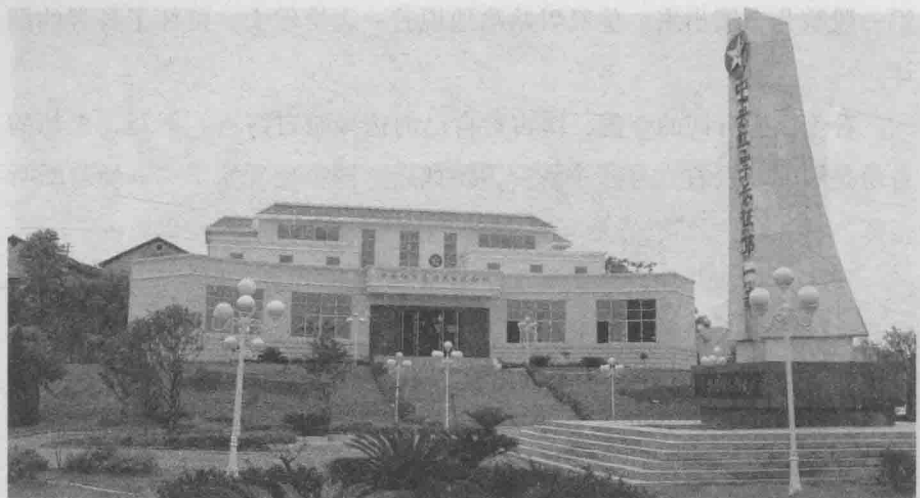
◇红军长征出发地纪念馆