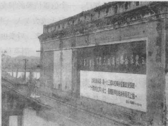
◇ 图为红军刻在通道县的一个革命口号

六位领导人当中，各有各的经历，各有各的想法，红军的前程就掌握在他们的手中。那么，六个人能否达成共识呢？