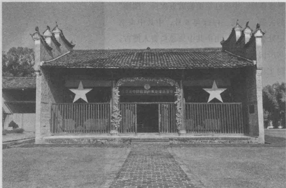
◇瑞金中共中央临时政府

1932年春被共产国际执委会派往中国。他是在当年秋天到达上海的，在共产国际执委会（驻上海）远东局工作。由于共产国际驻华军事代表兼中共中央总军事顾问曼弗雷德·施特恩迟迟未到上海，所以“从第一天起”，奥托·布劳恩“就不得不作出军事上的判断和建议”，开始参与中国革命战争的战略指导。