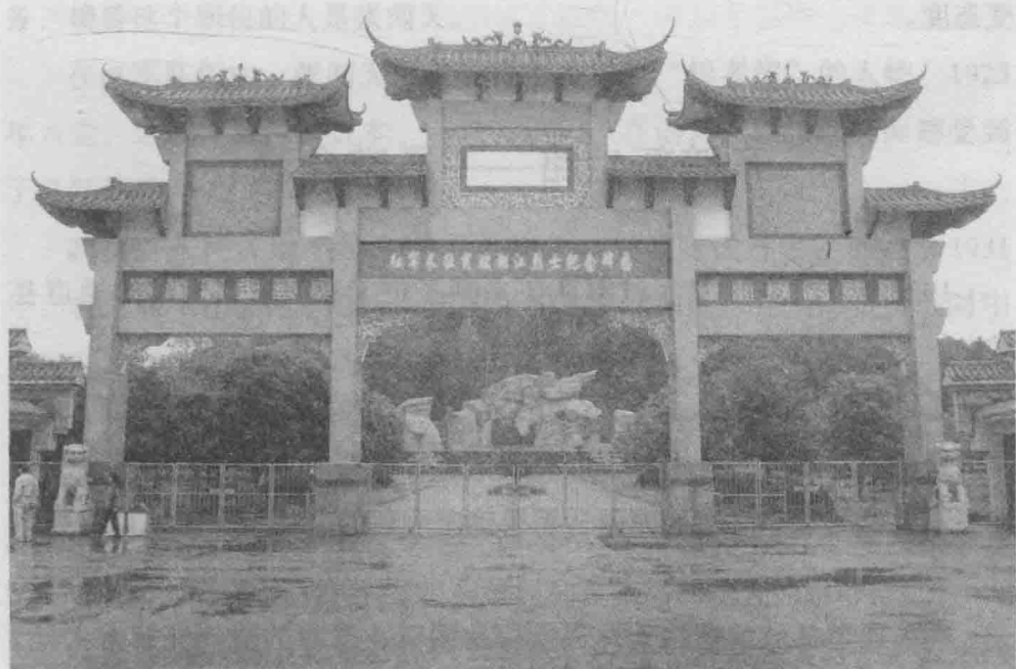
◇红军长征突破湘江烈士纪念碑园