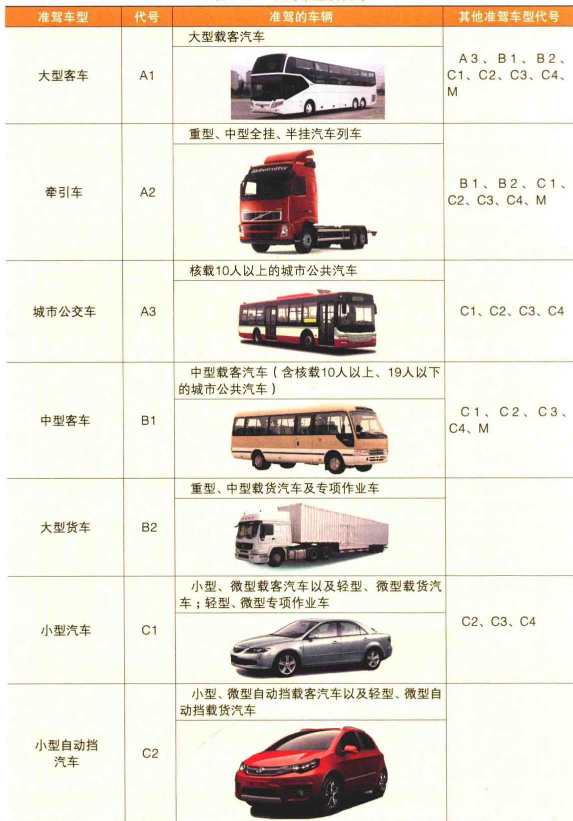
表1.1.1 准驾车型及代号