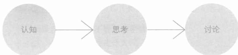
图 0-2 加深理解的三个步骤

所以，当你看到书中的提问时，一定不要忽视它们，请合上书认真思考。如果可以，你最好把自己的想法写下来，或是和朋友、知己、同事和家人进行交流。通过认真思考每一个问题，你将一步步提升自己真正的素养，形成行走世界所必需的思考力的基础（如图 0-2）。