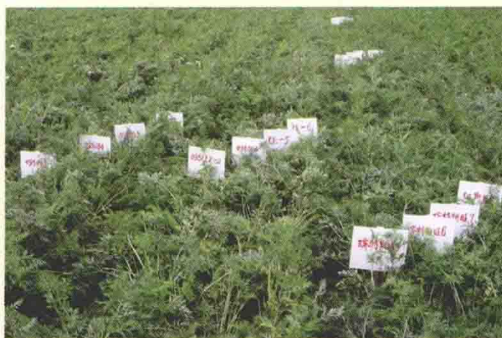
胡萝卜新品种试验田