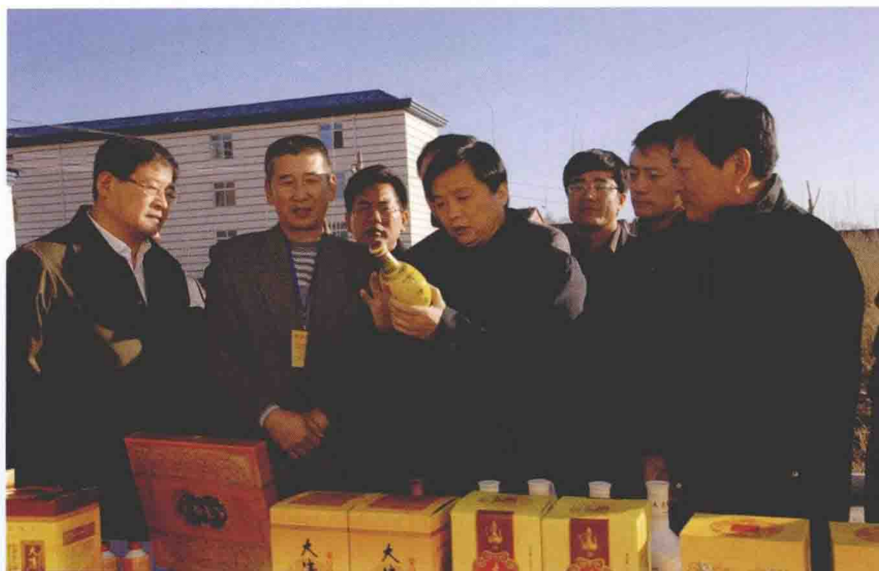
2008年11月14日，承德市委书记杨汭来围场就经济社会发展情况进行调研。