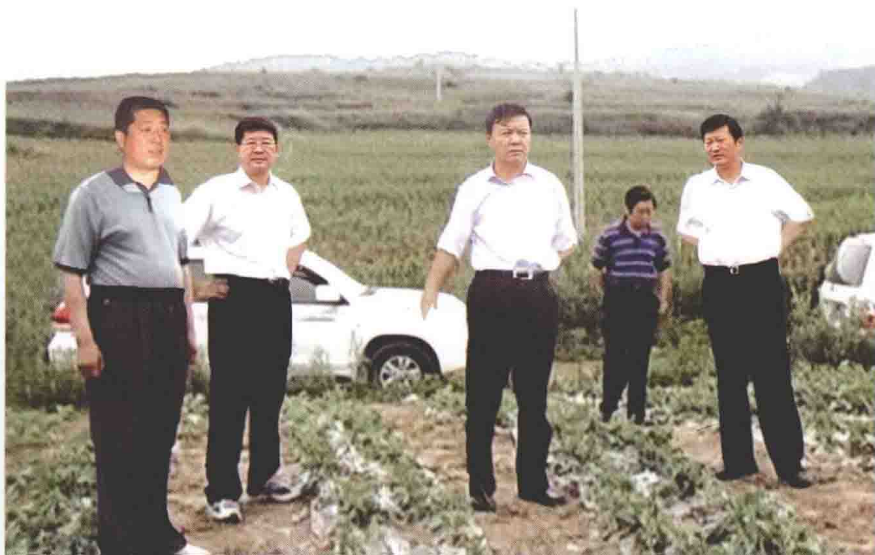
2008年6月29日，承德市市长张古江一行来围场检查灾情、慰问群众。