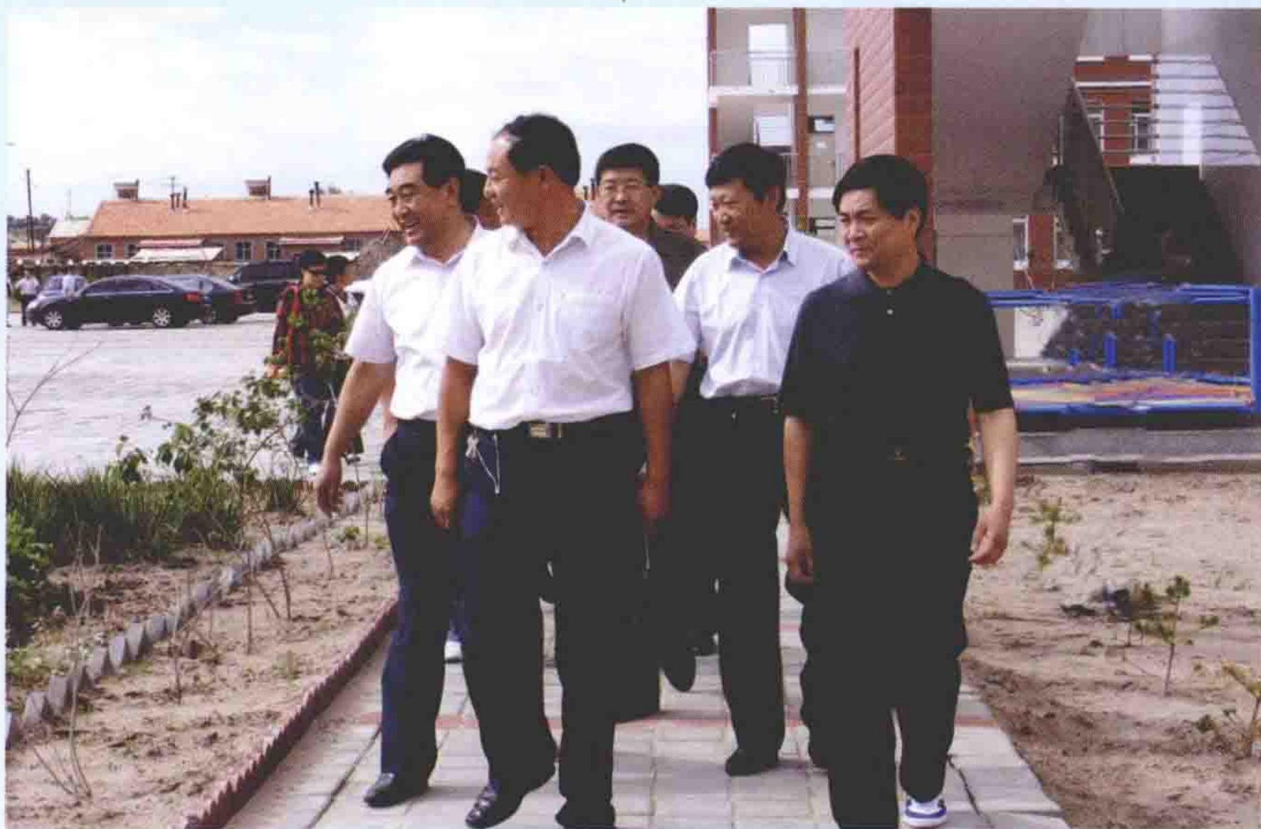
2008年8月2日，河北省副省长龙庄伟来围场实地查看御道口寄宿制小学教育教学设施。