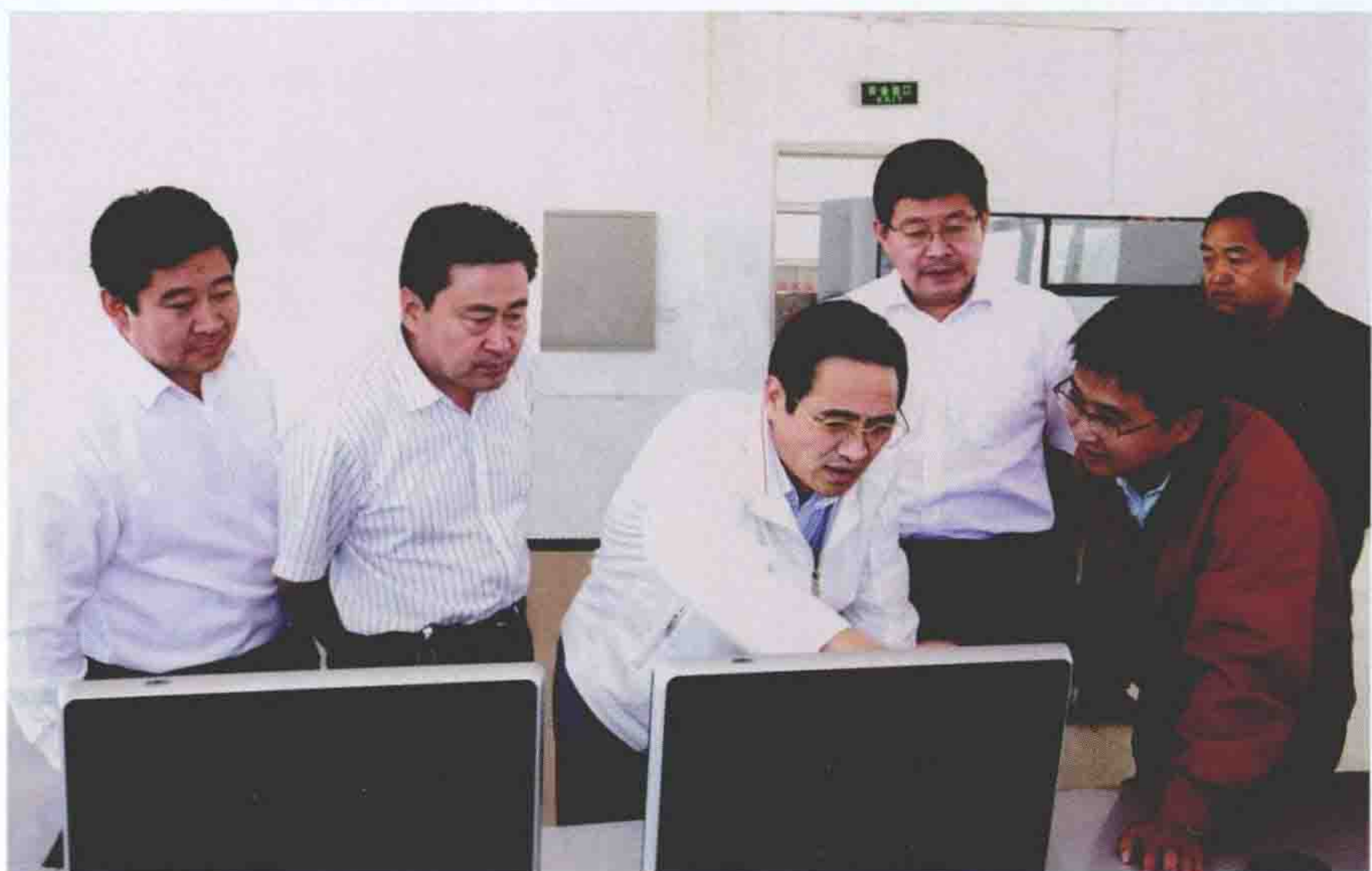
2008年8月29日，河北省省委常委、常务副省长付志方来围场就风电产业发展和旅游开发工作进行调研。