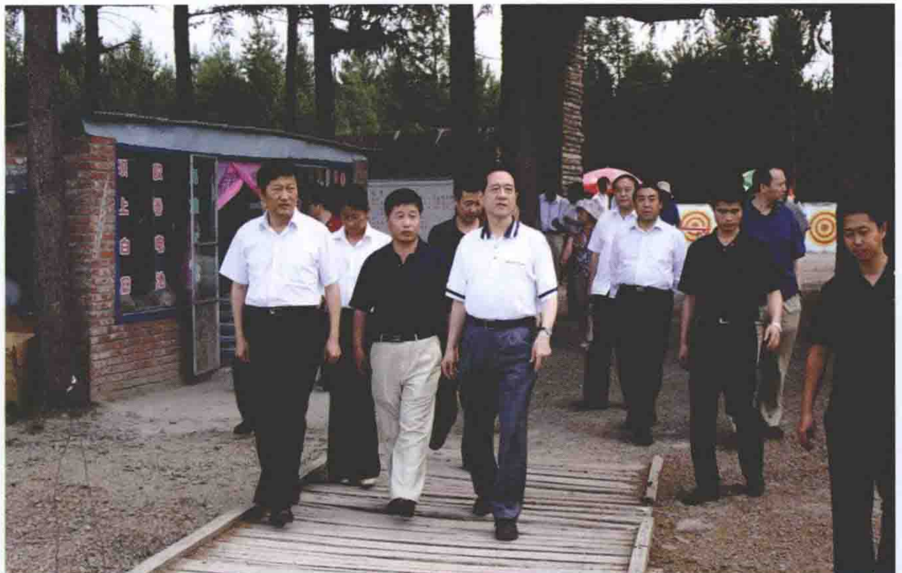
2007年7月2日，全国人大常委会副委员长韩启德来围场视察。