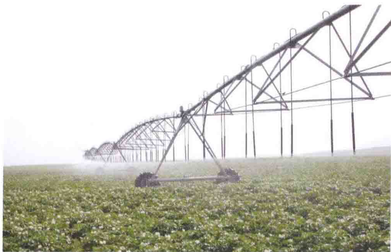
马铃薯新技术喷灌