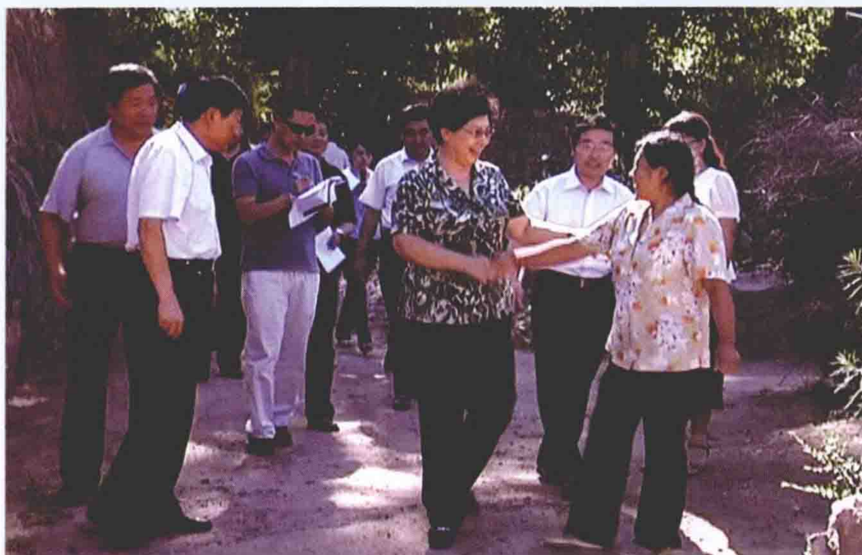
2009年8月11日， 出席围场满族蒙古族自治 县成立20周年庆典的 河北省副省长孙士彬深 入农村慰问群众。