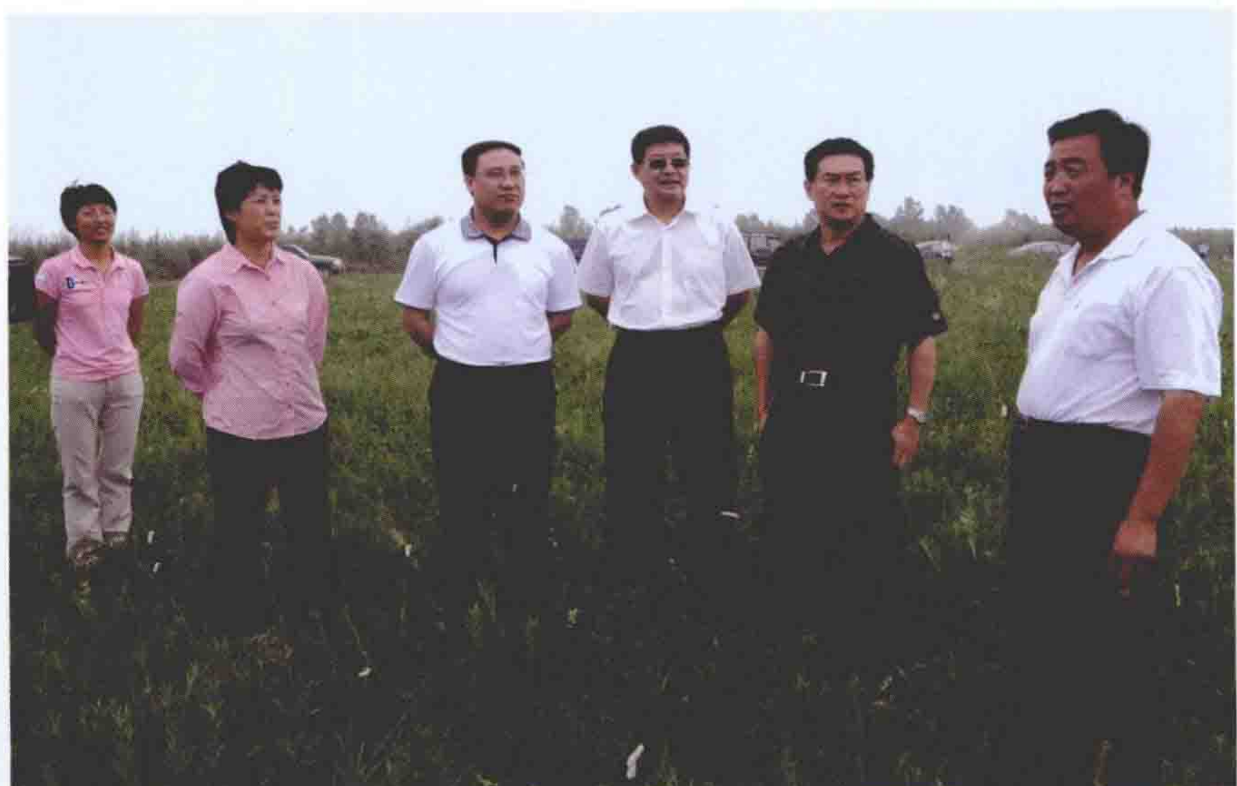
2008年7月29日，河北省常委、副省长杨崇勇来围场就旅游开发工作进行调研。