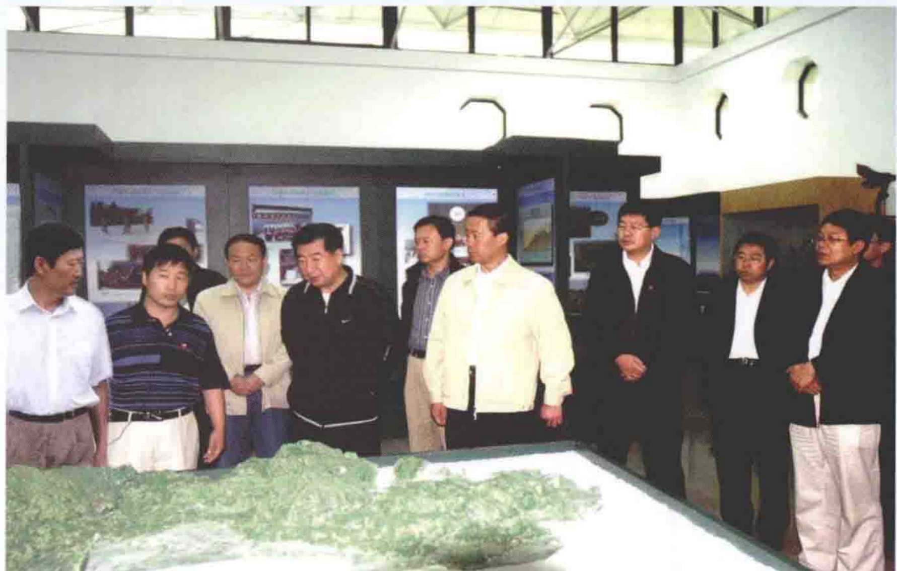
2007年8月4日，国务院副总理回良玉来围场视察。