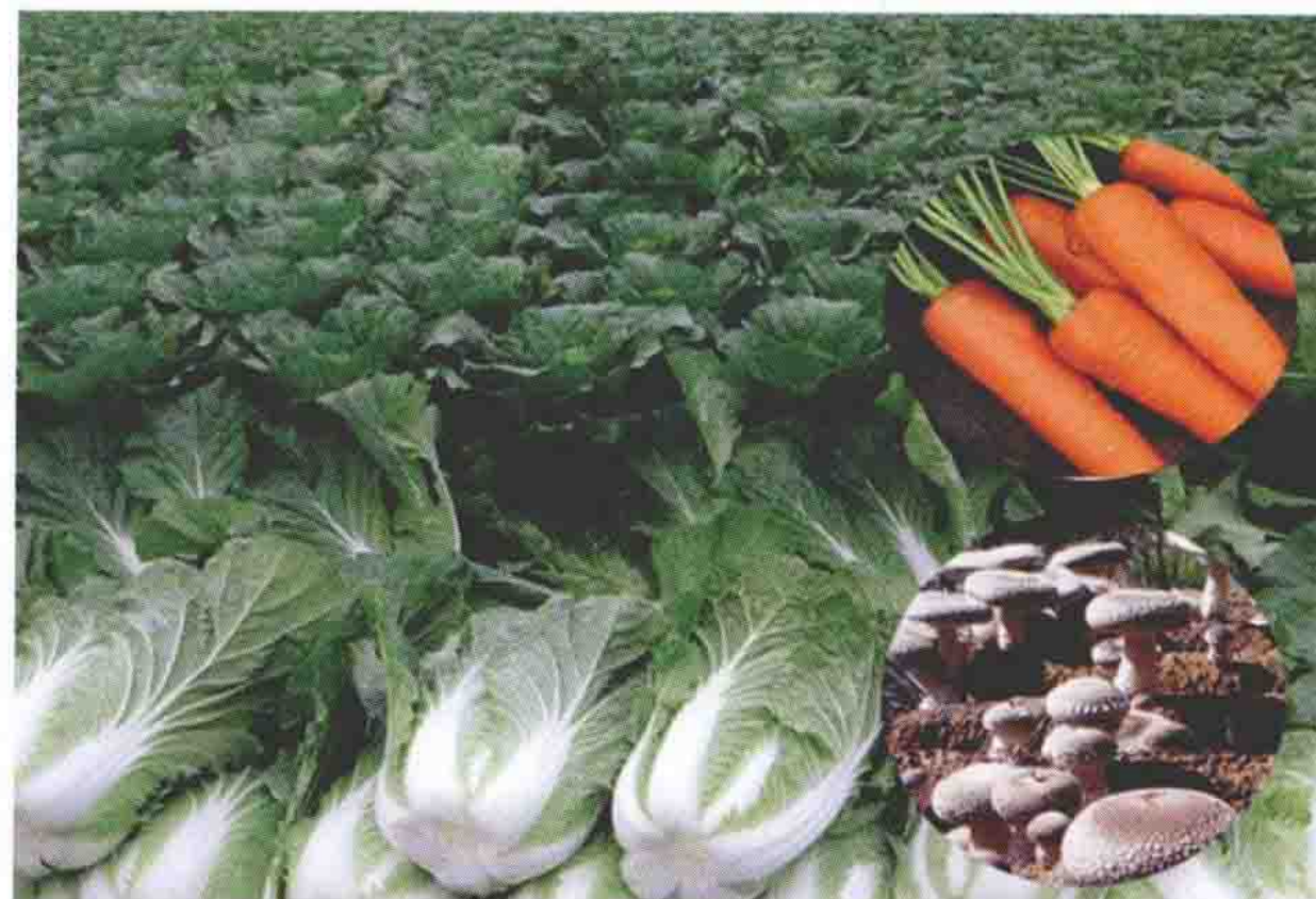
国家级无公害蔬菜生产基地