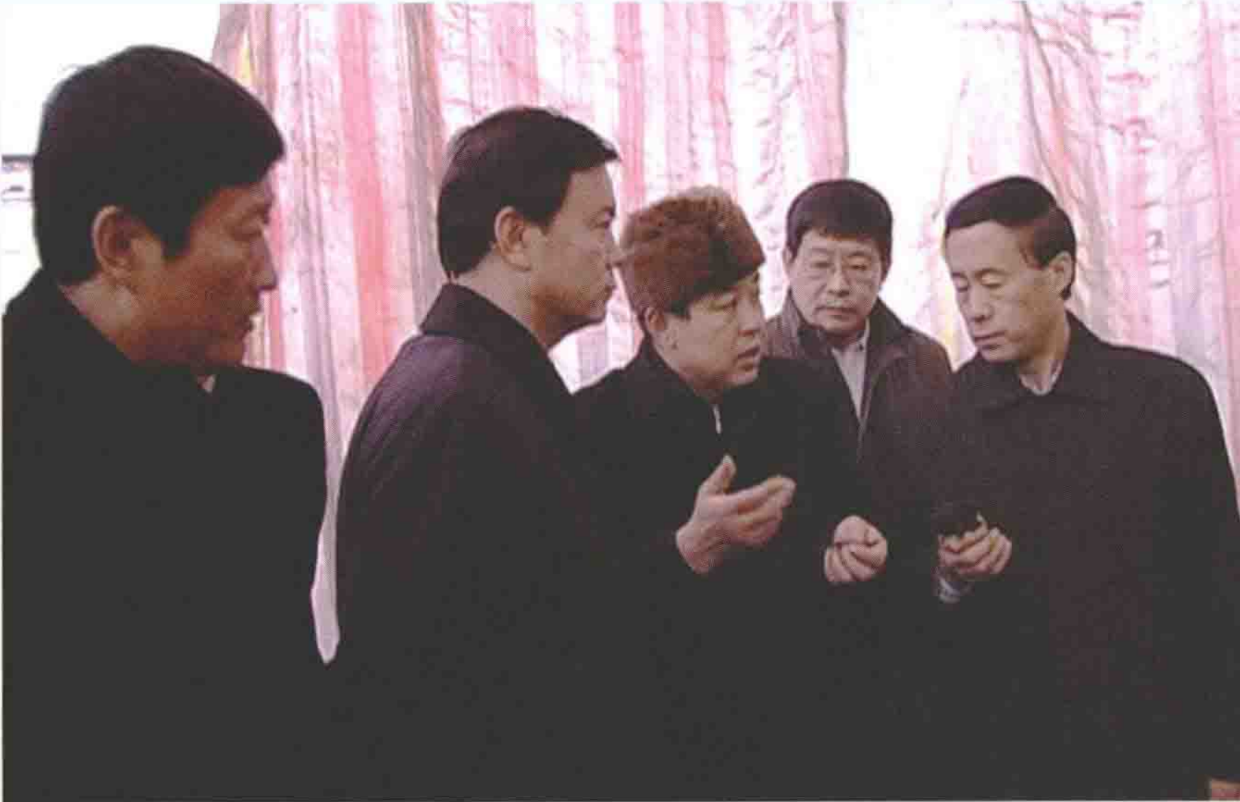
2007年2月11日，河北省副省长宋恩华一行来围场就企业发展情况进行调研。