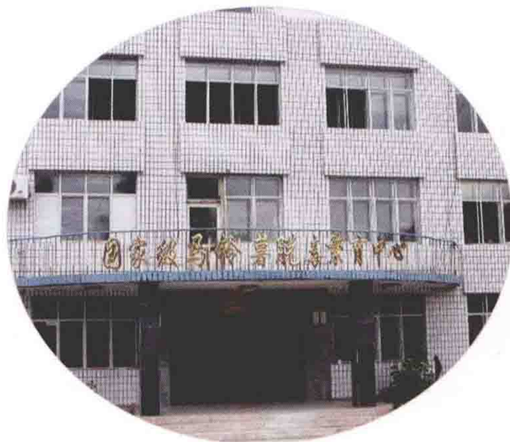
国家级马铃薯脱毒繁育中心