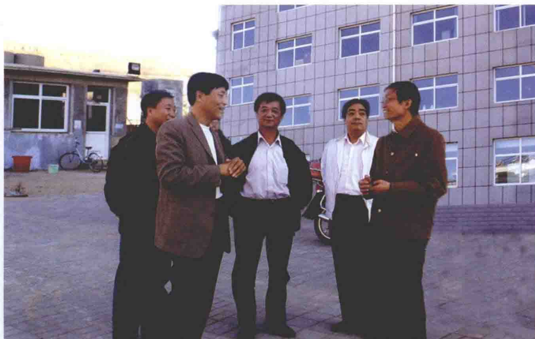
2009年10月4日， 中央档案馆馆长、国家 档案局局长杨冬权来围 场视察档案工作。