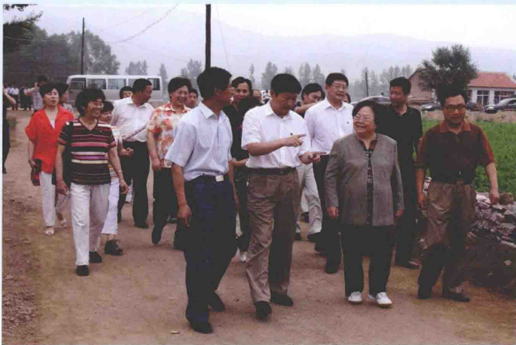
2007年7月13日，中国红十字会会长、原全国人大常委会副委员长彭珮云来围场视察。