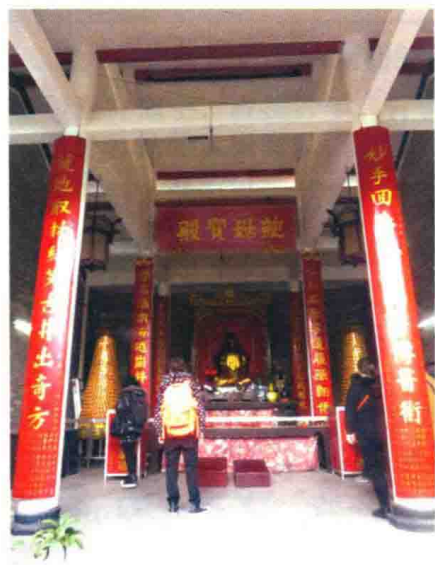
图 1-3 三元宫中的鲍姑殿