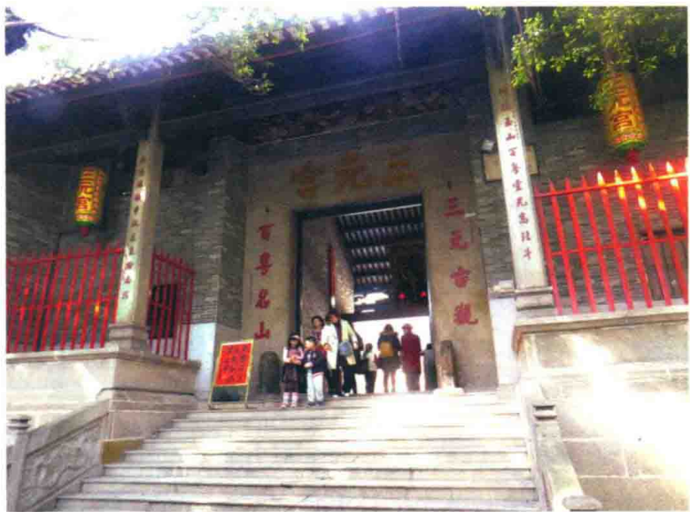
图 1-2 广州三元宫

赘瘤、赘疣等疾病，治好无数患者。据《羊城古钞》载：“每赘疣，灸之一炷，当即愈，不独愈病，且兼获美艳。”这是较早的关于针灸美容的记载。