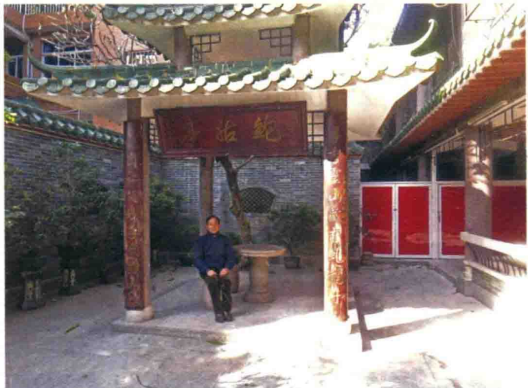
图 1-4 三元宫中的鲍姑亭