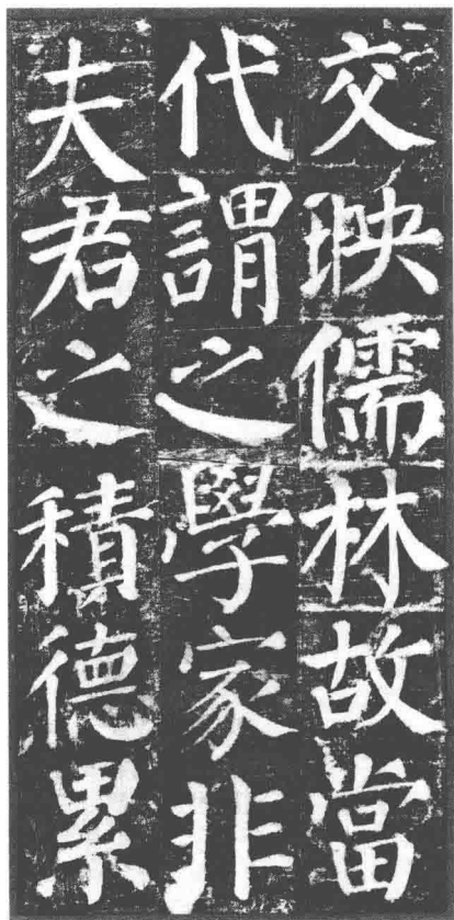
颜真卿《颜勤礼碑》(局部)