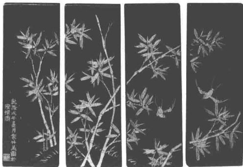
清乾隆年间詹成圭制竹燕图诗集锦墨