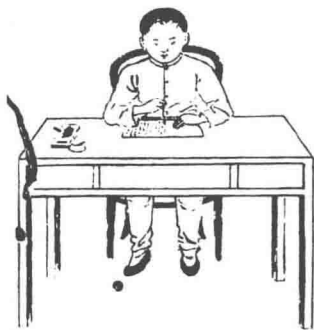
毛笔习字端正姿势图

当作字之时，桌椅高低不合度，或身体不正坐，则骨脊渐成弯曲形。最能妨血液之运行，害身体之健康。学者所当力戒。