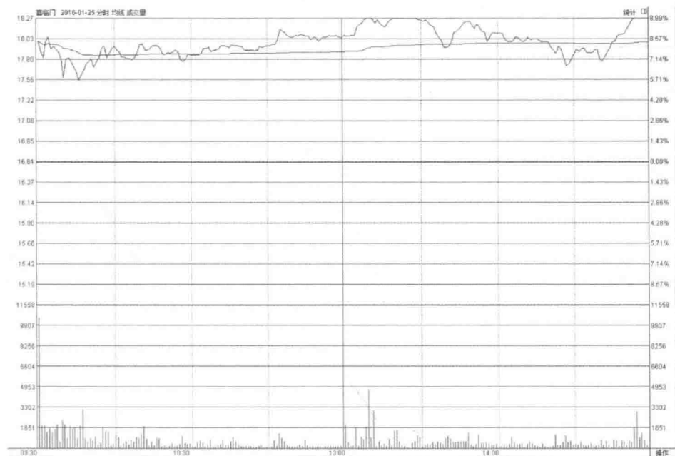
图1-1 喜临门分时走势图

如图1-1所示，2016年1月24日下午，喜临门（603008）发布业绩预增公告，公司预计2015年年度实现归属于上市公司股东的净利润与上年同期相比将增加100%~150%。这一天是星期日，受这条消息影响，随后一日，也就是1月25日，喜临门股价大幅高开并且持续上涨，最终以涨停的价格收盘。