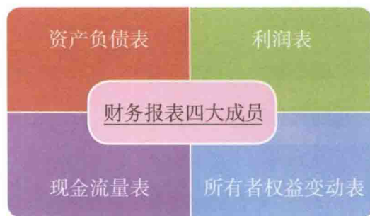
图 1-2 财务报表的组成部分

这四张报表反映的都是企业的历史财务状况，分析它们就是为了查看企业财务过去做得怎么样，未来需要做什么。下面一起来看一下这些报表都“长”什么样子。