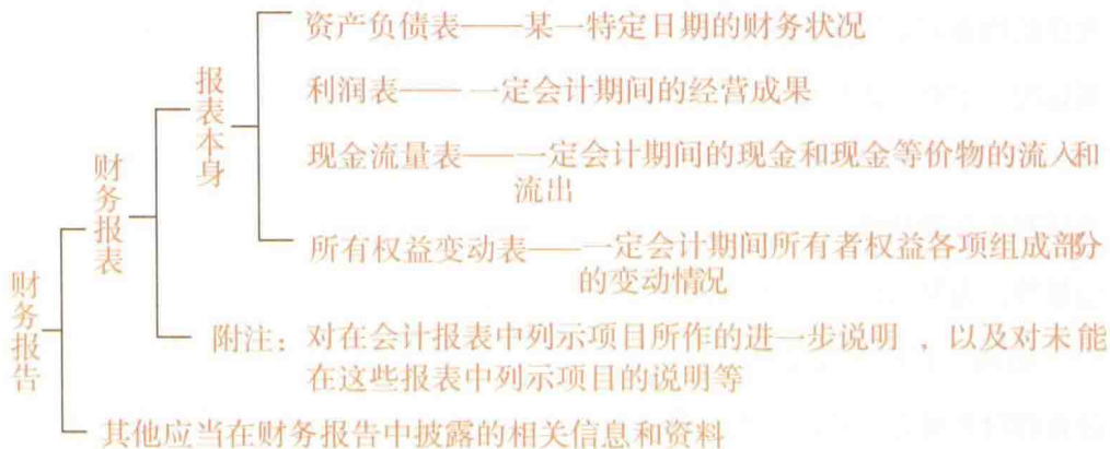
表 1-1 财务报告的组成

财务报表是对外报告，主要是给投资者、债权人和政府相关管理部门看的，所以必须保证财务报表的可理解性，要让别人看得懂。既然想让别人看得懂，那么就不能以企业自身的规则为标准，而应按照公认的会计准则来完成财务报表的编制。