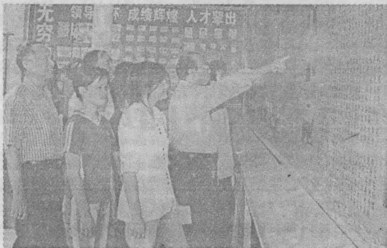
明瑞中学师生在“邓小平题写校名纪念馆”接受教育。