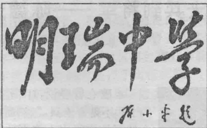
邓小平亲笔题写的校名“明瑞中学”。