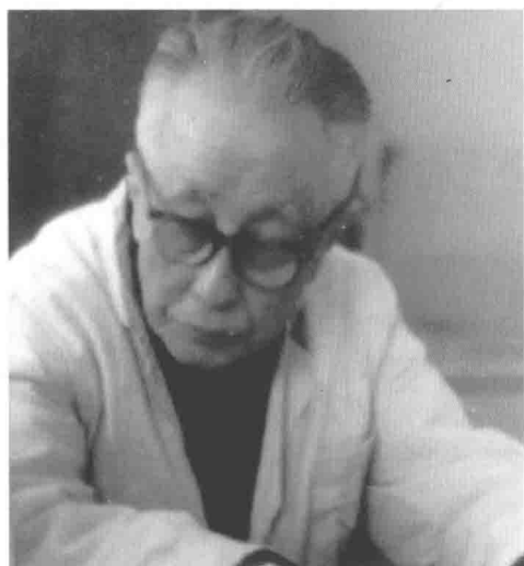
我的老师，著名经方大师胡希恕先生