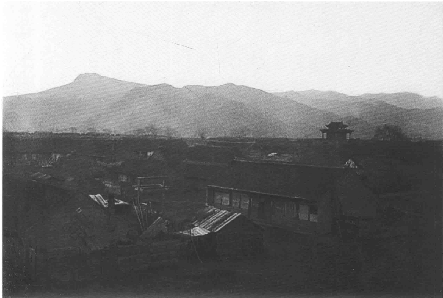
山脚下的村落 > A village at the foot of the mountain