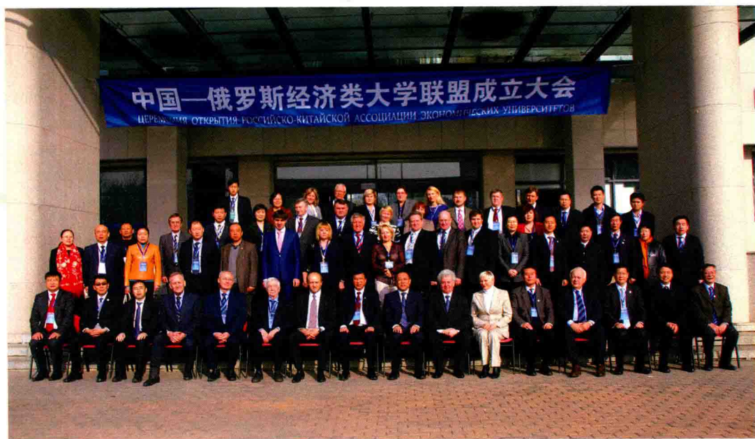
参加中国—俄罗斯经济类大学联盟成立大会的领导、嘉宾合影

中俄经济类大学联盟的成立是学校主动服务国家战略，积极响应和落实中俄人文合作委员会教育合作分委会会议精神的重要举措。联盟以培养复合型高端人才为宗旨，在人才培养、教师互换、科研合作等多个领域加大合作力度。