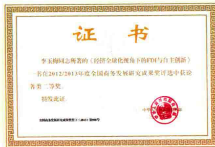
全国商务发展研究成果奖二等奖证书