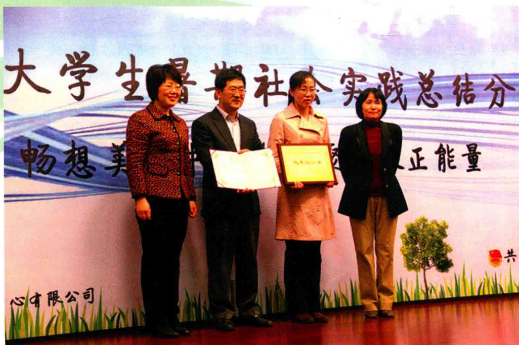
校领导为 2013 年暑期社会实践成果展示获奖者颁奖

15 个优秀作品参加市级“挑战杯”竞赛，取得 1 个特等奖、1 个一等奖、3 个二等奖、7 个三等奖，市级特等奖作品获全国决赛三等奖。本科生暑期社会实践活动共吸引 367 支团队、3424 人参与，6 支团队获评北京市级重点团队，10 支团队获评北京市优秀团队，10 篇报告入选北京市优秀实践成果。研究生寒假社会实践调研活动 24 支团队，500 人参与。在第四届北京大学生艺术展演中，7 个艺术社团排演的 10 个选送节目全部获奖，其中 3 个一等奖、7 个二等奖。在第四届首都高校校园记者基本功大赛中，学校代表队荣获团体特等奖，均创历史最好成绩。本年度 128 个学生科研项目成功结项，8000 人次志愿者参与各类志愿服务活动，近 300 个团学组织、个人获市级以上奖项。全年研究生科研创新项目 107 项（A 类 1 篇，B 类 9 篇，C 类 33 篇），被 EI 检索 4 篇。学校复合型人才培养模式品牌特色日益凸显。