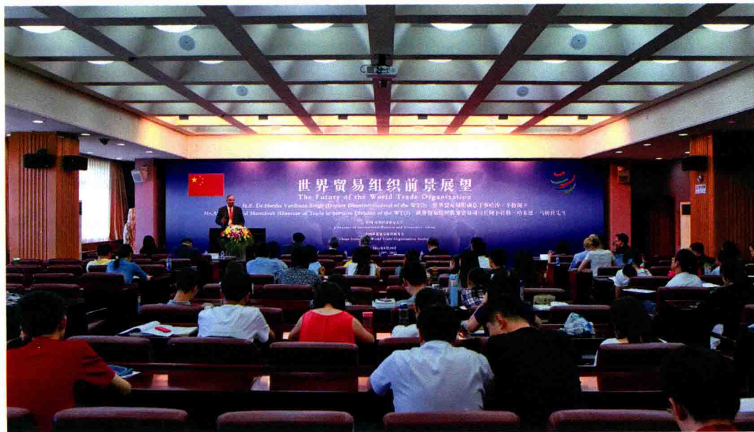
5月29日，WTO副总干事哈沙·辛格来校访问并做演讲。

5月31日，WTO副总干事哈沙·辛格、服务贸易司司长阿卜杜勒·哈米德·马姆杜、太平洋经济合作理事会主席唐·坎贝尔、欧盟竞争总司副总司长本德·隆海尔先生等多位国际著名学者来校访问并作精彩演讲。