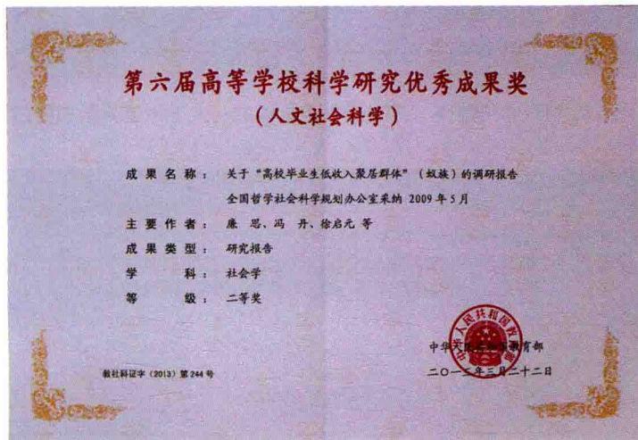
教育部第六届高等学校科学研究优秀成果奖二等奖证书

2013年,学校产出各类科研成果1638项,发表各类论文1381篇,SSCI收录58篇,出版各类著作170部。2013年,学校获得省部级奖励27项。其中,第六届“高等学校科学研究优秀成果奖(人文社会科学)”10项,2012/2013年度全国商务发展研究成果奖16项,第十一届全国统计科研优秀成果奖1项,再创历史新高。