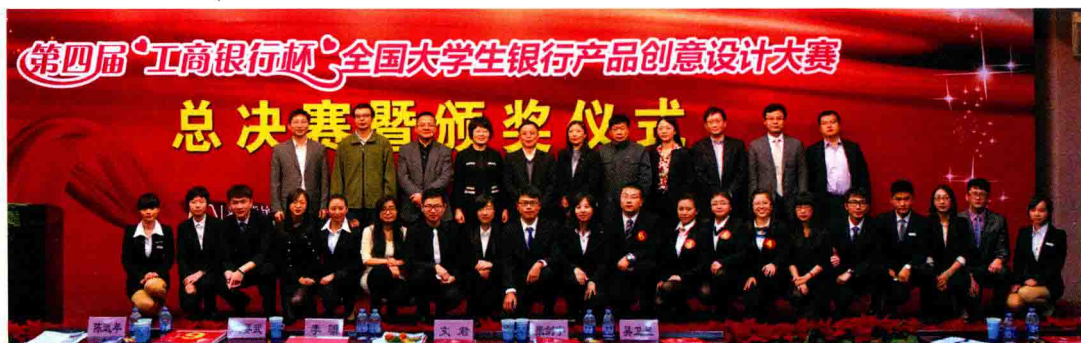
在第四届工商银行杯全国大学生银行产品创意设计大赛中，学校选手荣获一等奖。

15 个优秀作品参加市级“挑战杯”竞赛，取得 1 个特等奖、1 个一等奖、3 个二等奖、7 个三等奖，市级特等奖作品获全国决赛三等奖。本科生暑期社会实践活动共吸引 367 支团队、3424 人参与，6 支团队获评北京市级重点团队，10 支团队获评北京市优秀团队，10 篇报告入选北京市优秀实践成果。研究生寒假社会实践调研活动 24 支团队，500 人参与。在第四届北京大学生艺术展演中，7 个艺术社团排演的 10 个选送节目全部获奖，其中 3 个一等奖、7 个二等奖。在第四届首都高校校园记者基本功大赛中，学校代表队荣获团体特等奖，均创历史最好成绩。本年度 128 个学生科研项目成功结项，8000 人次志愿者参与各类志愿服务活动，近 300 个团学组织、个人获市级以上奖项。全年研究生科研创新项目 107 项（A 类 1 篇，B 类 9 篇，C 类 33 篇），被 EI 检索 4 篇。学校复合型人才培养模式品牌特色日益凸显。