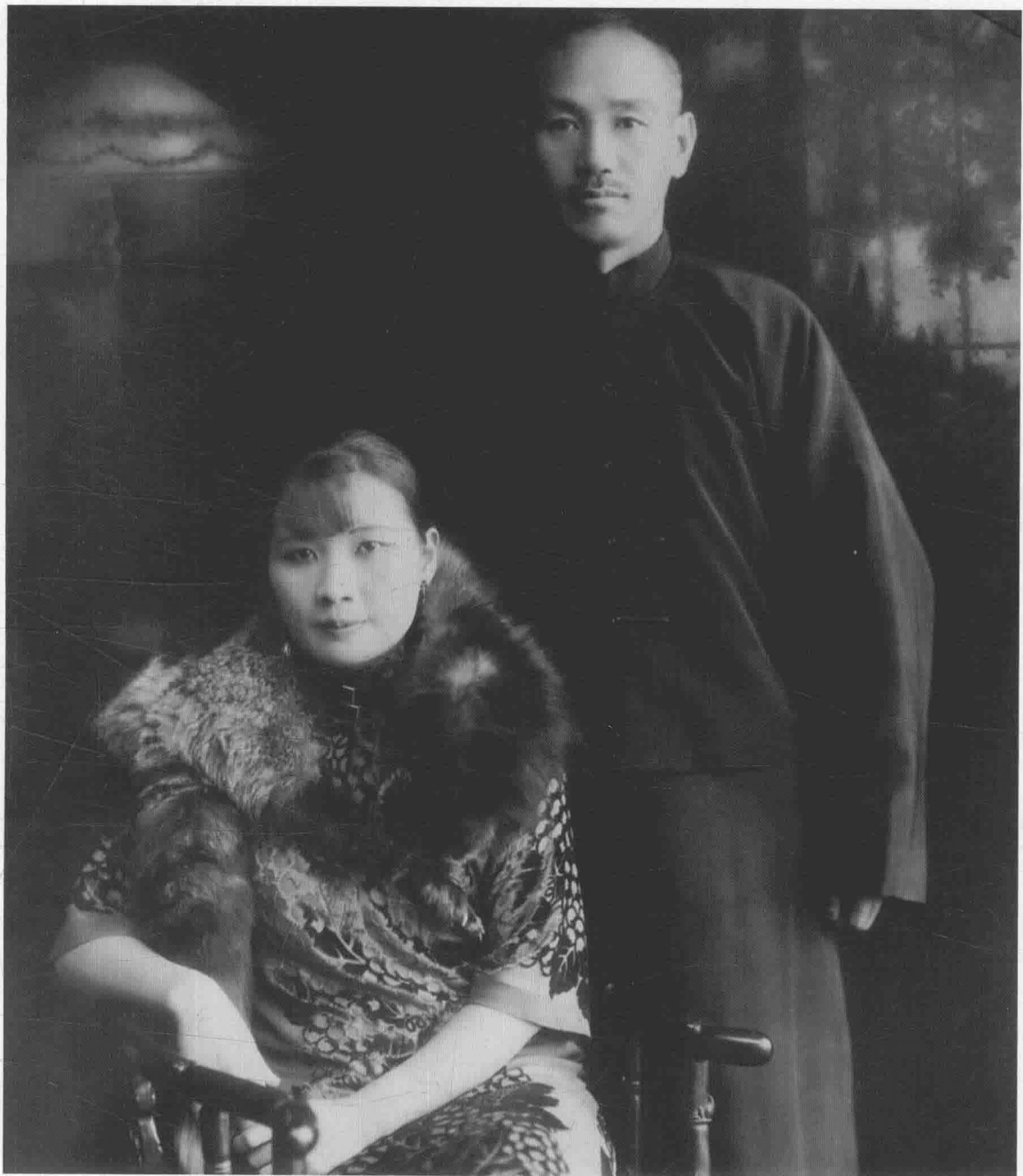
蒋介石和宋美龄 > Chiang Kai-shek and Song Mei-ling