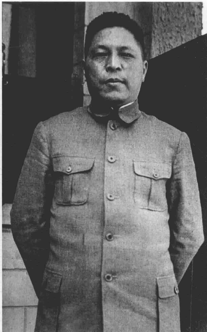
蒋鼎文将军像，陕西省主席 > The picture of General Jiang Dingwen, President of Shaanxi Province