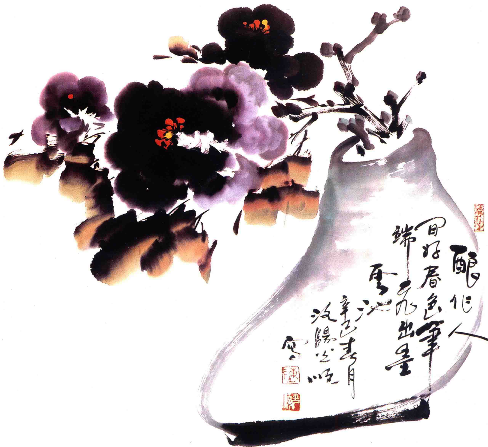
试读结束：需要全本请在线购买：醞作人间好春色 笔端飞出墨云池 68×68cm