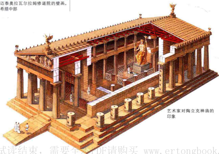
艺术家对陶立克神庙的印象