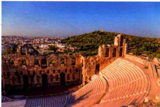
壮观的罗马建筑阿提库斯剧场

不妨以欣赏数十支渡轮从 比雷埃夫斯 （158~159页）的主要港口出发前往各岛屿这一迷人的景象开始新的一天。比雷埃夫斯拥有优雅的新古典主义建筑、公园和博物馆，包括受到剧院风格启发的、拥有许多舞台装饰的Pános Aravantinoú博物馆。你可以沿着路标一路前往 米克洛利马洛港口 ，找一家