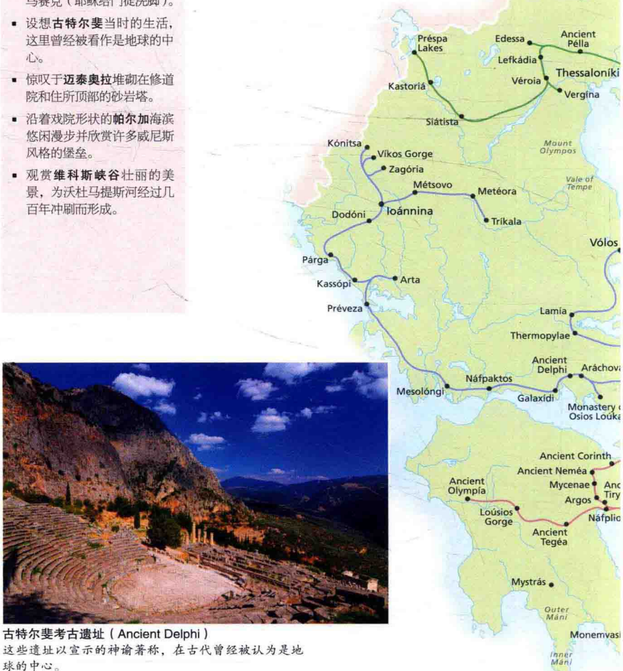
古特尔斐考古遗址（Ancient Delphi）