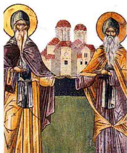
迈泰奥拉瓦尔拉姆修道院的壁画，希腊中部