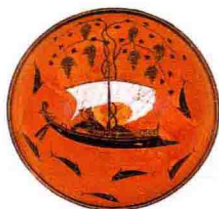
描绘酒神狄俄尼索斯的黑彩碗