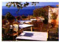
伯罗奔尼撒半岛的传统咖啡馆