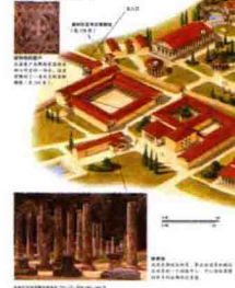
古奥林匹亚的竞技场