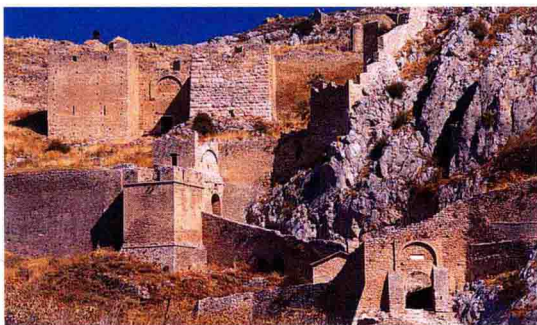
通往科林斯卫城的三条必经之路