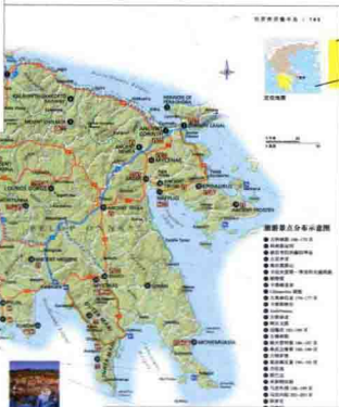
希腊本土主要区域