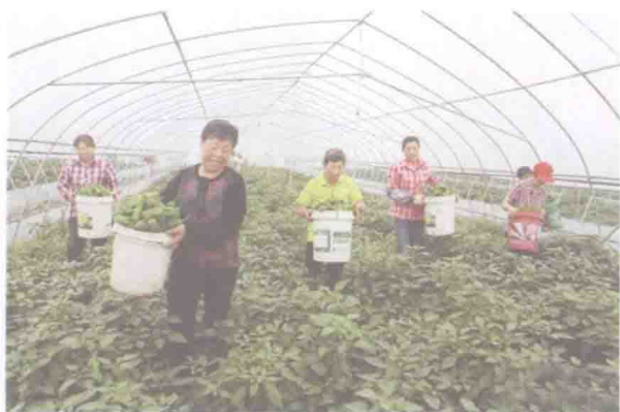
▲ 大棚蔬菜喜获丰收