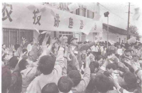
▲ 大柴湖这“壶”水烧开了