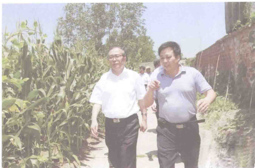
▲ 2013年，湖北省委、省政府实施振兴柴湖省级战略。省委书记李鸿忠（左一）四进大柴湖，问计于民，共谋发展