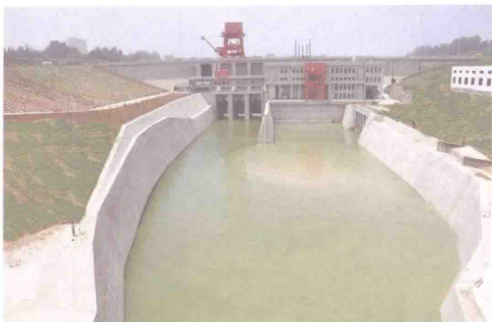
▲ 一渠清水向北流。这是位于浙川县的渠首，南水北调中线的“总开关”