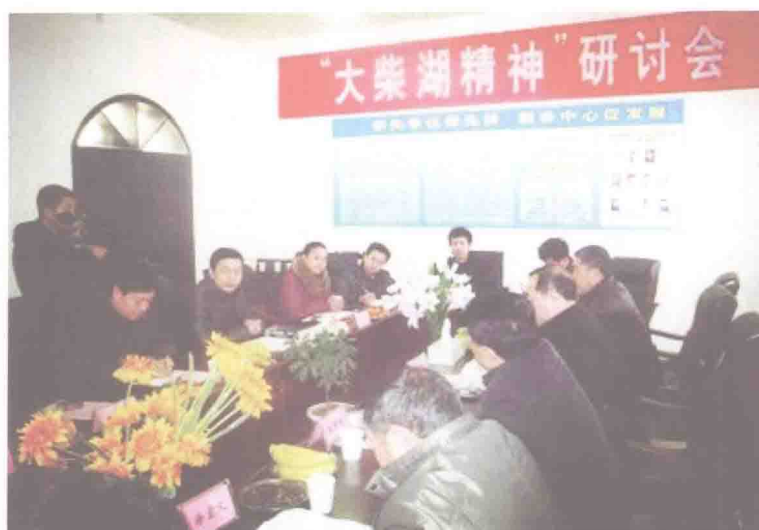
▲ “大柴湖精神”引起学界和社会的重视