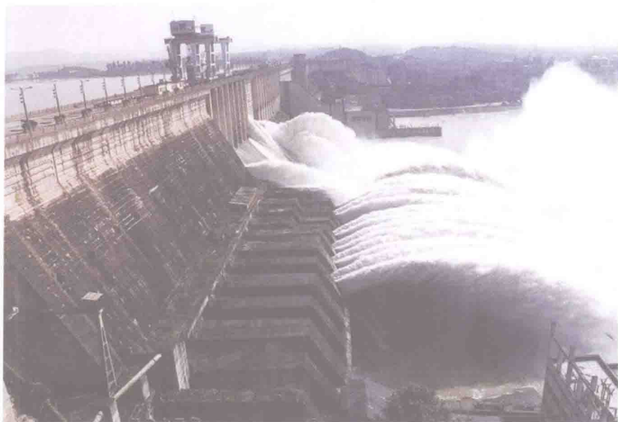
▲ 雄伟的丹江口大坝改变了汉江的命运,也改变了库区人的命运