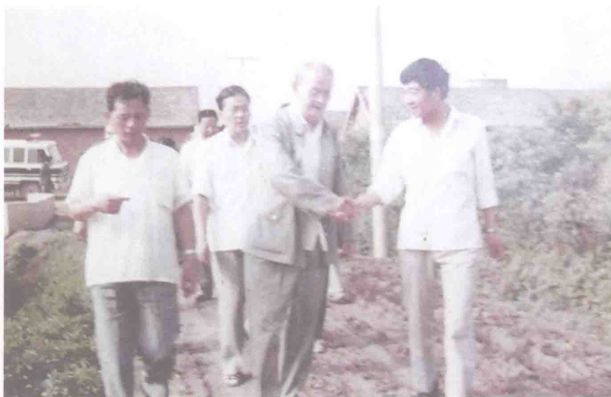
▲ 1989年,国家水利部副部长黄友若(右二)考察大柴湖移民工作