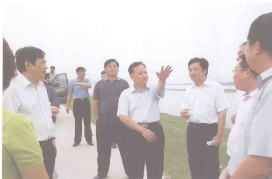
▲ 2006年8月1日，湖北省省长罗清泉带领专家实地考察，为大柴湖自来水厂选址