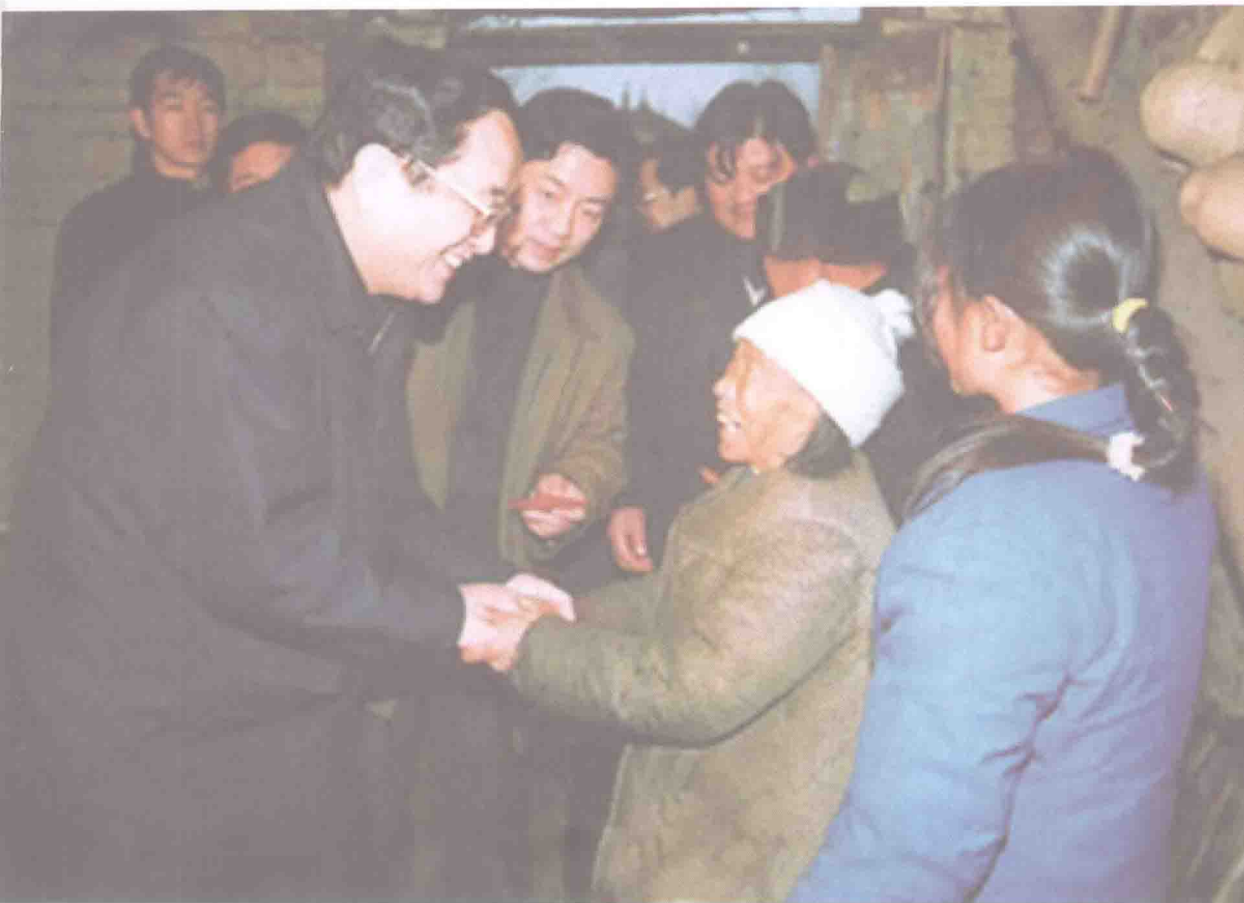
▲ 时任中共中央政治局委员、湖北省委书记俞正声曾三次深入大柴湖移民家中调研。图为2004年1月8日,俞正声在大柴湖看望老移民