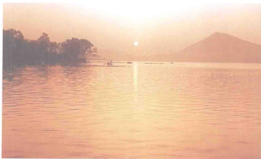
▲ 大柴湖移民的故土就在这美丽的丹江口水库下面