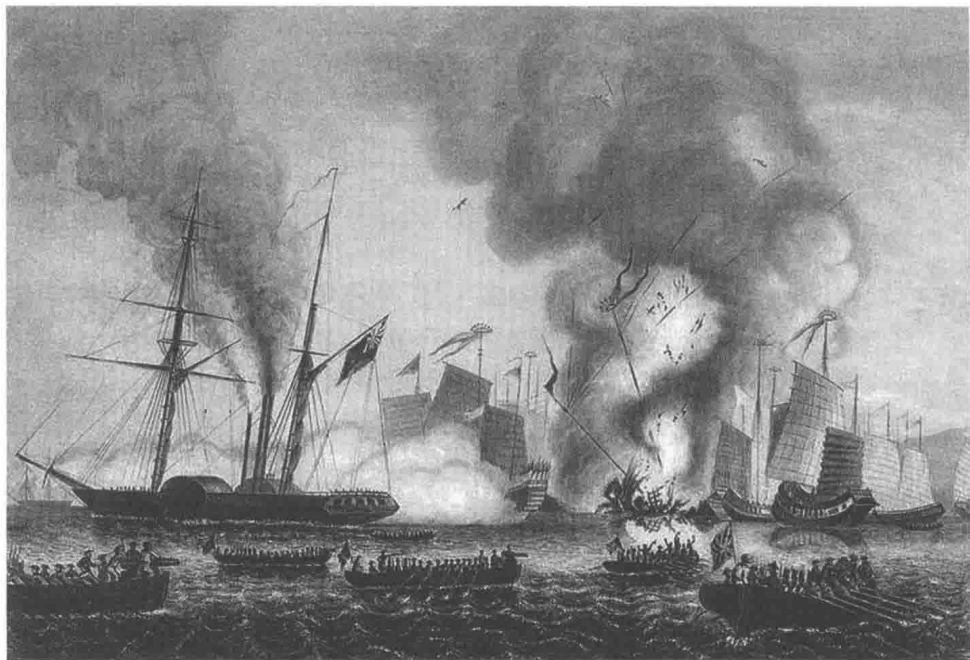
第一次鸦片战争时，清水师在虎门外大角、沙角炮台与英军激战。图为英国随军画师所绘制

本主义工业帝国的英国，在工业的发展中，也出现了生产过剩的困扰。法、美、俄等国也紧随其后存在这种问题。1825年并为之爆发了西方资本主义历史上因为生产过剩带来的经济危机。