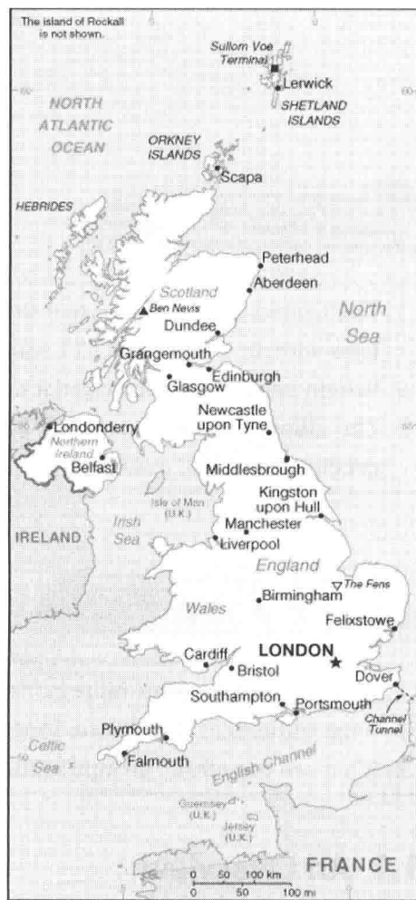
Map of the UK

Great Britain has a highly irregular coastline with many bays and inlets (水湾). The total coastal line is about 8,000 kilometres long, presenting the best scenery in Britain. The western coast is characterized by cliffs and rocky headlands, while sand or pebble beaches as well as tall limestone or chalk cliffs are the main features of the more gentle southern and eastern coasts. The narrow sea, the English Channel, which separates the UK from the European continent, is about 560 kilometres long with varied width from 240 kilometres at its widest and only 34 kilometres in the Strait of Dover (多佛海峡) where it is the narrowest point. With the Channel Tunnel, the UK is connected with the European continent.