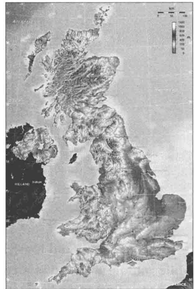
Topography of the UK

The Lowland zone lies in the south and east of Great Britain. Generally, most of the area is less than 150 metres above sea level. Occupying most of England, it consists of rolling plains broken up by chains of low hills. The broad rolling Midland Plain lies to the south of the Pennine Chain, to the northwest of which is the Lancashire-Cheshire Plain and another plain extends from the eastern slope of the Pennines to