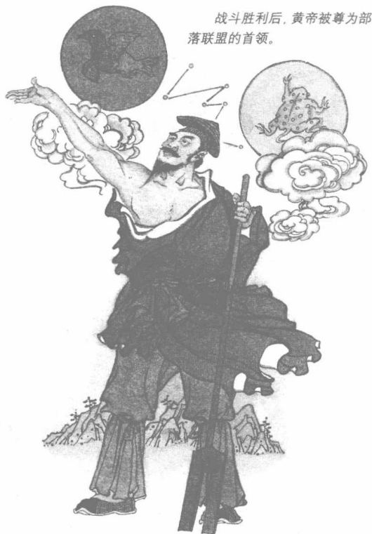
战斗胜利后，黄帝被尊为部落联盟的首领。

通过这次战争，黄帝的威信达到了空前的高度。中原各个部落听说黄帝杀死了蚩尤，都纷纷来朝拜归顺。在各部落首领的一致推举下，黄帝成为了部落联盟的首领，并被尊为天子。此后，以黄帝和炎帝部落为核心，中原各个部落不断融合，终于形成了一个共同的族体——华夏族。黄帝与炎帝被奉为华夏民族的始祖，后人都自称为“华夏子孙”。